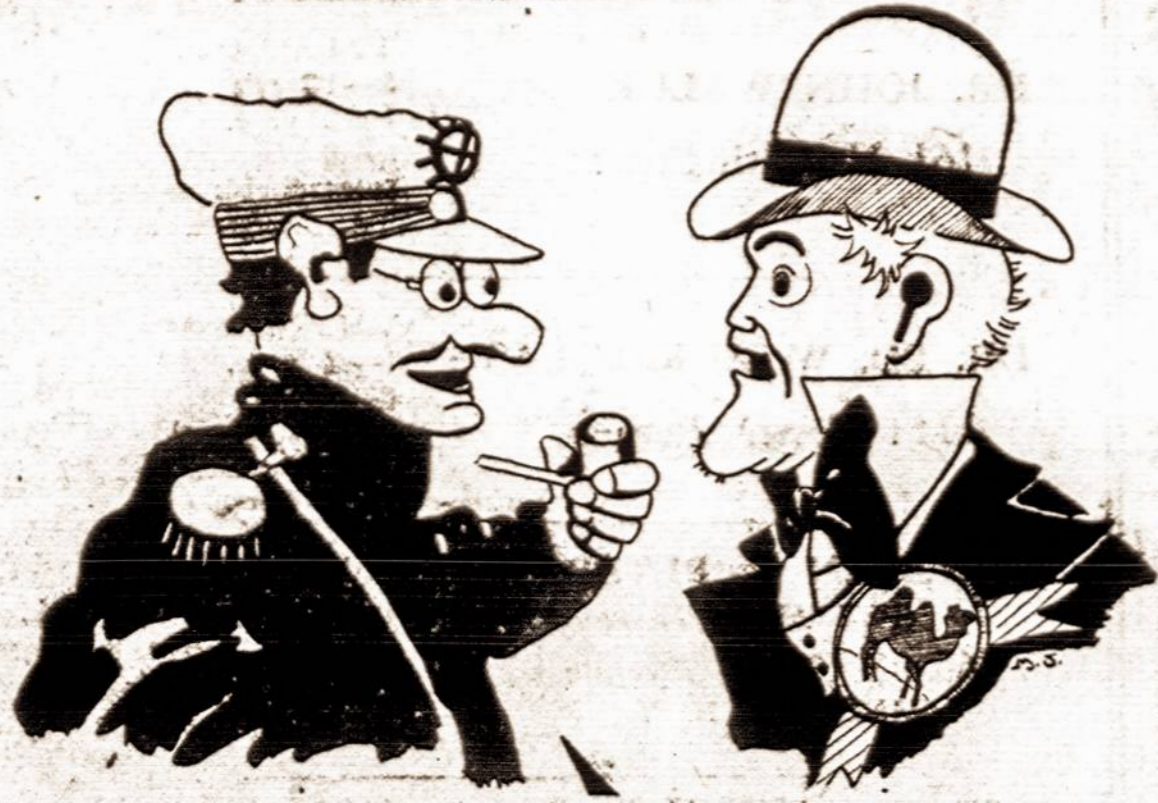
Maikio Tėvas šnekasi su Sventakuprių Tėvu