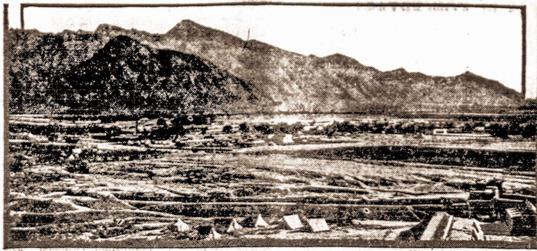
Quetta miestas šiaurės vakarų Baluchistane, Indijoje, kur didelio žemės drebėjimo metu žuvo per 56,000 žmonių ir keliolika tukstančių sunkiai sužeista. Tame žemės drebėjime žuvo ir apie 100 europiečių, tarp jų apie 50 anglų karo aviacijos karininkų ir kareivių.