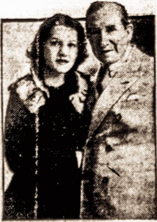
20 metų amžiaus mokinė žinomia dienomis vedė 25 metų amžiaus merginą.

Zmonių buvo gana gražus burys, nors iš ryto ir buvo apsiniaukęs dangus, bet vėliau buvo graži diena, tik pusėtinai šalta. Rengėjams liko gražaus pelno. Juozas Virbickas.