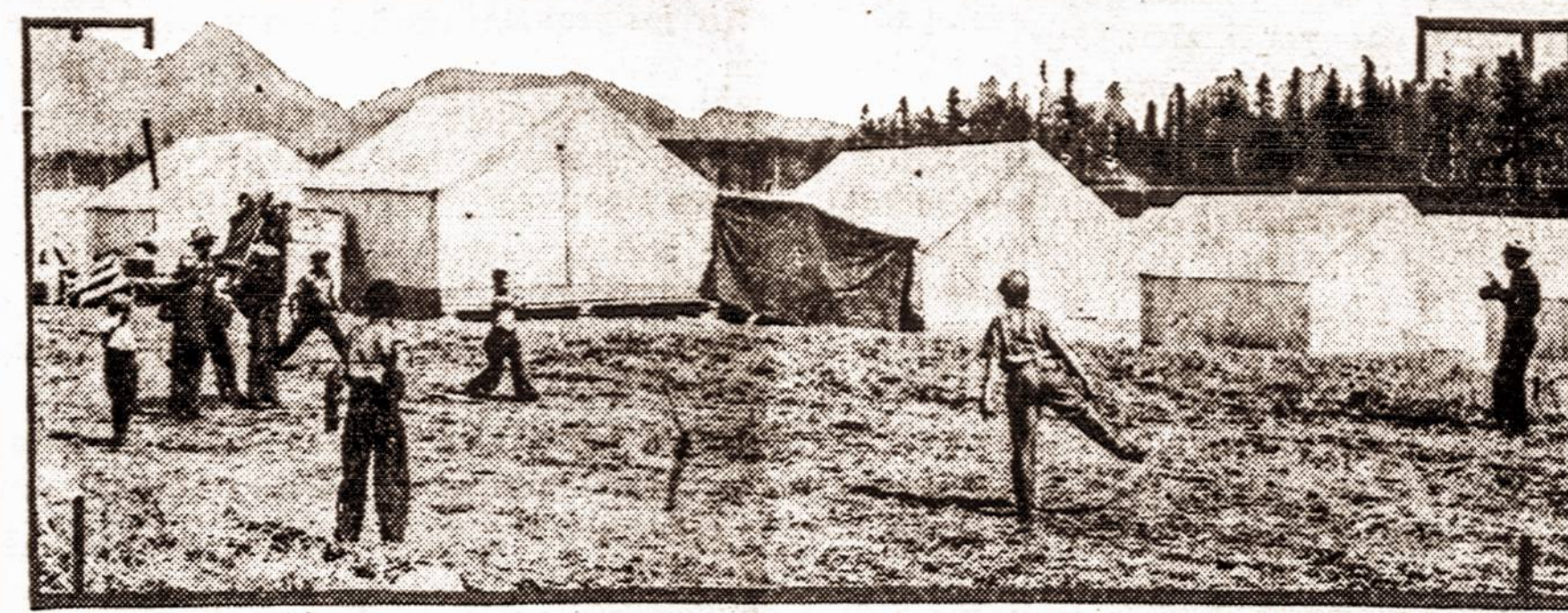
Vaikai vis vaikai, kai tik jų tėvai pionieriai apsigyveno Matanuska, Alaskoje, ir pasistatė palapines, vaikai tuojau įsitaisė sporto aikštę ir pradėjo žaisti. Ten, kur neseniai tik laukiniai gyvuliai bėgiojo, dabar steigiamą moderniška pionierių kolonija.