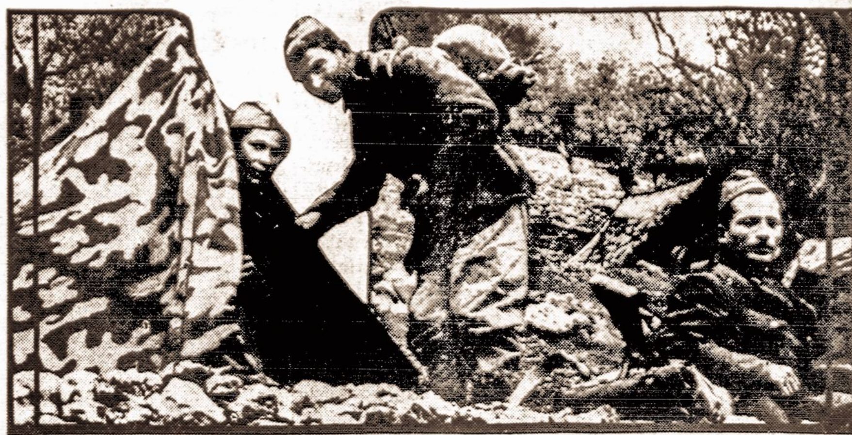
Kiekvienas du Italijos kareiviai turės vieną palapinę, kuri nudažyta įvairiomis spalvomis, kad prieš karo lėktuvai jų iš viršaus nepastebėtų. Tokių palapinių su kareiviais iš oro negalima atskirti nuo žemės spalvos.