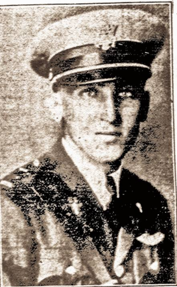
Leit. Feliksas Vaitkus