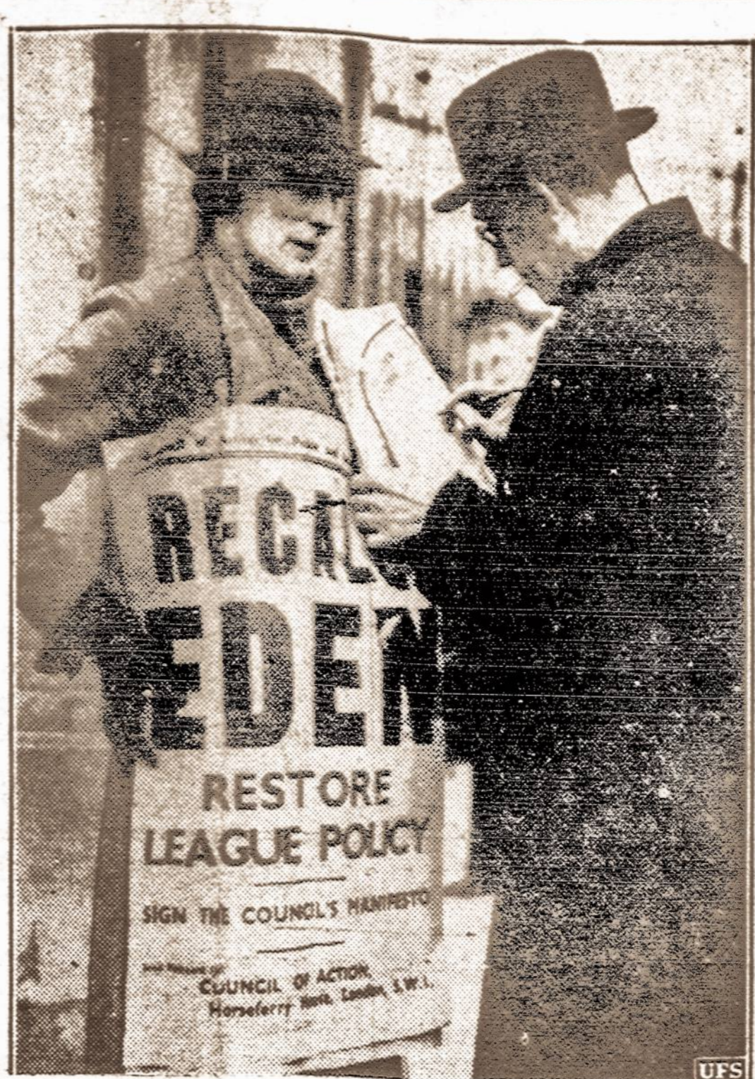
Reikalauja gražinti Edena. — Tuo tarpu kai Chamberlain tariaisi su Italija, Anglijos darbiečiai ir Edeno šalininkai reikalauja Edena gražinti į vyriausybę. Vyrų ir moterų vaikštineja Londono gatvėmis su šitokiais parašais.

Štai kodėl negalima nerašyti apie tą Maskvos bylą, kuri ne tik Sovietų Sąjungą, bet ir viso pasaulio komunistų judėjimą apvertė aukštyn kojomis.