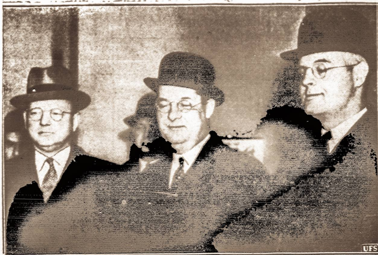
Wall Stryto vargai. — New Yorko finansiniuose centruose didelės sensacijos ir nemažai rūpesnio sukėlė žinia apie Richard Whitney and Co., firmos bankrotą. Pasirodo, kad firma išėkvojo daug svetimų pinigų. Į firmos įstaigą vakar atsilankė šie trys Valstybės Gynėjo advokatai dalyką iširti. Whitney vėliau prisipažino kaltas.

Nusikalto. — Richard Whitney, Wall Stryto šerų pirkinio ir pardavimo tarpininkų firmos pirmininkas, kuris išėkvojo apie $280,000 svetimų pinigų. Jis ir jo draugai dabar tardomi.