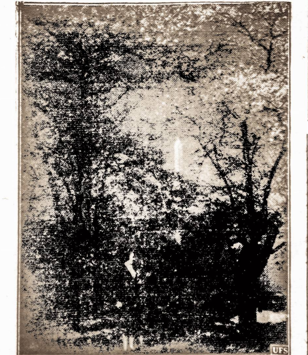
Washingtonė žydi japonų vyšnios. — Šiais metais Washingtonė japonų vyšnios pradėjo žydėti 10 dienų anksčiau, kitos vyšnios pražydės po 8 dienų. Šiuo metų laiku daugybė turistų atvyksta į Washingtoną pasigėrėti pavasario vaizdu.

VIENA. — Nuo to laiko kai Vokietija užėmė Austriją visą laiką suimėjami visi žinomieji ir įtariamieji nacių priešai, jų tarpe nemažai austrų ir žydų tautybės žmonių. Skelbiama, kad iki šiol naciai Austrijoje jau sulaukė apie 3,000 žmonių. Keletas šimtų nusižudė.