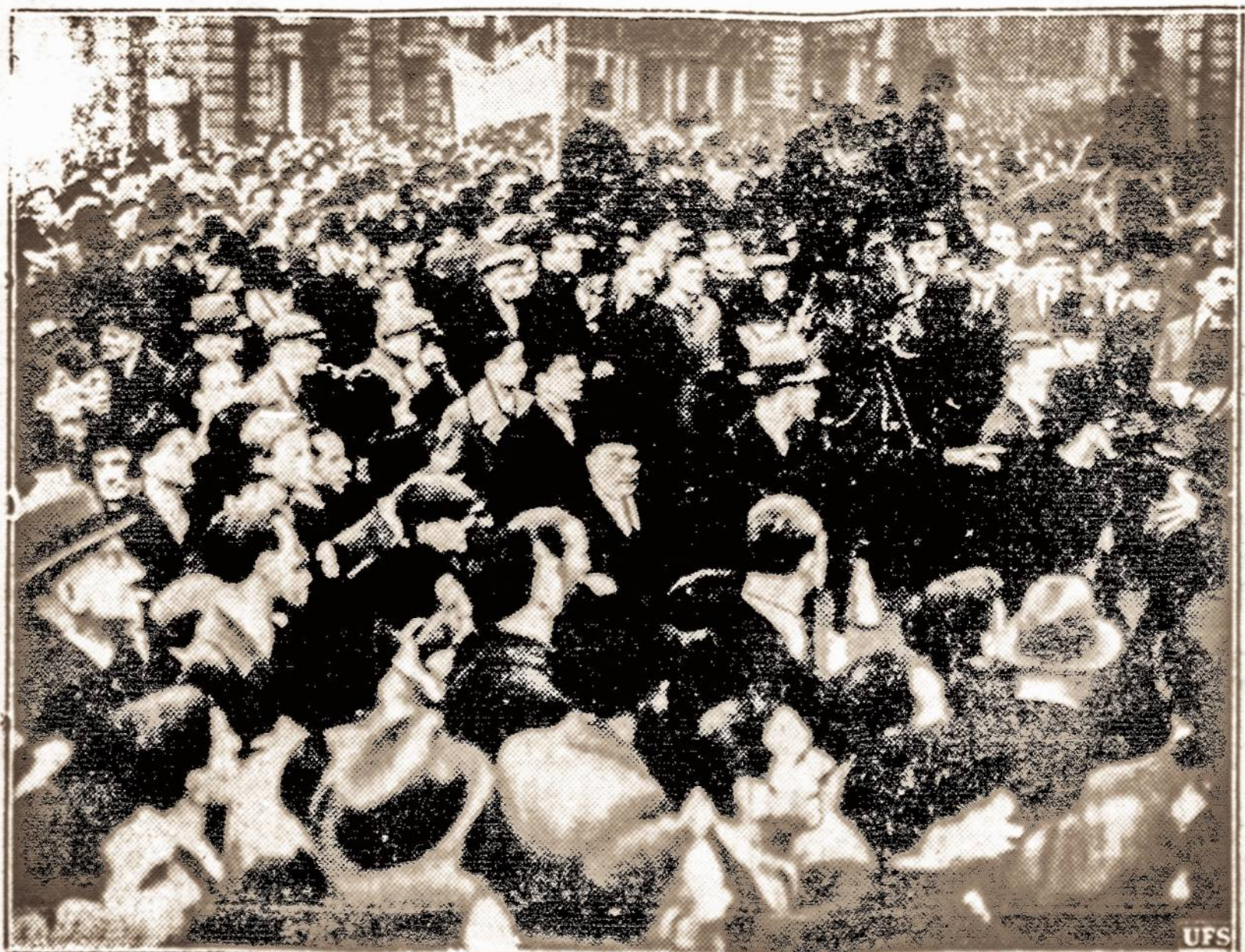
Demonstracijos London. — Kai Vokietija prijungė Austriją prie Vokietijos, Londone darbininkai surengė protesto demonstraciją. Čia matyti demonstrantai susirinkę prie Vokietijos pasiuntinybės Londone.

SHANGHAI, Kinija, kovo 23 d. — Nežiūrint, kad japonai užkariavo Sanchajų, iki šiol labai dažnai įvyksta įvairių užpuodinėjimų. Naktimis grupės kinų teroristų užpuolė prie visų ūkininkų namų plevė. Daugiausia užpuodinėjami japonai, civiliniai žmonės ir kariai.