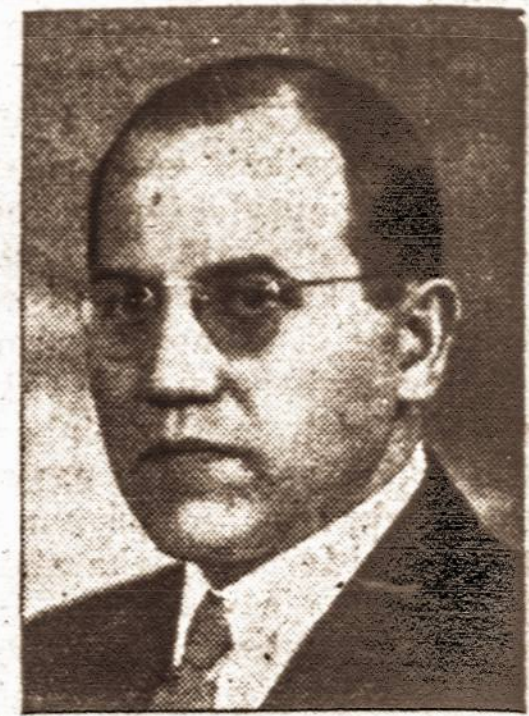
Kazys Skirpa Pirmas Lietuvos pasiuntinis Varšuvoje.

Šių metų vasario 16 dienos minėjime kai kuriose vietose prie visų ūkininkų namų plevė savo gražios vėliavos ir jos lapai, civiliniai žmonės ir kariai.