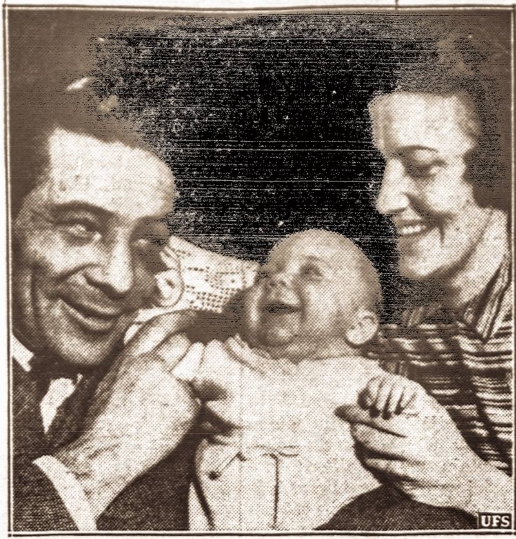
Boksininkas, sūnus ir žmona. — Boksininkas Max Bear, kuris nugalėjo Tommy Farr, jo sūnus ir žmona. Jis šių metų rudenį boksuosis su Joe Louis — Max Shmeling rungtynių laimėtoju.

Be savo kasdiniųjų reikalų pasikalbėsime ir apie Lietuvos apgyvendinimo reikalus ir kokių mes ateityje išimsime žygių Lietuvos nepriklausomybės apsaugojimui.