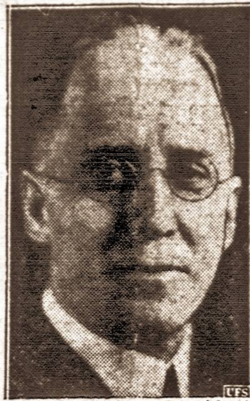
Atleistas. — Prezidento Roosevelto įsakymu iš tarnybos atleistas Tennessee Valley Authority pirmininkas dr. Arthur E. Morgan. Jis laiko savo atleidimą nepamatuotu ir paduos skundą Vyriausiajam Federaliniam Teismui.

gas, kad padidėtų jų perkamoji galia. Dabartinį pietinių valstybių pramoninių saugaliavimą jis vadina feŭdualizmu ir palygina su fašizmu ir komunizmu, kuris pasak prezidento, nė kiek vienas nuo kito nesiskiria. Ta proga prezidentas pareiškė, kad jis reikalauja, kad pietinių valstybių pramonininkai būtinau padidintų darbininkams algų normas ir duotų geresnes darbo sąlygas.