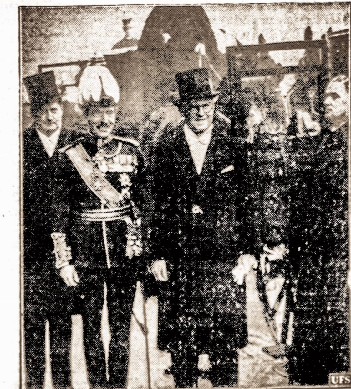
Įteikė karaliui savo kredencijas. — Jungtinių Valstybių pasiuntinys Anglijai Joseph P. Kennedy šiomis dienomis įteikė savo paskyrimo raštus Anglijos karaliui Jurgiui.

CAMBRIDGE, Mass. — Šiandien Cambridge karo laivyno bazėje policija sulaike du japonus, kurie fotografavo tiltą ir uostą. Buvo išaiškinta sulaikytų asmenybė ir vėliau, sulaičius foto nuotraukas jie buvo paleisti.