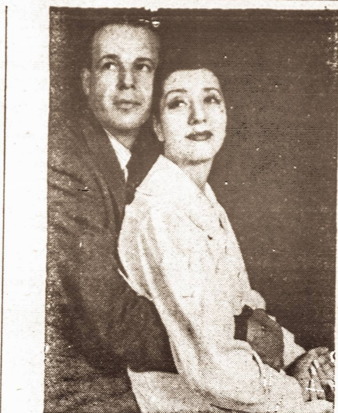
Alfred Lunt ir Lynn Fontanne, Čechovo veikalė "The Sea Gull" Shuberto teatr., 44th St., New Yorke.