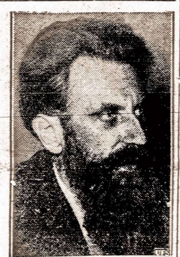
Kaltinamas. — Sovietų Šiaurės Ašgalio ekspedicijos vadas dr. Otto J. Schmidt, kuris dabar Sovietų kaltinamas už apsilėidimą ir nevykusį kai kurių tos ekspedicijos narių gelbėjimą. Kai kurie Sovietų vadai sako, kad laikas jį "išvalyti".