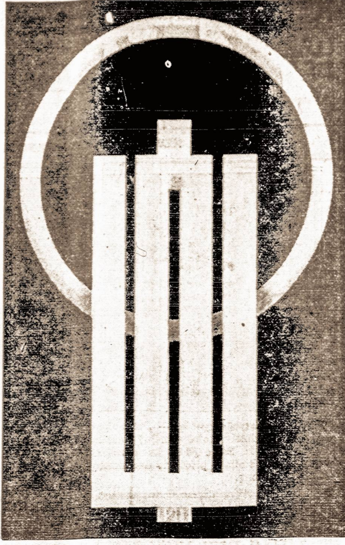
Tautinės Lietuvos Sporto Olimpijados ženklas. — Šio ženklo pagrindą sudaro stilizuoti Gedimino stulpai.

Sovietai žada suteikti pagalbą užpultai Čekoslovakijai