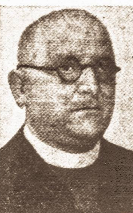
Kun. Vladas Mironas Lietuvos ministras pirmininkas.

KAUNAS, Balandžio 24 d. Ministras Pirmininkas Mironas Šiauliuose tautininkų suvažiavime pareiškė, kad pradėtos su lenkais derybos nereiškia mūsų žaizdų užglijimą, kad mes turime išsklaidyti vieny kitų iliūzijas, jog Lietuva su kiekviena padiktuota būtum paaimanavusi susigyvens. Vyriausybė ir tauta supranta šiandieninės padėties rimtumą, mūsų vieninga valia ginti savąsias teises kelia pareigą būti visokeriopa pasiruošusiems. Valstybės būtis reikalauja valstybiniam darbui suteikti kuo daugiausia kurybinių pajėgų žmonių ne nepastoviu partiniu susitarimu, bet tautinių valstybių idealų šviesoje.