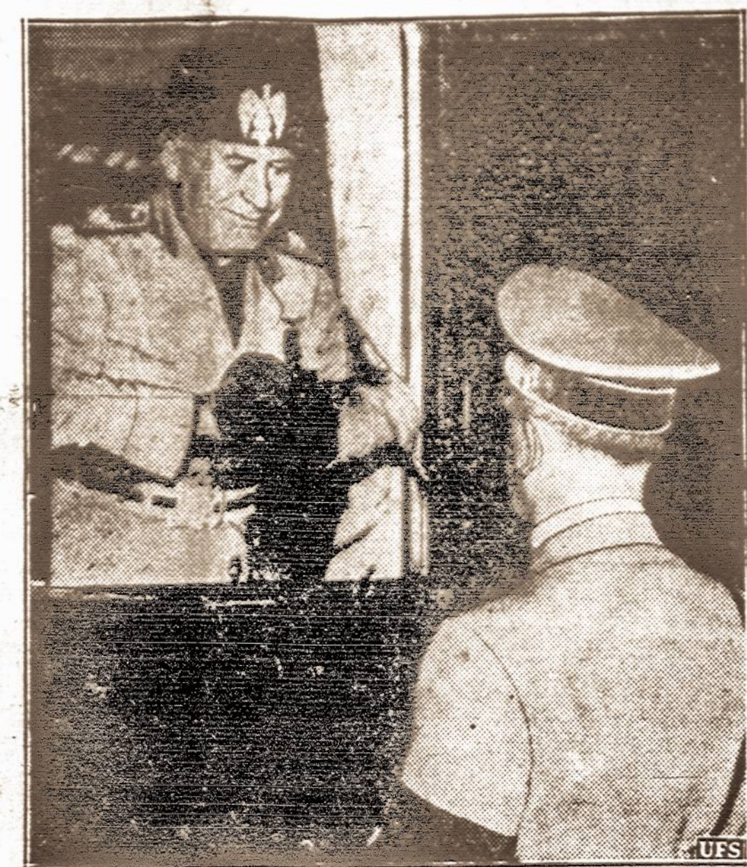
Hitleris vyksta pas Mussolini. — Neseniai Italijos diktatorius Musolini lankėsi Vokietijoje, dabar Vokietijos fuhreris lankysis Italijoje. Ryšium su Hitlerio atsilankymu Romoje ir kituose miestuose sumiti visi žydai ir įtariami asmenys. Hitleris lankysis Romoje nuo gegužės 3 d. iki 10 d.

Jangtse upėje, Kinijoje japonai sulaukė anglų prekybinių laivų Tungwo. Vėliau jį paleido.