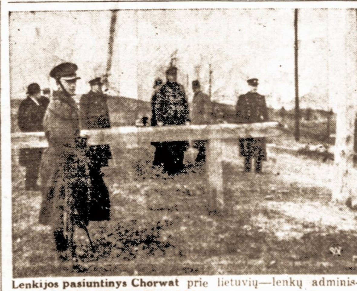
Lenkijos pasiuntinys Chorvat prie lietuvių—lenkų administracijos linijos, kai važiuo į Lietuvą.