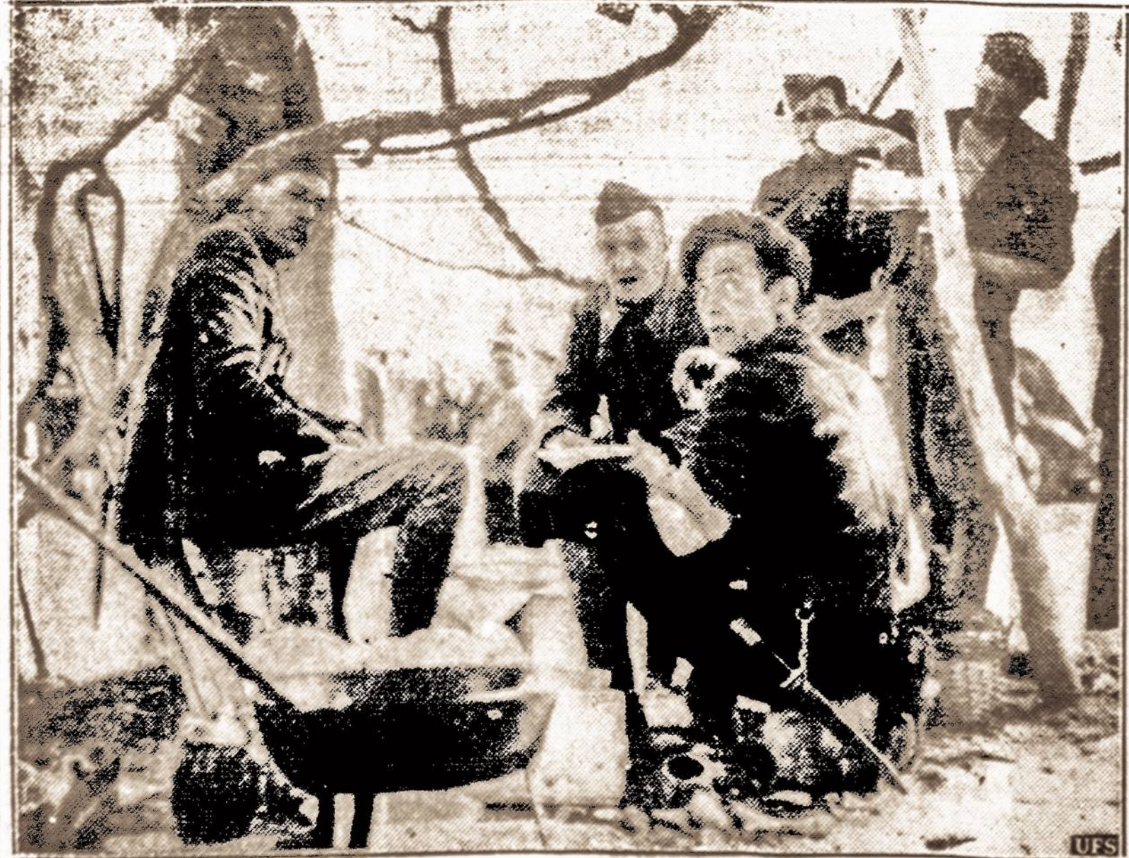
Poilsis po laimėtų kautynių. — Ispanų gen. Franco kareiviai gauna pasilsėti po sėkmingų kautynių ir po to vėl vyksta į karo laukus.

Tokiais be abejojimo motyvais vadavos Vytautas ir pasirašydamas 1413 metais Gardelio uniją. Lenkai reikalavo pakartojimo 1385 metų deklaracijos apie pilną Lietuvos įjungimą Lenkijon, Vytautas turėdamas omenyje savo reikalus Rytuose nesipriešino; jį pildyti, žinoma, nematė, bet dokumentas pasiliko, ir jį mokytojai ateityje sunaudoti lenkai, juom remdamiesi galų gale pasiekė savo tikslą. (Bus daugiau)