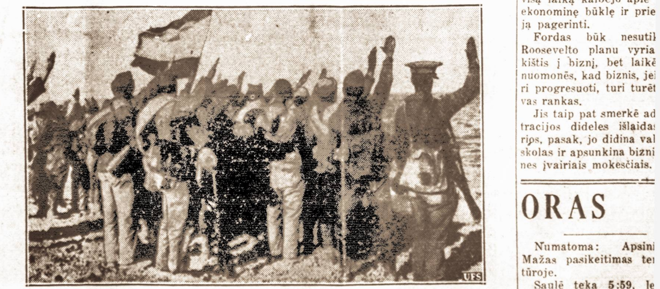
Sveikina jūrą. — Ispanijos frankistų kariuomenė, pasiekusi Viduržemio jūrą, sveikina ją išskeldami rankas.

Fordas būk nesutinkantis su Roosevelto planu vyriausybės, bet laikė nuomonės, kad biznis, jei ri progresuoti, turi turėti vas rankas. Jis taip pat smerkė administracijos dides išlaidas, pasak, jo didina valskolas ir apsunkena biznines įvairiais mokesčiais.