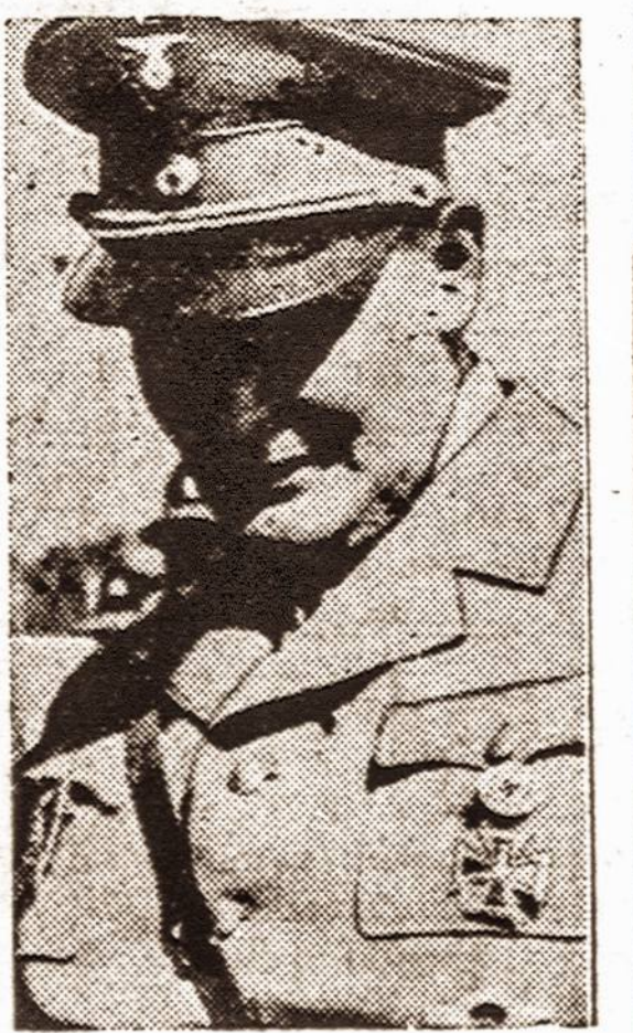
Generolas Hermann Goering

BERLIN, bal. 28 d. — Vokietijos keturių metų ekonominio plano vykdymo generalas Hermann Goering vakar įsakė nacių autoritetams suregistruoti visų Vokietijos žydų turtą, kuris manoma sieks iki $3,000,000,000 sumos. Taip pat įsakyta visiems svetimtaučiams gyvenantiems Vokietijoje iki birželio 30 d. suregistruoti visą savo turtą Vokietijoje. Registruotis privalo