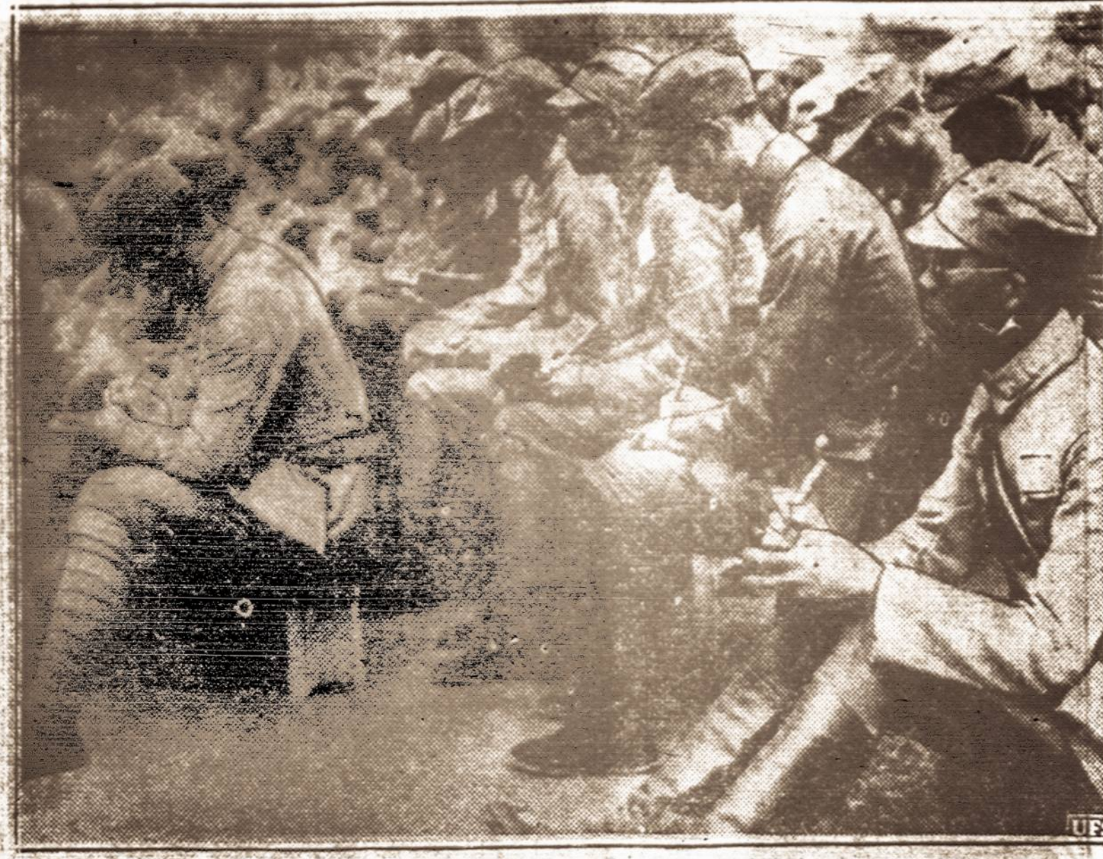
Pamokos kare. — Besirengdami ilgam karui prieš japonus, kinai įsteigė mokyklą karininkams paruošti. Į tą karo mokyklą siunčiami daugiausia studentai. Generolas Čiankašėkas dažnai pats laiko paskaitas ir rūpinasi ko daugiau karininkų parengti