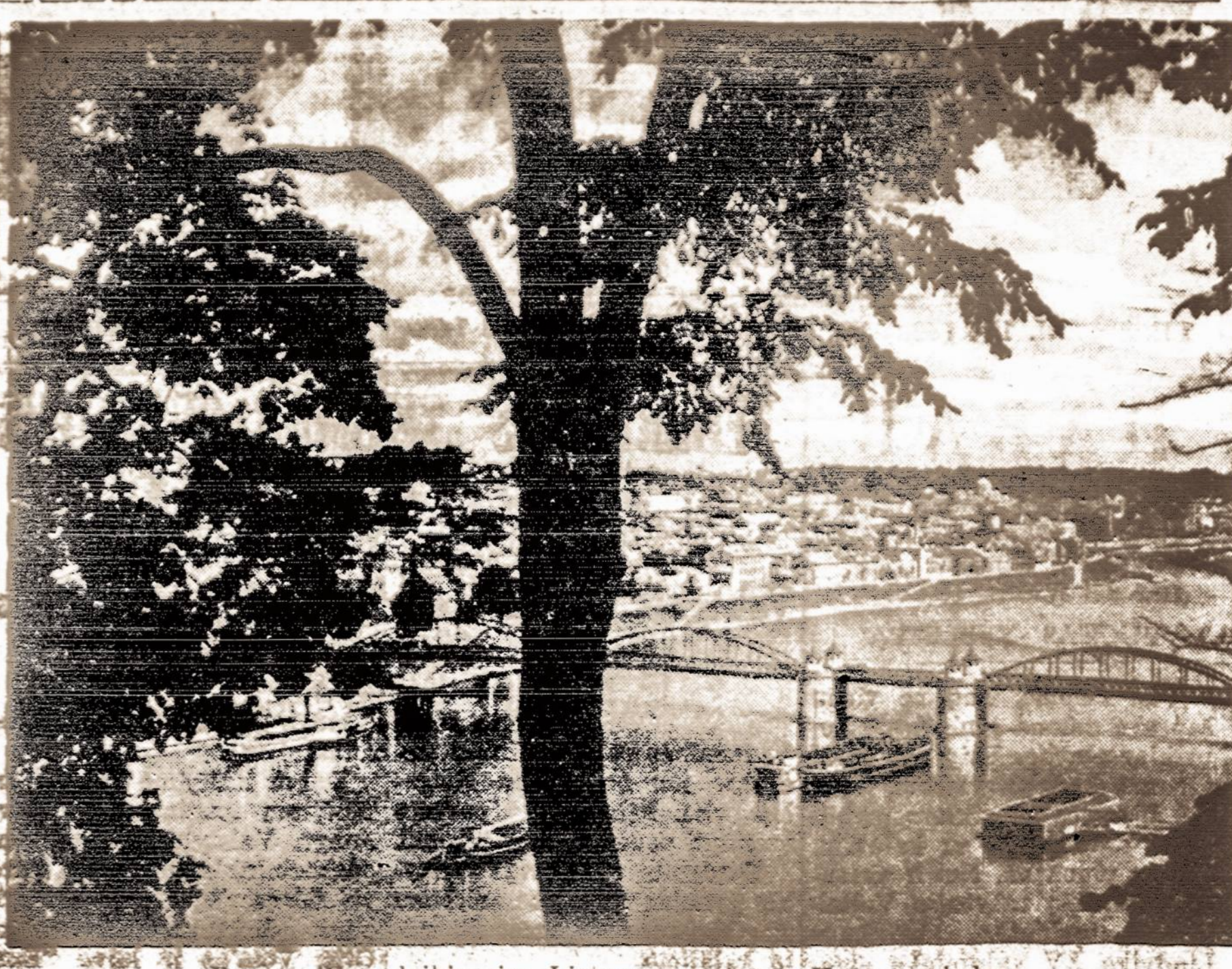
Pavasariškas laikinosios Lietuvos sostinės Kauno vaizdas.

Kaip dirba Hitleris, kuris naktimis ieško ikvėpimo Hitleris dirba — ikvėpimu. Jis pasitiki savo jausmu. Retai jis težiūri ir bylas ir dokumentus, nes visa tai, kaip ir jis pats sako, neteikia jam ikvėpimo. Vienas vokiečių diplomatas pasakoja labai būdingą anekdotą apie Hitlerio darbo būdus. Buvo taip, kad fuchreris būtinai turėjo perskaityti vieną labai svarbų dokumentą — pranešimą, bet visiems buvo žinoma, kad jis buvo nusistatęs niekadus neskaityti pranešimų. Pagaliau buvo nuspręsta, kad tą pranešimą patieks fuchrerui pats maršalas von Blombergas. Maršalas įteikė pranešimą fuchrerui ir rankas, prašydamas, kad būtinai tuojau jį perskaitytų, nes tai esąs ypatingai svarbus dalykas. Ėjo diena po dienos, dokumentas ramiai sau gulėjo neperskaitytas, fuchrerio rašomajame stale. Blombergas vėl nuėjo pas jį priminti, kad svarbus dokumentas turi būti perskaitytas ir Hitleris trumpai jam pastebėjo: — Nereikia skaityti, aš žinau, kas ten parašyta! Ir tą patį dieną, 1936 m. kovą 7 d., jis įsakė Vokietijos armijai įžengti į Reino sritį. — Bet kas buvo tame diplomate skaityme pranešime, kurį jis nesutiko perskaityti? Pranešime buvo formalus spėjimas nusiųsti armijos į Reino sritį paremtas Prancūzijos pasiryžimu mobilizuotis, jei tik bus su-