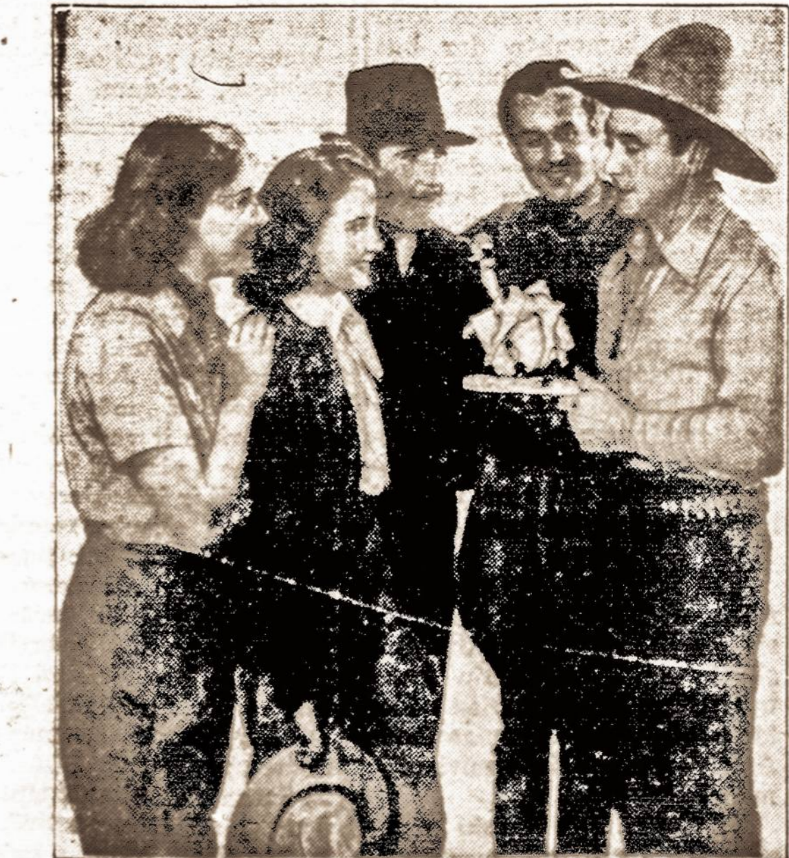
Dovana artistui. — Žymiausias "kaubojų" artistas George O'Brien'as priima dovana. Iš kairės: Rita Laroy, Laraine Johnson, John Miljan, William Stelling ir O'Brien.

Tais žodžiais buvo vadinami prancūzų ir anglų santykiai, sudaryti po draugingumo sutarties pasirašymo 1904 m. balandžio m. 8 d. Sutartis sutarė visa eile įvairių nesupratimų tarp Prancūzijos ir Anglijos, o tų nesupratimų buvo daug — reikia nepamiršti, kad per ištisus šimtmečius ejo kovos tarp anglų ir prancūzų. Ir šios sutarties likviduoti nesupratimai liete Egiptą, Newfoundlandą, Maroką, Siamą, Naujusius Hebridus ir Madagaskarą. Pirmą kartą tuos žodžius "Entente Cordiale" — "širdingas Susipratimas" — pavartojo 1859 metais anglas politikas Richardas Cobdenas ryšium su minėta sutartim ir taip pat — su prekybine tų dviejų kraštų sutartimi. Jeigu turite Lietuvoj giminių, kurie domisi Amerikos lietuvių gyvenimu, užprenumeruokite jiems Vienybės dienraštį.