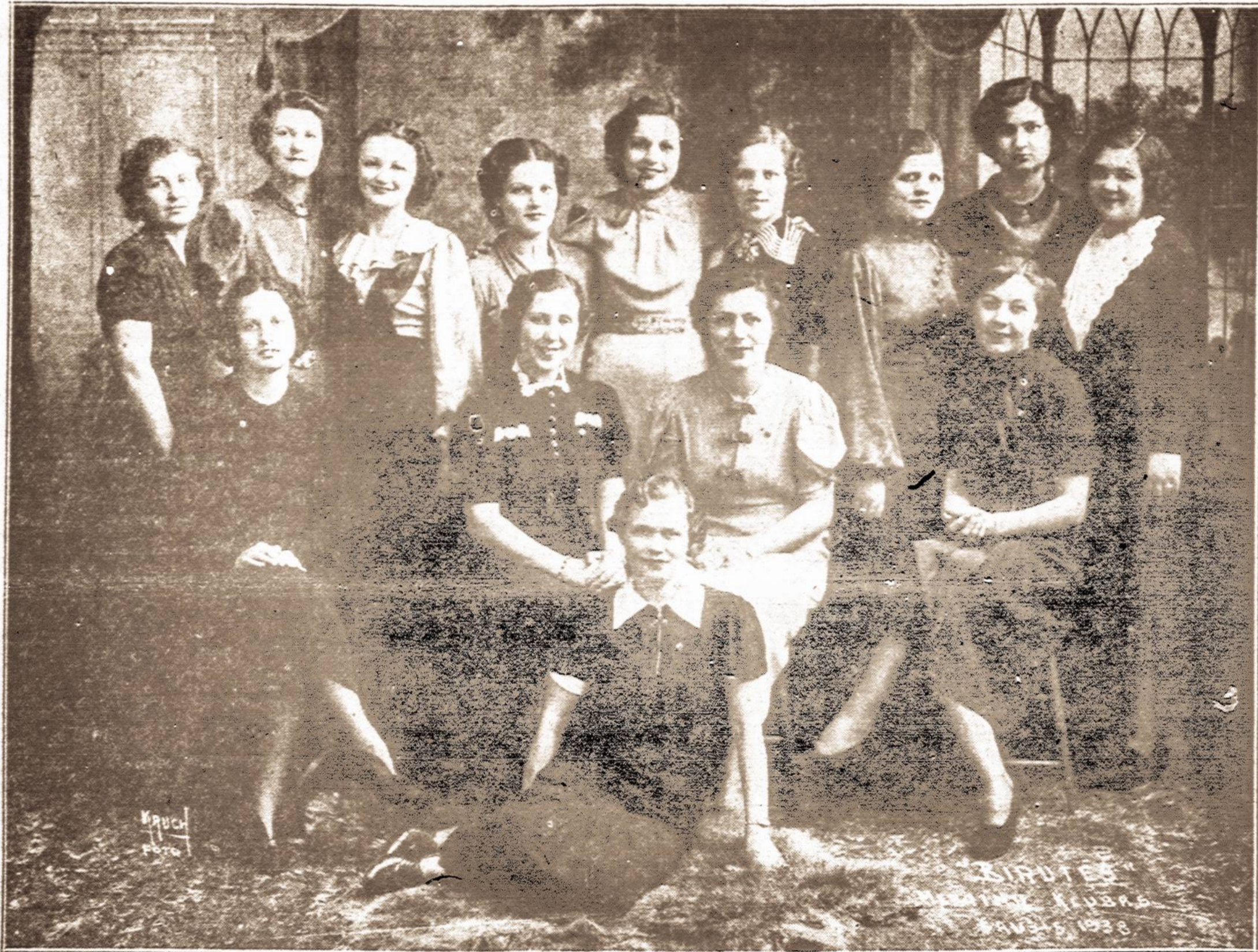
Ilgosios Salos (Long Island) Birutės Merginų Klubas. — Šis lietuvių klubas yra negausingas, bet labai darbštas, vieningo tautiško nusistatymo ir sutarimai veikia tautinėje ir kultūrinėje dirvoje. Šios birutės yra vertos garbingo savo vardo. Savo energingumu ir darniu veikimu jos pasidaro pelno ir jį tuoju skiria svarbiems tautiniams reikalams. Klubas jau yra skyres gražias au kas Lietuvos Ginklų Fondui, kunigaikštienės Birutės paminklui Palangoje ir šaulių Sąjungos lėktuvui. Birutės Merginų Klubai yra vertas visuomenės pagarbos. Tai pavyzdys visoms Amerikos lietuviuoms!

31-ąją metų pikniką rengia Lietuvių Amerikos Piliiečių Klubas. Nuoširdžiai kviečiame planuoti visuomenę ir organizacijas dalyvauti mūsų didžiuliam piknike, kuris įvyks šeštadienį, liepos 30 dieną Dexter Parke. Piknikas rengiamas su didele ir įvairia programa. Bus įžangos dovanos ir šokių kontestas. Sekite skelbimus. Narių prašome darbuotis, kad piknikas būtų sėkmingas. Komisija