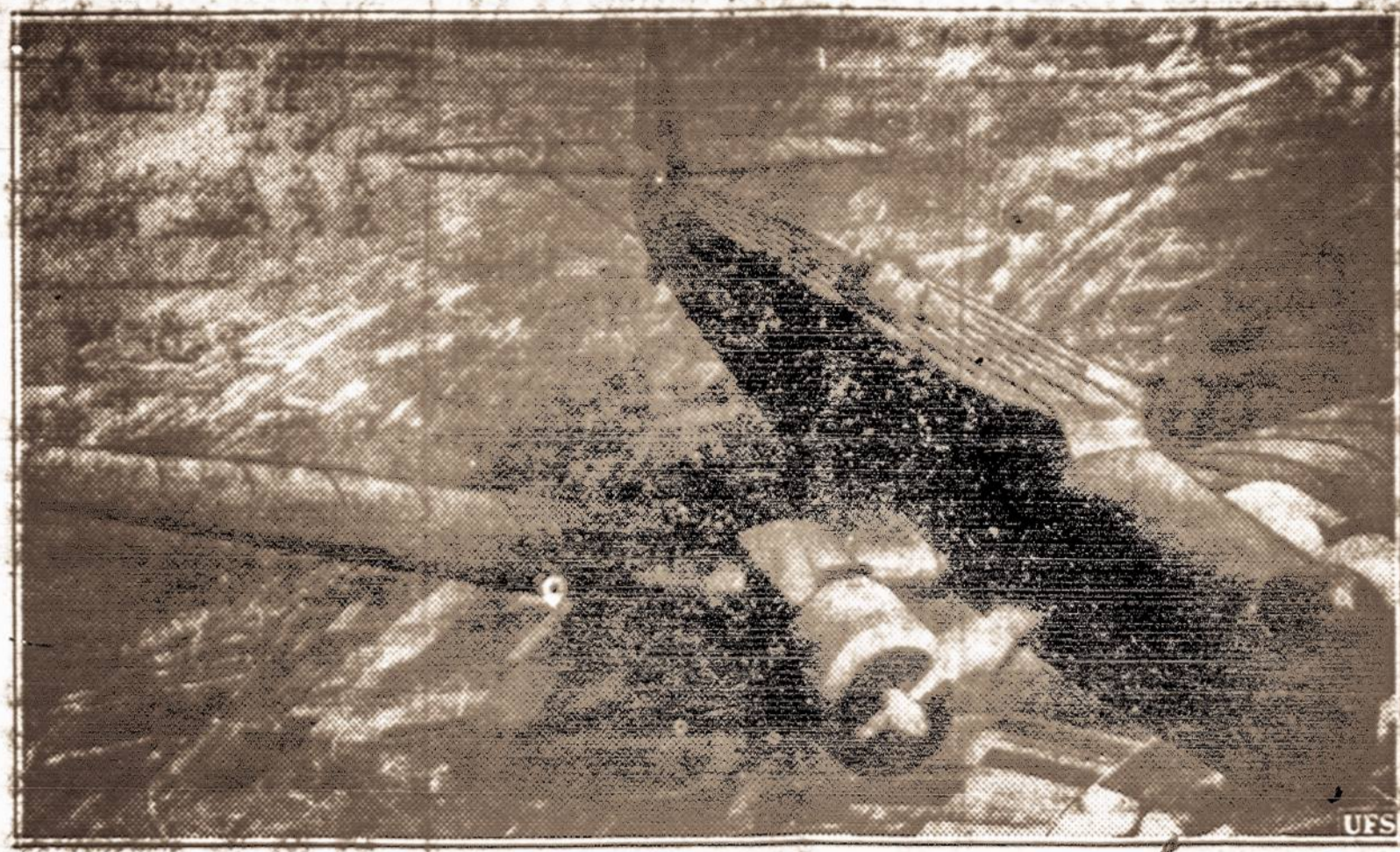
Prancūzai stiprinasi ore. — Prancūzai pradėjo milžinišką lėk. statybą. Vyriausybė užsakė paskubom pastatyti 2,600 naujų lėk. Čia vienas iš naujųjų lėk., bombevežių.

Patį Amerikos lietuvių akcija Amerikos politinių kalinių amnestijos reikalui, atrodo, mažu mažiausia — nesuipratinama. Juk Amerikos lietuvių su didžiausiu entuziazmu yra padėję iškovoti Lietuvos nepriklausomybę, gausiomis aukomis yra sustiprinę valstybę ekonomiškai, yra padėję apginkluoti savanorių pulkus ir tuo nulėmę laisvės kovų rezultatus. Tad šiandien, matant Amerikos lietuvių įtrauktus į valstybę kenkiančią akciją, darosi visai neaišku, kodėl nesuprantama, kad tokia akcija yra naudinga Lietuvos valstybės priešams ir pragaiš-