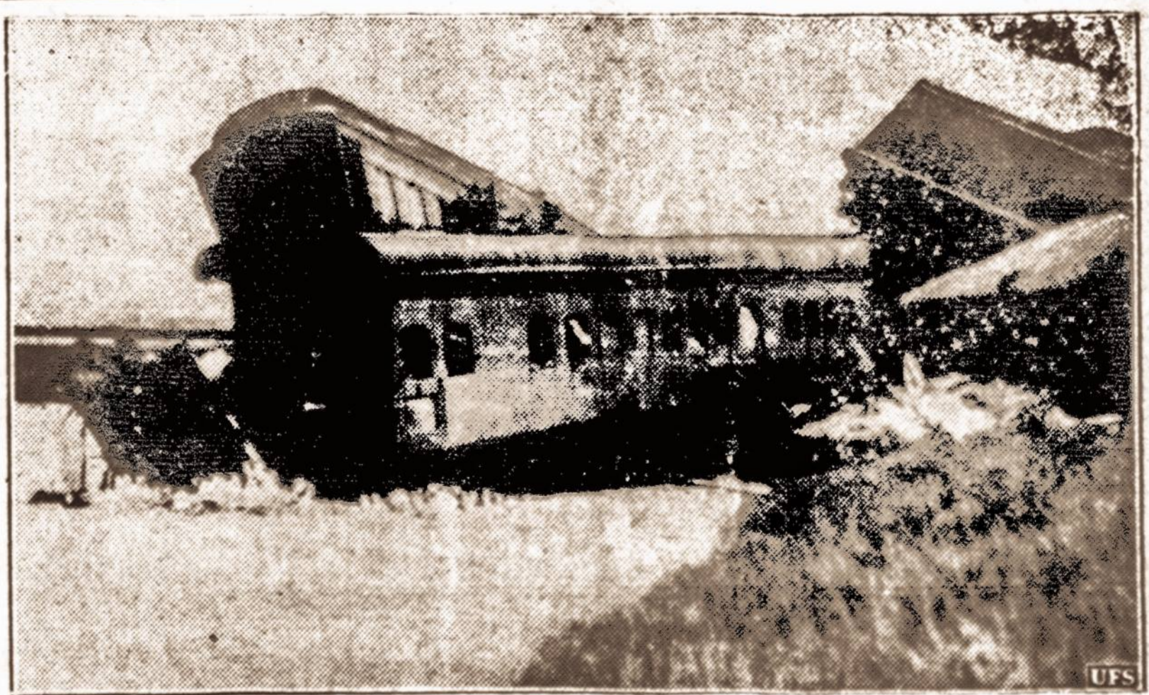
Traukinys nuriedėjo nuo tilto. — Iš Cikagos į Takomą ejęs keleivinis traukinys nuriedėjo nuo tilto, kurio pamatus paplovė potvynis. Toji nelaimė įvyko netoli Miles City, Montanos valstybėje. Zuvo daugiau kaip 30 žmonių ir apie 65 asmenys sužeisti.

Užbaigus numatytus darbus vykdyti, galutiniai bus atkariautas iš vandens 1,500 ha žemės plotas, kuris galės būti pavestas naudingais laukais.