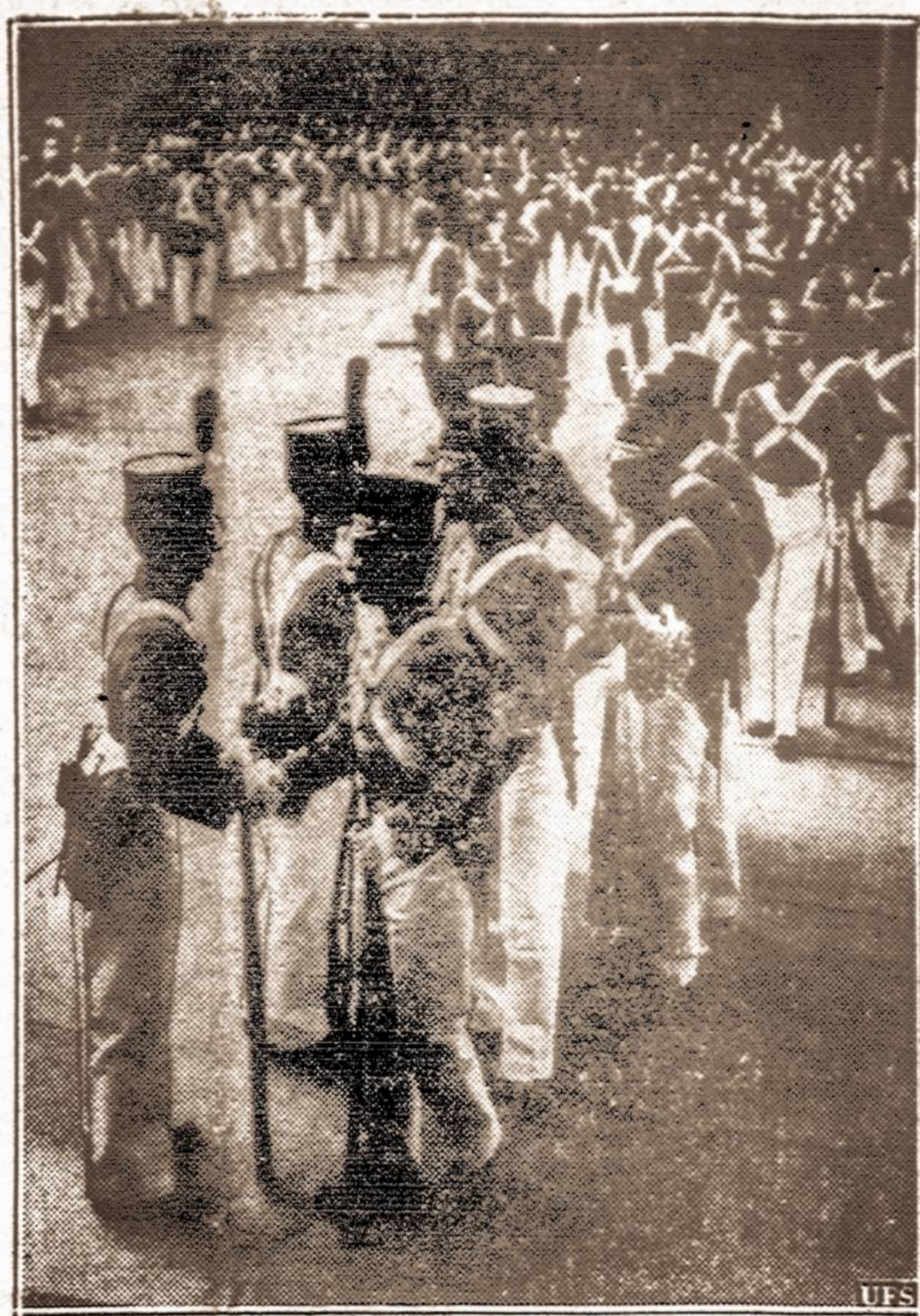
Būsimieji karininkai. — Jungtinių Valstybių karo mokykloje, West Point, N. Y., naujokai sveikinasi su senesniais kariūnais (kadetais). Ši mokykla kasmet išauklėja kelis šimtus karininkų. Amerika taip pat nenori atsilikti nuo Europos ir yra pasirūzys kariškai pasirengti įvairiems galimūmams.

KAUNAS. — Lietuvos Komercijos Banko akcininkų visuotinis susirinkimas nutarė paskirti iš 1937 metų pelno 5,000 lt. — Ginklų Fondui ir, be to, 10,000 lt. — kaip tolesnį įmokėjimą. Banko tarnautojams šelpti fondai.