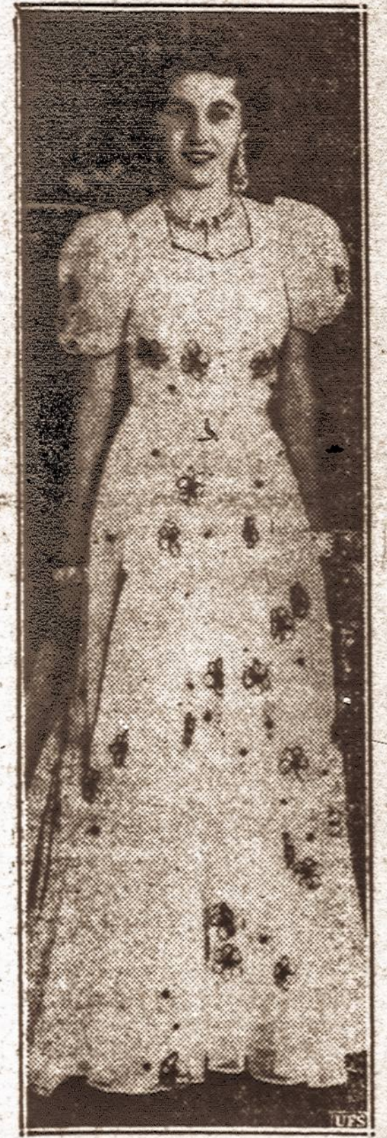
Gražuolė. — Egipto karaliaus Farouko sesuo karalaitė Fauzija, 17 metų amžiaus, susižiedavo su Irano sosto įpėdiniu Šapuru Mahometu Riza Polaju. Susižiedavimo pokyliai išleista 30,000 dolerių.

— Šiemet, Lietuvos Nepriklausomybės 20 metų sukaktuvių proga, Kaune bus suruošta plati parodos ir periodinės spaudos paroda, apžvalginė meno paroda ir bažnytinio meno paroda. Šios parodos pavaizduos knygos, laikraščių ir meno augimą Nepriklausomoje Lietuvoje.