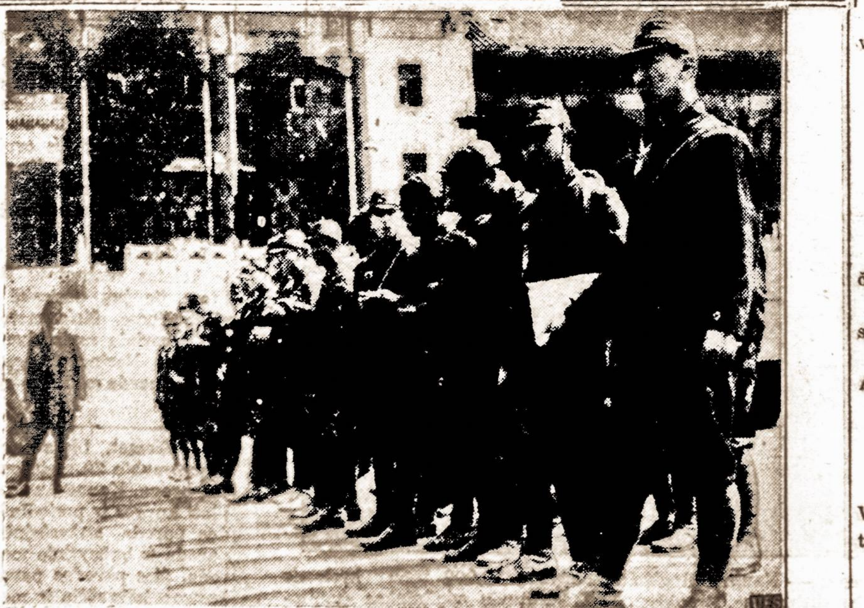
"Geros laimės Vokietijai". — Japonijos jauni delegacijos vyrai deleguoti j Vokietiją jauniems naciams palinkėti geriausią pasekmę. Paveiksle juos matome Kiangvano mieste prieš šanchajaus aplankymą. Iš ten jie vyks tiesiog j Vokietiją.