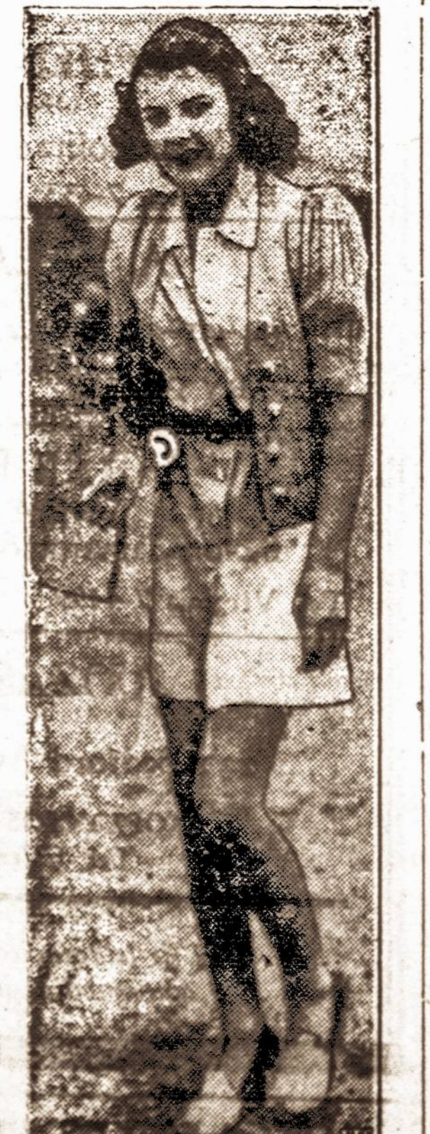
Pagalinau laikas po vėsaus oro keliauti į paplūdimius (byčius).