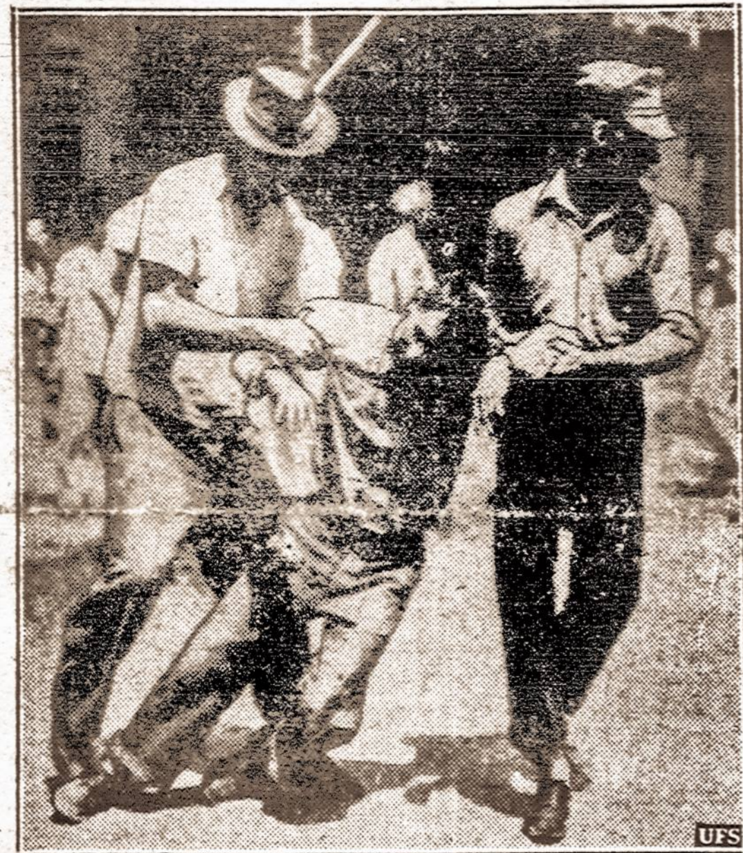
Muštinės tarp unijistų. — New Orleans tarp unijistų AFL ir CIO agentų kilo muštinės. Vartota net šaunamieji ginklai. Vienas sužeistas nuvedamas.

Saulė teka 5:26, leidžiasi 8:31. Dienos ilgis 15 val. 7 min.