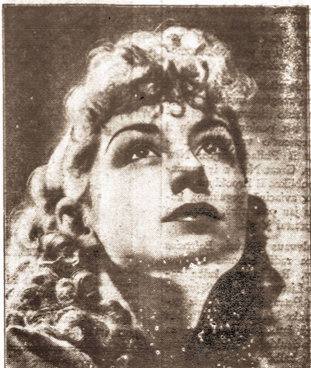
Filmų artistė raudonplaukė Anne Shirley.

Į viso pamėginkime pirmą išmokti tikrai patys save suvaldyti, o tuomet esu tikra, kad nė vienas iš mūsų nenorėsime kitus valdyti ir suprasime greičiau, kas kam skirtas yra.