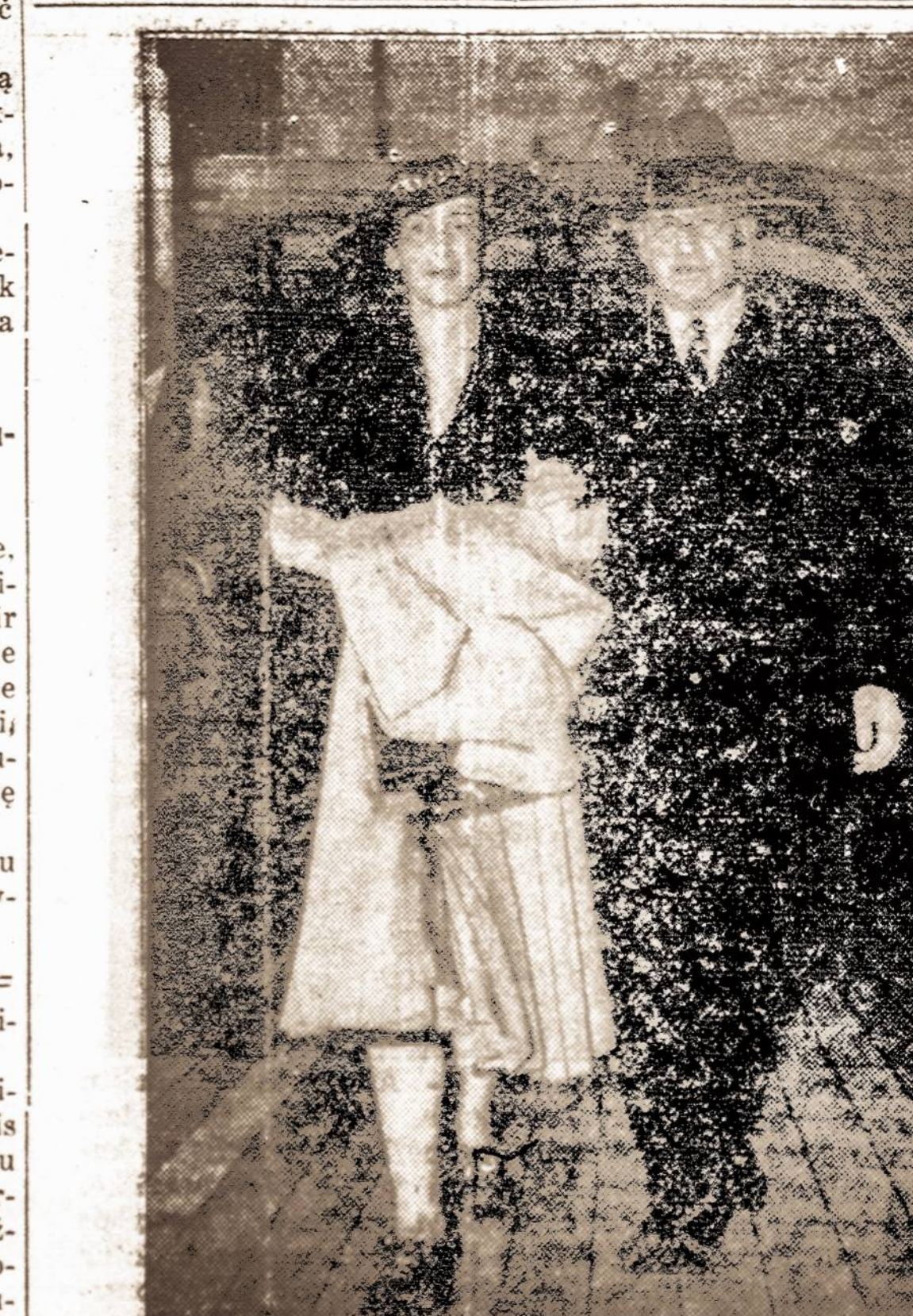
Grįžta iš medaus mėnesio. — Jungtinių Valstybių visdaus reikalų sekretorius Haroldas L. Ickas su savo 25 metų amžiaus žmona grįžta po vedybų Airijoje.

Kodėl gi ne? Ne tiktai galėtų, bet ir turėtų. O kai dėl