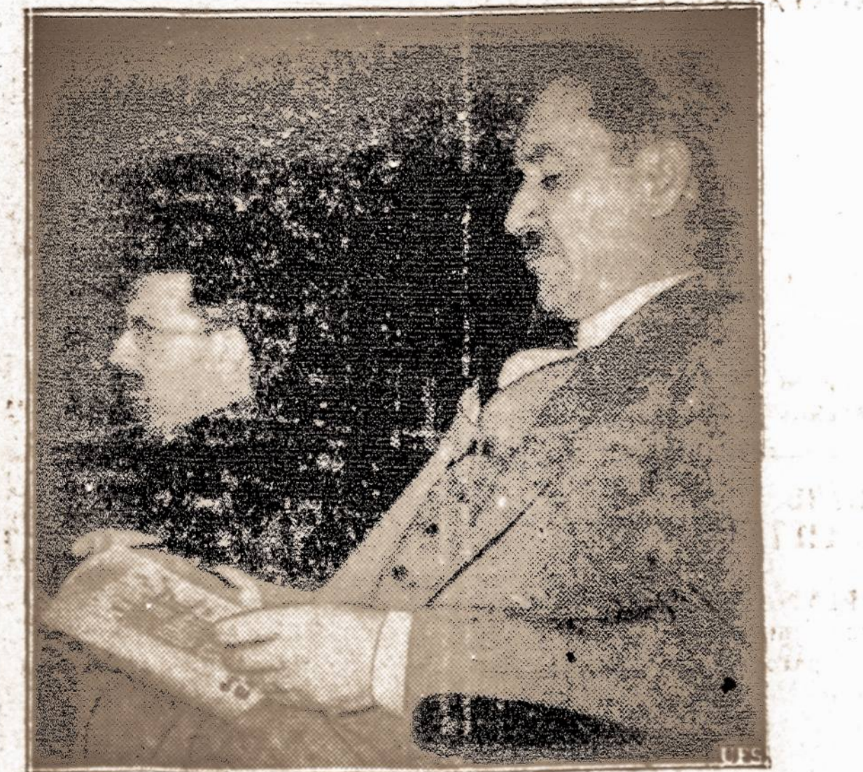
Amerikos komunistų vadas. — Amerikos komunistų partijos vadas Earl's Browder'is, dešinėje, buvo taromas New Yorko seimelio tyrinėjimo komisijoje, kuriai patiekė žinių apie komunistų veiklą. Jis pareiškė, kad komunistai veikia mokyklose, civilinėse tarnybose, ligoninėse, pašalpos tiekimo įstaigose ir kitur Jungtinėse Valstybėse. Valdžia nori pastoti kelią komunistui ir nacizmui Amerikoje, kuri nenori jų propagandos ir kenksmingos veiklos, dėl kurios gyventojai kurtomi vieni prieš kitus.

— Su Belgija Lietuva padarė naują prekybinį susitarimą. Lietuva pirks Belgijoje prekių šiemet maždaug už 8 milijonų litų, o Belgija Lietuvoje už 10 milijonų litų.