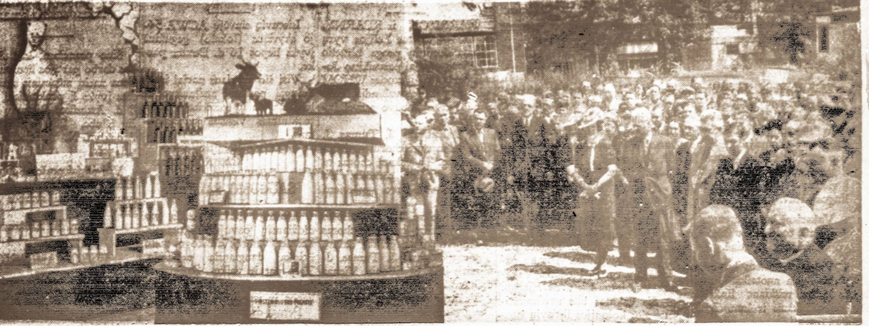
Lietuvoje birželio 8 d. buvo surengta Pieno savaitė, kurios proga buvo atidaryta pieno paroda, kuri vaizduoja pieno, arba Lietuvos "baltojo aukso", gamybą Lietuvoje. Paroda atidarė min. pirm. kun. Vl. Mironas, dalyvaujant vyriausybės nariams ir skaitlingai visuomenei. Pieno savaitės proga buvo raginama daugiau vartoti pieno gaminių, kurie yra daug naudingesni sveikatai, negu mėsa.