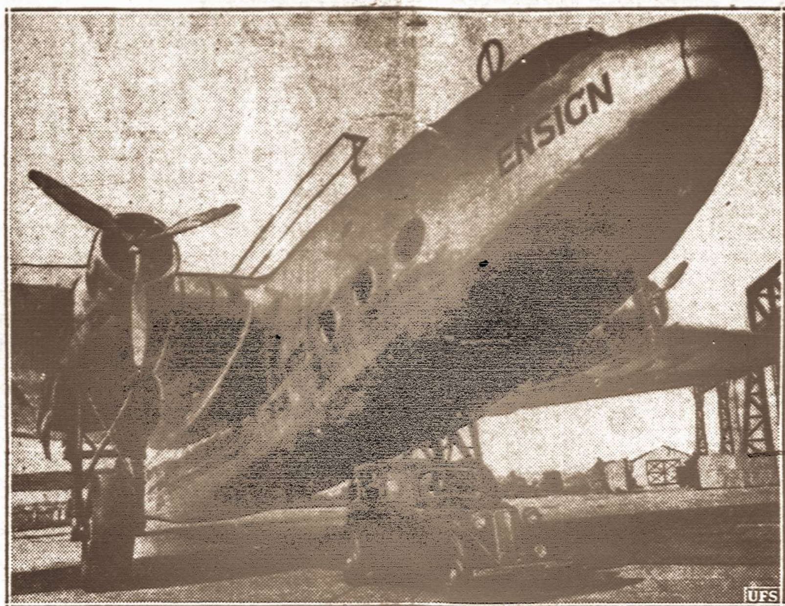
Orinis milžinas. — Anglai pastatė šio naujausio tipo milžiną, keleivijų susisiekimo lėktuvą, kuris skraidys po uropos žemyną. Šis lėktuvas galės vežti 40 keleivijų ir galės skristi greičiau 200 mylių per valandą. Galime palyginti lėktuvą automobilio didumu

Už aukščiau minėtą sumą prekių parduota tik pagal sutartį su prekybinėmis bendrovėmis. Be to, nemaža prekių ir ypač ginklų parduota neoficialiai, be vyriausybės žinios.