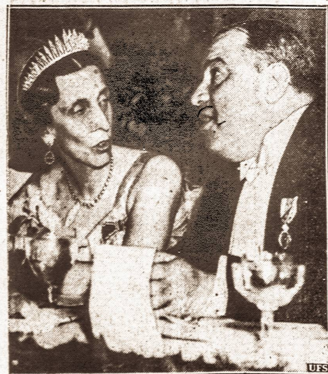
Princesė ir La Guardia. — Svedijos princesė Luiza kalbasi su New Yorko miesto majoru La Guardia per pokylį Waldorf-Astoria viešbuty, kur dalyvavo daugiau kaip 1000 žymių svečių. Majoras turi svedų ordiną.