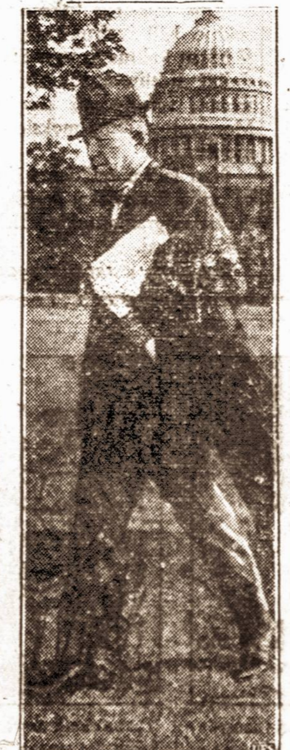
Pailsės. — Senatorius William E. Borah iš Idaho valstybės. Sulaukęs 73 metų šis Jungtinių Valstybių senatorius buvo priverstas atsigtulti į lovą, nes, Washingtono gydytojų nuomone, jo nervai esą paire ir jis turi kurti laiką pailsėti. Šis, pavyks trauktas senatoriui Borah apleidžiant Kapitolių.

Nekaltink žmogaus, jog jis nieko protingo nepasakė, kuomet jo burna užimta. Neišmėtinėk vėžiui, kad jis atbulas traukiasi. Geriau pasuk jį taip, kad jis traukdamos atbulas eitu pirmyn. Nereikalauk iš lapės, kad ji atsargiai apsiėtu su pūkais tos vištos, kurią ji smaigia.