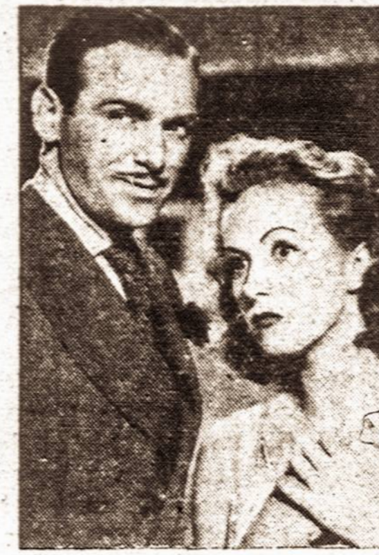
Douglas Fairbanks'as, Jr. ir Danielė Darrieuz filmė "The Rage of Paris", kuris rodomas teatre ROXY, 7th Ave. ir 50 Str., New York City.