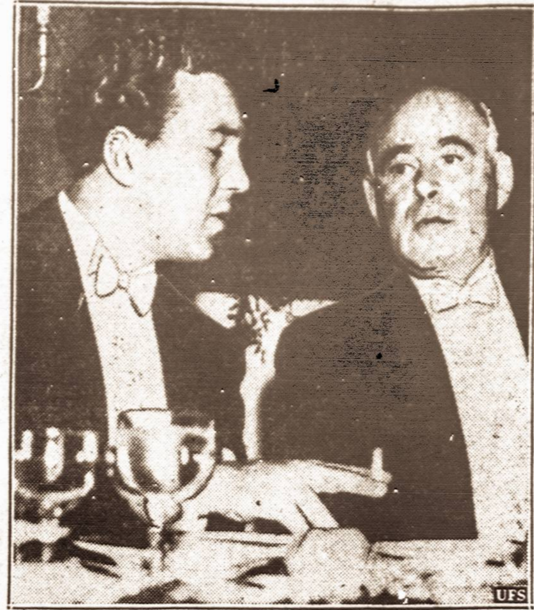
Princas ir gubernatorius. — Svedų princas Bertilis kalbasi su New Yorko gubernatorium Lehman'u per pokylį New Yorke.