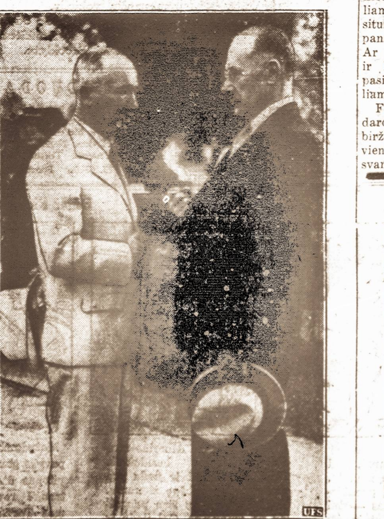
Cekoslovakijos vadai. — Cekoslovakijos prezidentas E. Benesas, kairėje, ministras pirmininkas M. Hodža. Jie tariasi su tautinių mažumų vadais dėl autonominės. Daugelis mano, kad vokiečių užpultai Cekoslovakijai į talką ateityje Anglijai.