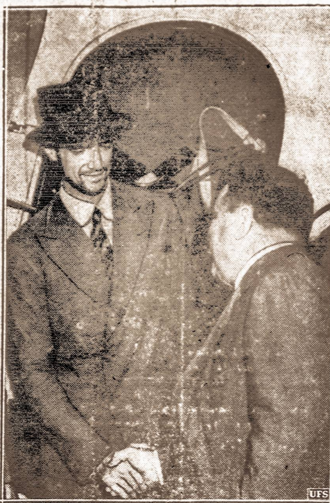
Miesto majoras sveikina oro didvyrį. — New Yorko miesto majoras La Guardia, dešinėje, sveikina lakūną Howardą Hughes'ą, kuris per nepilnas keturias dienas apskrido aplink pasaulį su savoketuriais bendraketioniais.