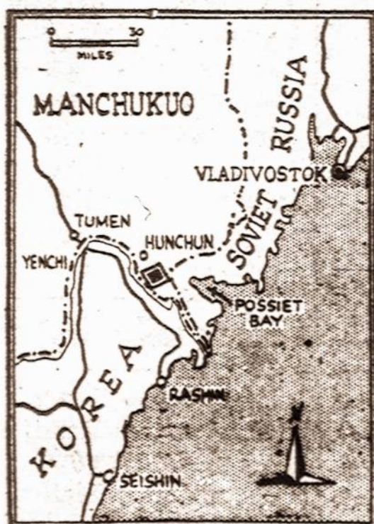
Gincas dėl žemės dalies. — Tarp Japonijos ir Rusijos eina gincas dėl Mančuko teritorijos dalies, pažymėtos keturkampiu, į pietų vakarus nuo Vladivostoko. Rusų kariuomenė laiko užėmus strategiską Čenkufeno kalną. Dabar japonai siūlo gincą išspręsti komisija iš Japonijos, Mančuko ir Rusijos atstovų.

Tai labai gerai suprato Maskva. Nenuostabu, jeigu Kremlius veikė energingai ir griežtai. Dėl to sovietų diplomacija laimėjo.