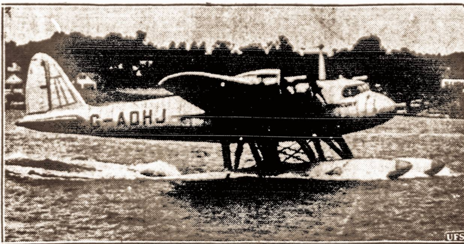
Atskrido nuo kito lėktuvo nugaros. — Anglų lėktuvas Merkurijus nuo kito didesnio laivo nugaros pasileido iš Foynes, Airijoje, ir į Port Washington, L. I., N. Y. atskrido per 25 valandas ir 9 minutes. Anglai tokį lėktuvą ir pakilimo būdą užpatentavo. Bet amerikoniai numato kitokį būdą, besirengdami nuolatiniam lėktuvų susisiekimui tarp Amerikos ir Europos per Atlanto vandenyną.

Jeigu norite atsiimti savo gimines iš Lietuvos, užeikite į Vienybės Travel Bureau, 193 Grand St., Brooklyn, N. Y.