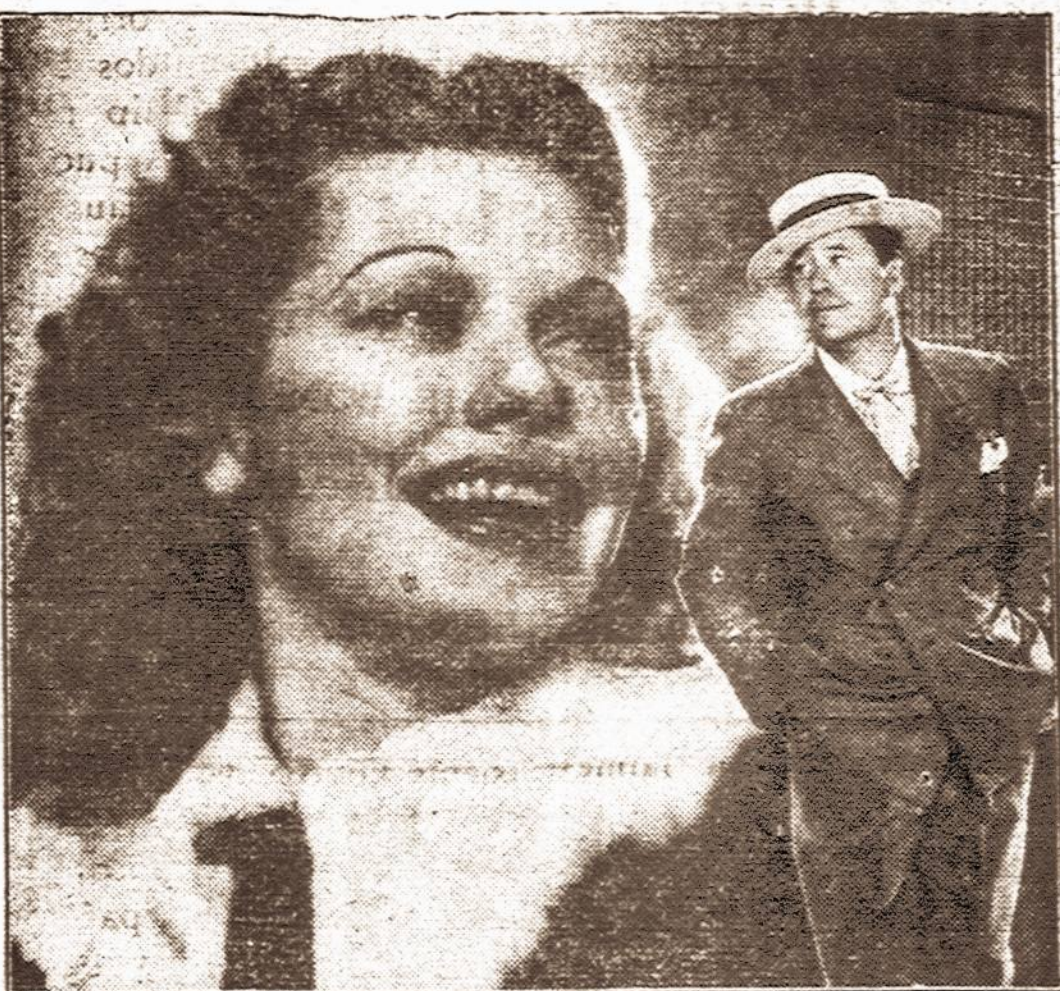
The svelte figure at the right is Jack Oakie, who has shed forty pounds of excess contour in the last six months. The girl is vivacious Lucille Ball, who plays opposite him in "The Affairs of Annabel." This RKO Radio comedy presents Jack as a blundering press agent, and Miss Ball as a screen star who is kept in hot water by him.

The spontaneous enthusiasm with which the audience responded to last season's performance of "Perikola," and the subsequent unprecedented volume of requests for a repeat performance, prompted Birute's Chorus to decide upon a second presentation of the opera during a rehearsal held on Friday, July 22.