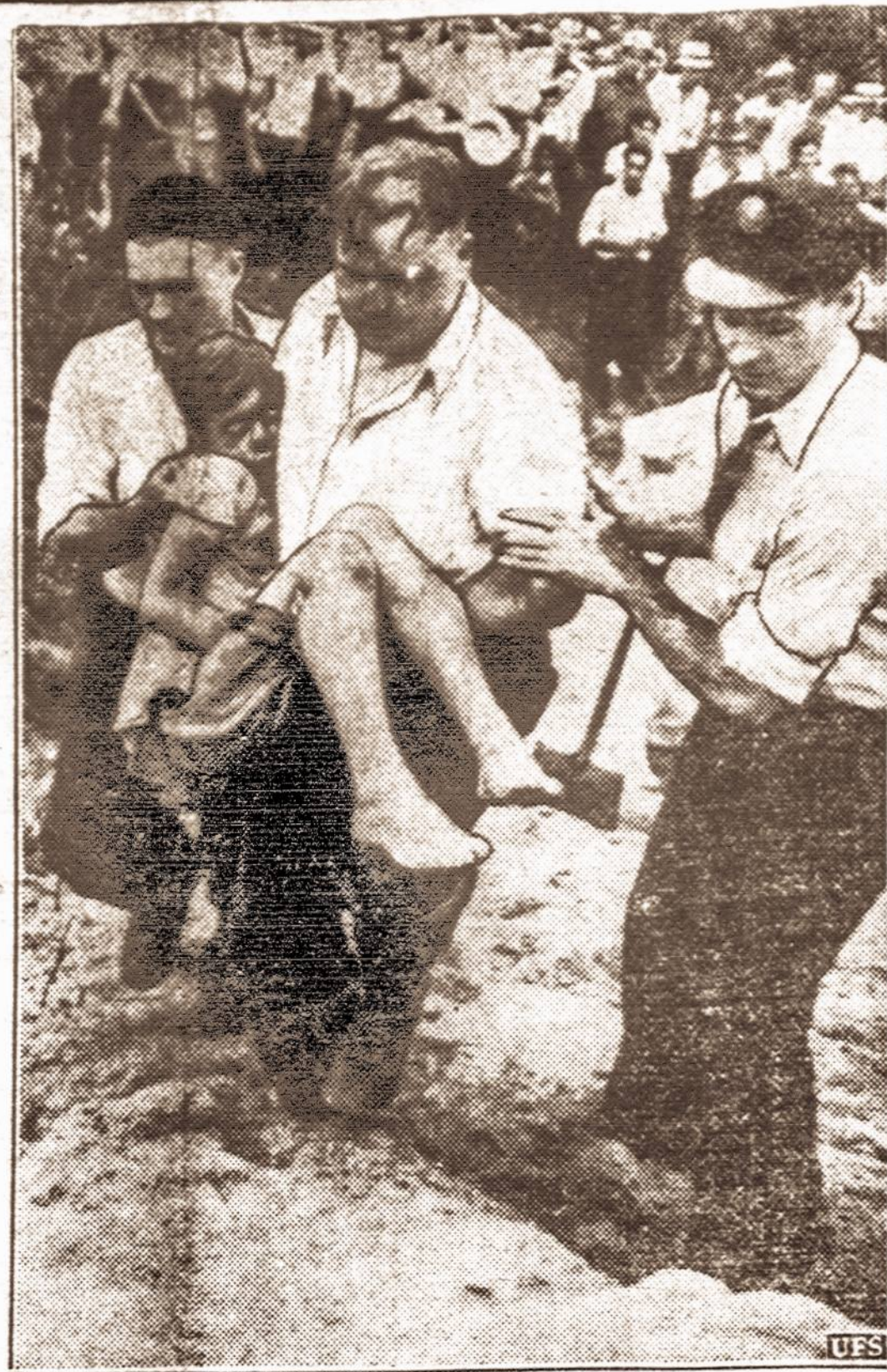
Auka urvui apgriuvus. — Trys berniukai ir mergaitė žuvo, jiems besikasant urvė ir žemė užgriuvus Kingsbury netoli Cleveland, Ohio. Tik vienas vaikas išliko gyvas, bet sunkiai sužalotas. Visi yra lenkų vaikai.

Nenuostabu, kad Pietų Amerikos lietuvių laikraščiai auga ne tik formatu, bet ir savo cirkuliacija. Tų kraštų lietuvių — jauniosios kartos žmonės, neseniai atvykę iš Lietuvos. Beveik visi — nepriklausomybės karo dalyviai, lanke mokyklą. Jie be laikraščių negali gyventi.