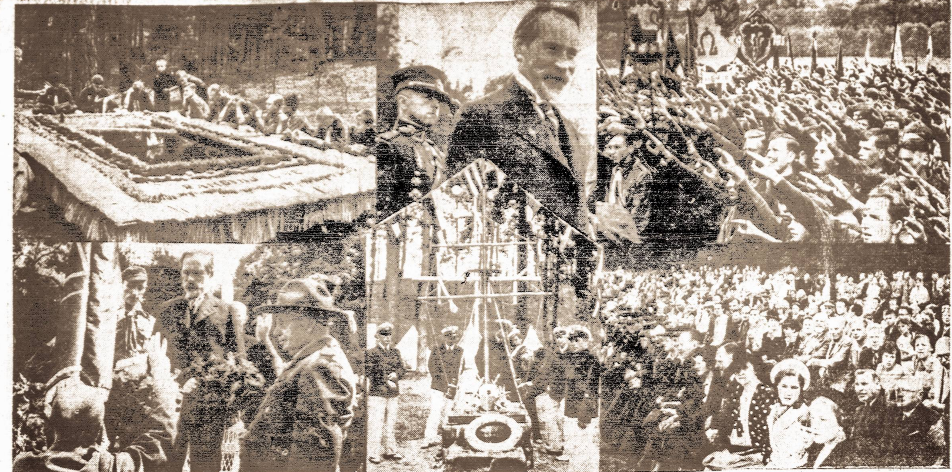
Liepos 10 d. Kaune, Aukštojoje Panemunėje, Jono Basanavičiaus šilė, prie pat Nemuno labai gražioje vietoje buvo atidaryta jubiliejinė II-oji tautinė lietuvių skautų stovykla, kurioje dalyvauja apie 1,500 lietuvių skautų. Į atidarymo iškilmes atsilankė pats skautų Šefas Respublikos Prezidentas Antanas Smetona, ministrų tarybos nariai ir daug kitų aukštųjų svečių. Šiame atvaizde matome keletą charakteringusių II-sios skautų stovyklos atidarymo vaizdų: viršuje — dešinėje — kairėje — gražiai įrengtas stovyklos stalas, skautų Šefas Respublikos Prezidentas Antanas Smetona stebi skautų eitynę, skautai didžiuoju salutu sveikina savo Šefą; apačioje — kairėje — skautų Šefo A. Smetonos sutikimas, jūrų skautai, skautų stovyklos atidarymo iškilmių svečiai.

Tokiu būdu cukraus fabrikai "šildo" tiksliai savo apylinkių ūkininkus. Todėl ir sunku