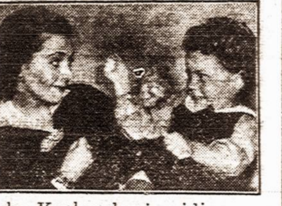
Ruby Keeler, kuri vaidina svarbiausią rolę "Mother Carey's Chickens" filmoje.

tūrą. Mergaitė turi būti paruošta ir šeimos gyvenimui bei motiniškoms pareigoms, bet šeimos reikalai stengiasi moteris išstumti iš visuomeninio gyvenimo, uždaryti jas šeimoje, užkirsti kelią dalyvauti žmonių kultūros kūryboje. Todėl šiandien mes visomis išgalėmis turime stengtis, kad tokio likimo ir mūsų dukros nesulauktų. Motinos, kurioms rūpi dukrelių ateitis, tautos bei žmonių gerovei, turi jau nuo mažens skiepyti savo dukreles darbo ir mokslo meile, savarankiškumą, pareigos jausmo pajautimą. Auklėti taip, kad mergaitės nesijautų mažiau sugebančios už berniukus, kad daugiau rodytų iniciatyvos, kūrybinės galios, valingumo ir kad mokslo siektų ne dėl to, kad geresni vyrai gautų, bet dėl to, kad būtų naudingos visuomenei, tautai bei žmonijai. Mergaitės savo pasiryžimu, nenuilstamu darbu, valingumu turi įrodyti, kad jos gali lygiai su vyrais kurti žmonių kul-