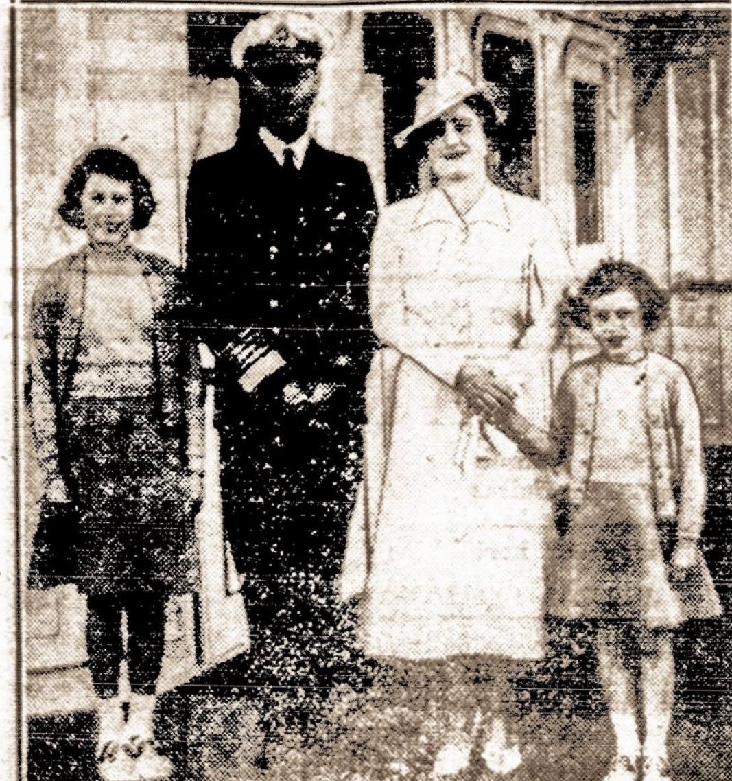
Karališkoji anglų šeima. Karalius ir karalienė neseniai oficialiai lankėsi Prancūzijoje.

Dar neseni laikai, kuomet ūkininkaičiai į atlaidus jodavo raiti, prie šono pasikabinę sil- nos maišes šieno. Rudomis ser- mėgėlėmis, juodais kraštais ap- važiūtomis pasipuošę, ilgais, blizgančiais batais apsimovę, už kepurės gelių puokštes užsika- binę jauni berniukai dulkėdavo visais keliais į bažnytkaimį. Tai buvo tie gražieji laikai, kuomet susidėstė dainelės apie bernelius raitužėlius, apie toli- mas keliones, vario pentinė- lius, tymo balnužėlius. Kaip ten į bažnyčią, ber piršliais tu- rėdavo būtinai joti raiti, kad pasirodytų savo žirga, būsimajai žmonei ir jos tėvams. Dar ir dabar, senose aukštaičių klė- tyse, ant gembių kabo supelėję, nebeuodujami balnai, kurie galėtų papasakoti daug linksmų ir margų atsitikimų iš anųjų raitužėlių gadytės. Net kepturė nebesilaiko ant galvos ūkinin- kaičių, kai jis rašytoje linei- koje išsuka iš klojimo į kelį ir suragina savo riestakaklį žir- gą. Pats važiavimas — vienas įdomiausių šventadienio atilaidų straipsnių. Gerai įtepti raitai, graziai išsukuotos arklys, išmar- gizati botkotės, papuoštos van- džios, geltonos šikšnos šlajos, blizgantys lankas, paties šei- ninko švariai išvalyti drabužiai, mandriai uždėta skrybėlė — štai kas įdomiausia ūkininkai- čių. Kad visi pravažiuojujantys imty klausiti vienas kitą: koks