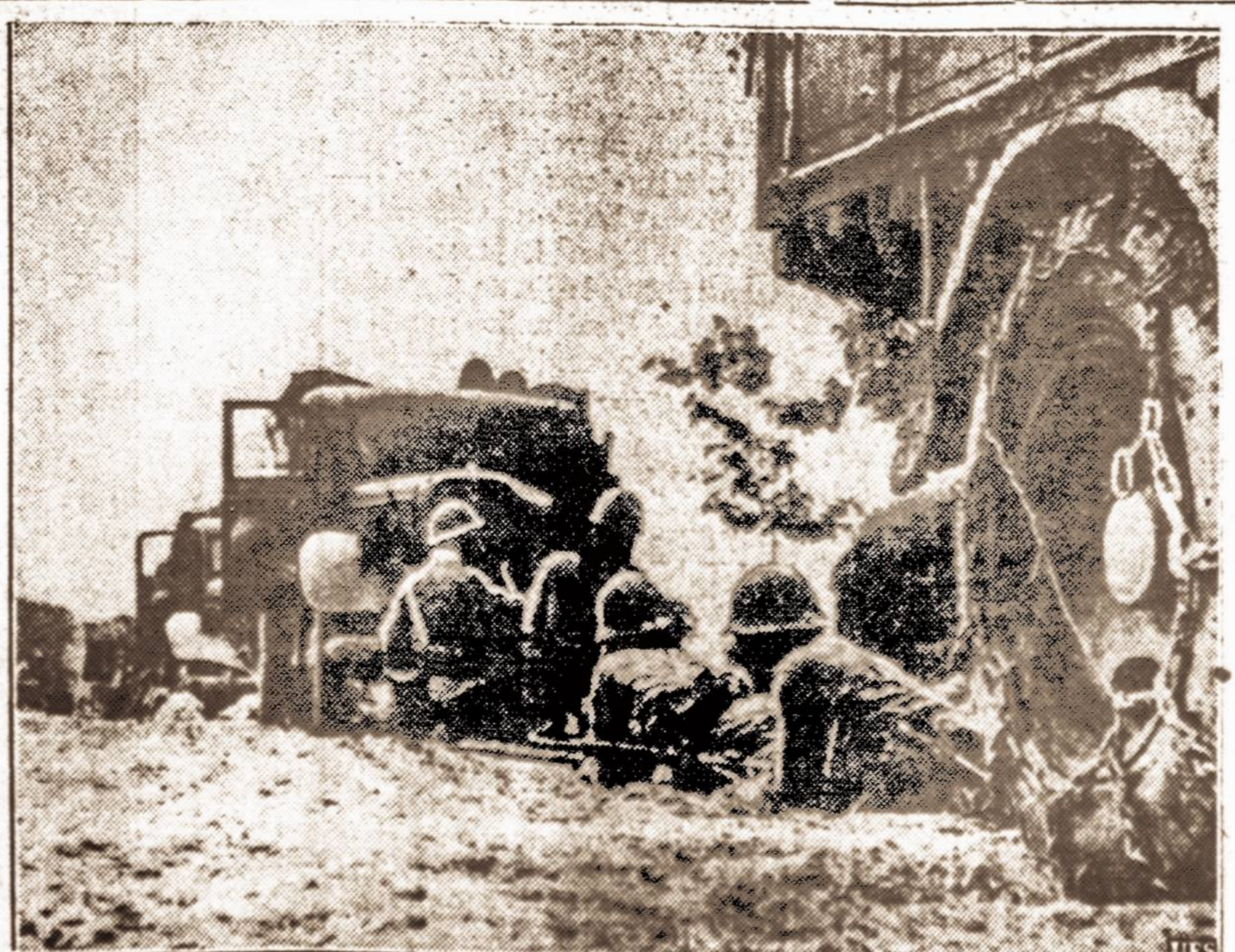
Sunki kova su kinų partizanais. Kinų partizanai dažnai puola žygiuojančią japonų kariuomenę, trukdo jos žygius ir sulauko transportus. Čia matome, kaip japonai yra p-sirengę ginti prikrautus sunkvežimius nuo kinų partizanų puolimo.

60 metų sukaktis. Filipinų salų prezidentas Manuelis Quezon'as vakar sukako 60 metų amžiaus. Šios sukakties proga filipiniečiai rengia vėjų kovai su džiova.