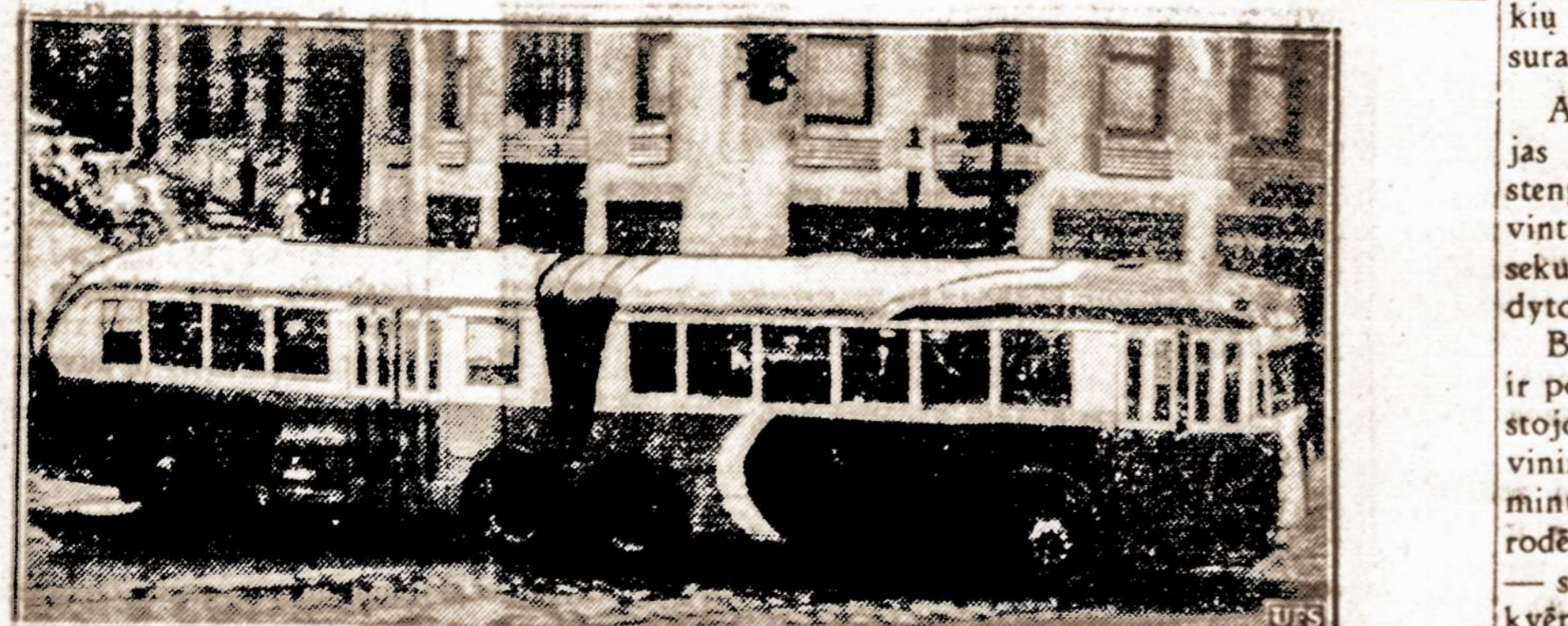
Miestuose didėjant susisiekimui, senosios susisiekimo priemonės pasidaro peranktos. Paveiksle matome naujausias konstrukcijos dvigubą autobusą, kuris sumažina susisiekimo nepatogumus.