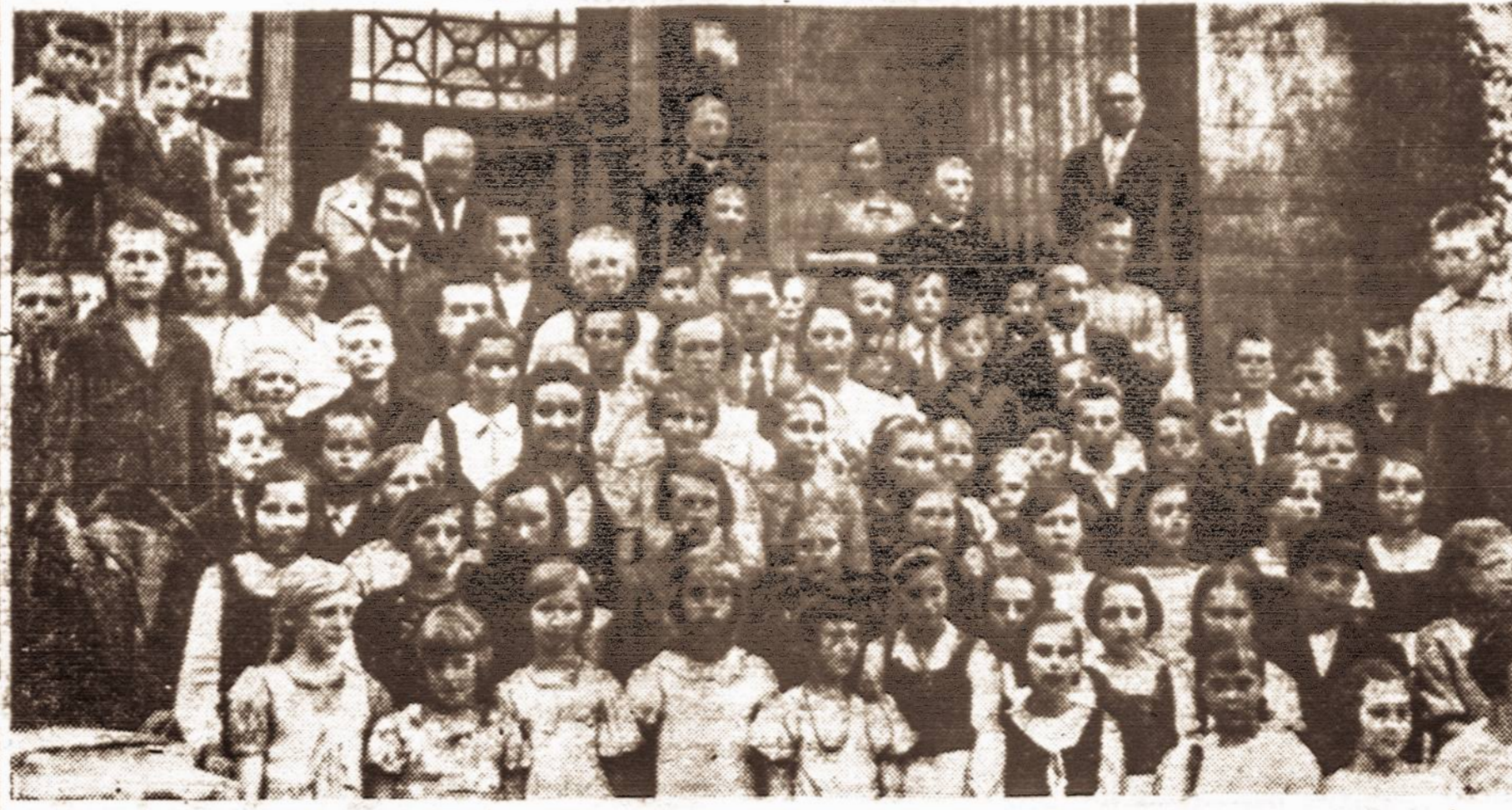
Draugija Užsienių Lietuviams Remti kiekvienų metų vasarą į Gelgaudiškio dvarą sukviečia užsienių lietuviukus vasaroti. Šiemet ten vasaroja 80 vaikų iš Latvijos ir iš Prancūzijos. Atveizde matome vaikučius su savo mokytojais ir globėjais.