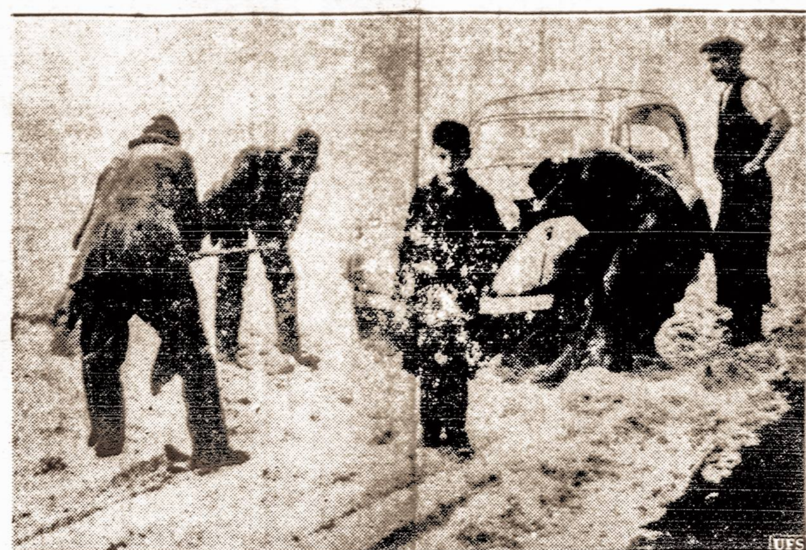
Rugpiūčio sniegas — Ar jūs matėte sniegą rugpiūtyje? Šiomis dienomis Anglijoj po dviejų savaitių vėtrų, pradėjo snigti. Į trumpą laiką p r isnigo 2 pėdas sniego.

Be galo keista, kad atsiranda Amerikoje pakankamai tokių durnelių, kurie perka ir skaito socialistiškus pliotkų organus.