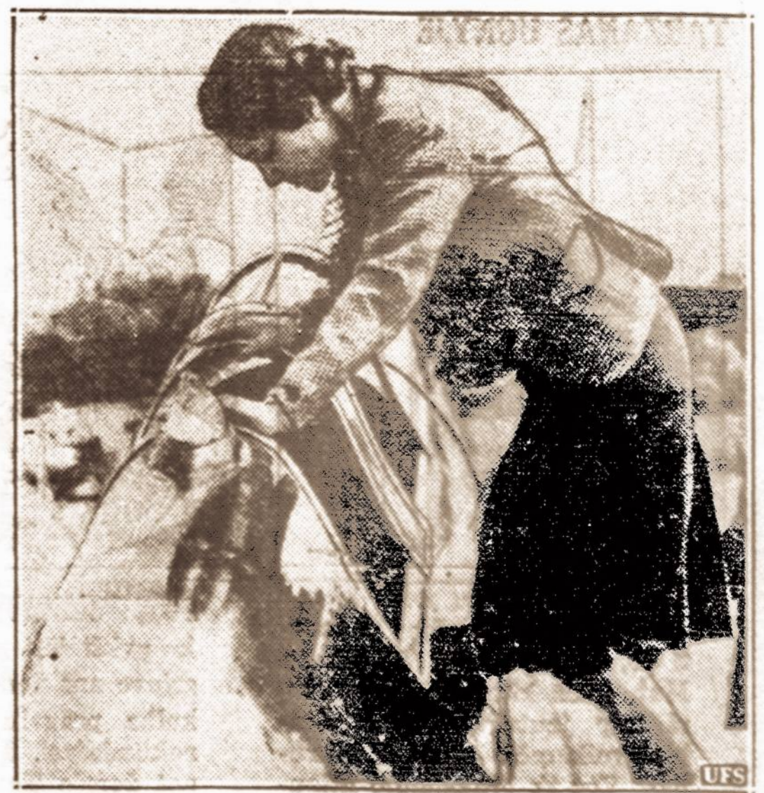
Lindbergai lankėsi Rusijoje—ponia Lindbergienė lipa į lėktuvą, kuriuo ji ir jos vyras niekam nežinant išskrido iš Anglijos į Rusiją