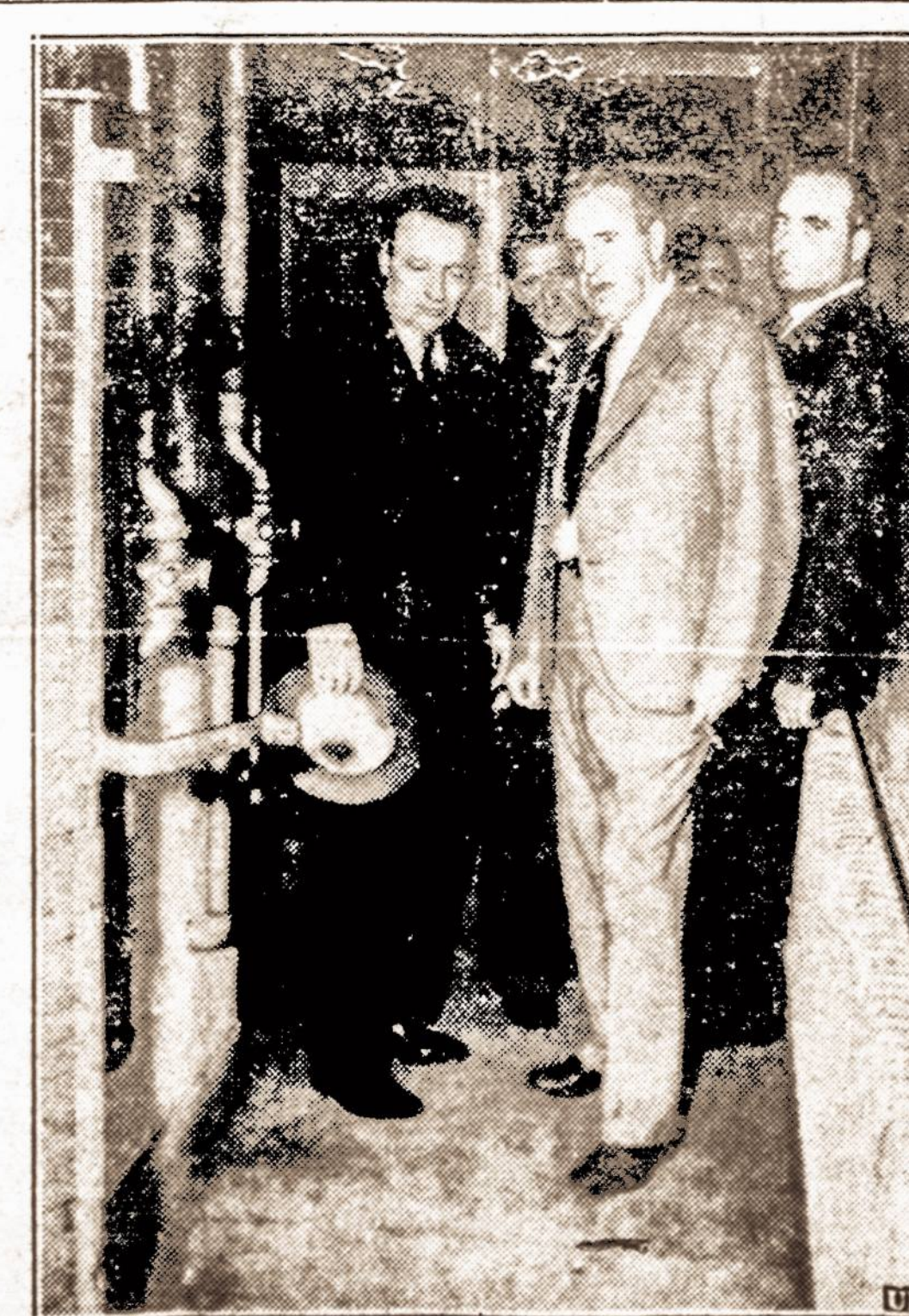
Apžiūri "mirties kameras". — Pensylvanijos gubernatorius George H. Earle kairėje ir kalėjimo viršininkas apžiūri valstybės kalėjimą, kuriame keturi badaujantieji kaliniai buvo užtroėkinti, paleidus karėtus garus.

Šiuo metu Prancūzijos pasienyje Vokietija turi sutraukus apie vieną milijoną kariuomenės, kuri i keėliolika valandų gali būti papildyta dar pen-