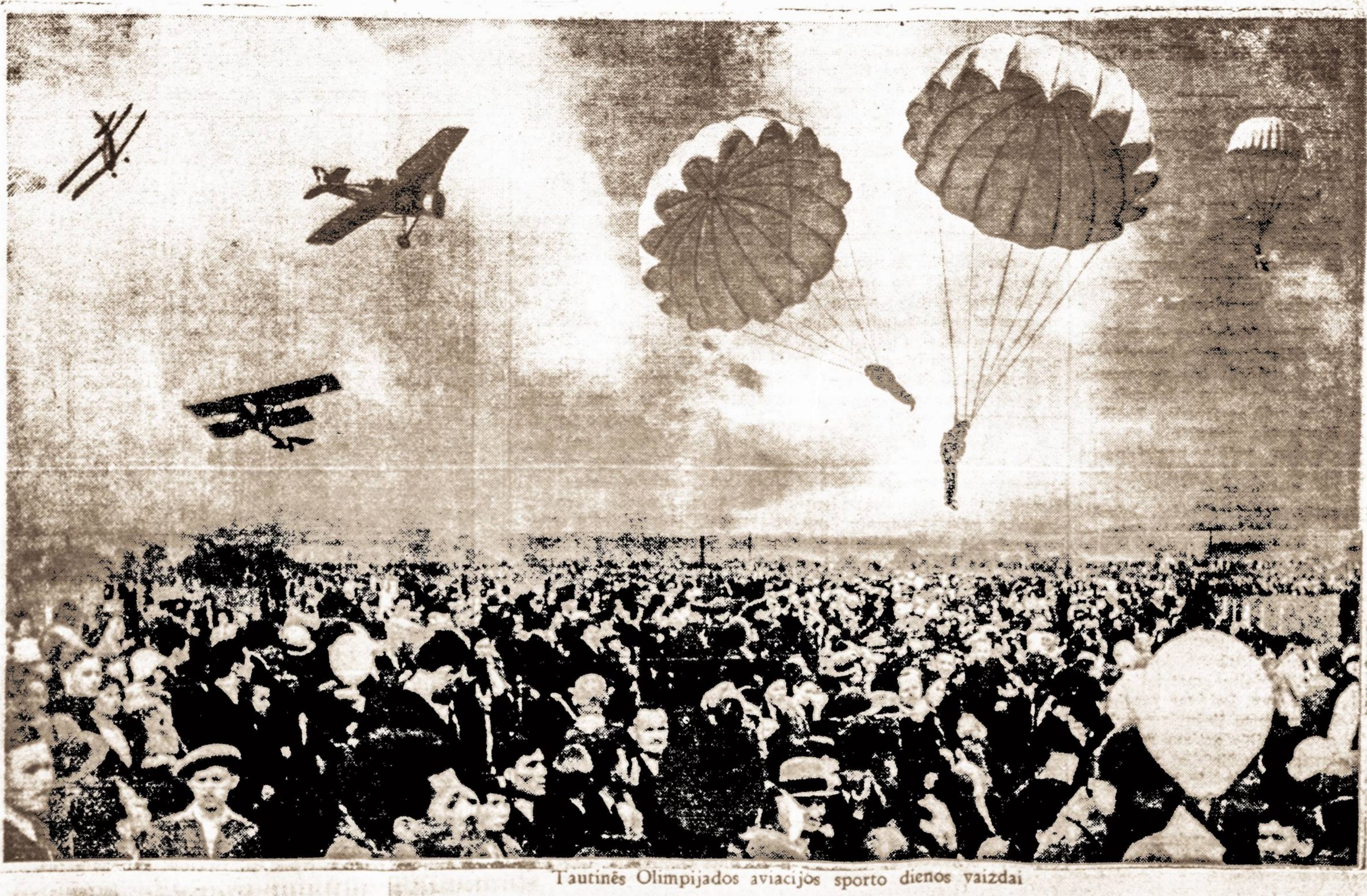
Tautinės Olimpiados aviacijos sporto dienos vaizdas

Vytauto bažnyčia yra labai tvirtų pamatų ir sienų pastatas. Naujai pagrindiniai atremontuoti, apsaugota nuo potvynių, Vytauto Didžiojo bažnyčia dar galės stovėti daug šimtmečių ir būti Lietuvos garbingos senovės paminklas.