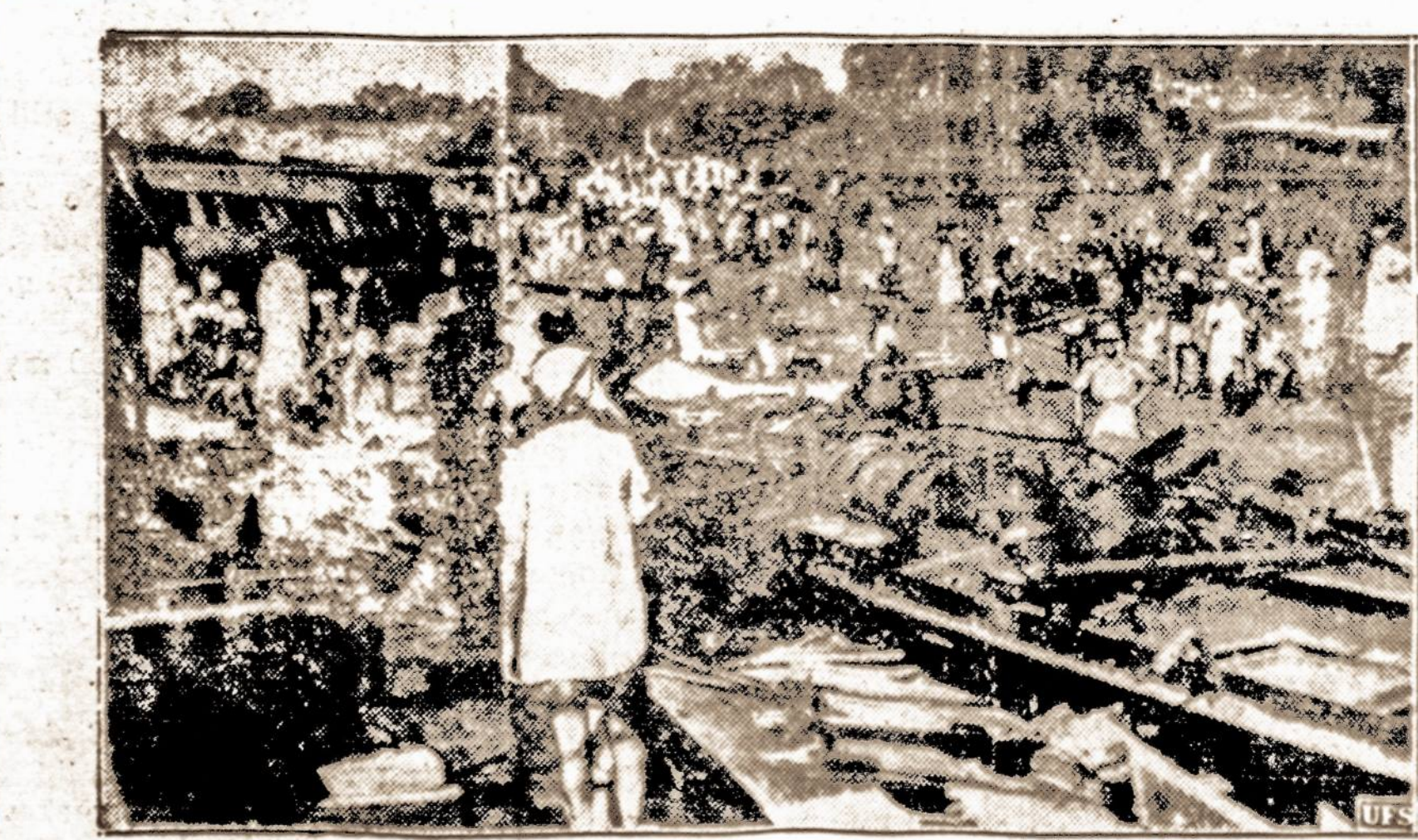
Skaudi nelaimė—Viena iš didžiausių nelaimių kokia kada ištiko Indijos geležinkelį. Traukiniui dėl nežinomo priežastį nuvažiavus buvo uždegtas lokomotyvas.

KAUNAS. — Italijos universitetuose studijavo per 20 Lietuvos žydų. Prasidėjus ten rasistiniam sąjūdžiui, tie studentai jau sugrįžo į Lietuvą ir Italijoj nebedudijuos.