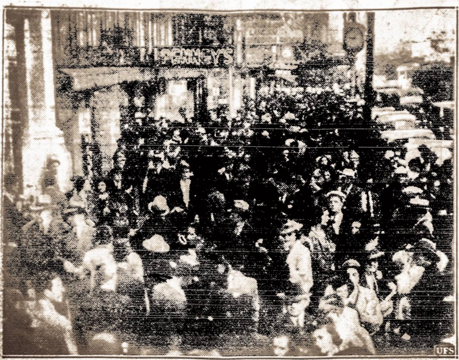
Streikuotojai—Šiuo metu San Francisco streikuoja trisdesimt penkios didelės krautuvės, kurių darbininkai reikalauja geresnių darbo sąlygų.

—Yra tautininkų, kurie moka plunksną valdyti ir kurių spaudoje nesimato. Ką jie veikia? Ar negalėtų bent šiuo klausimu susirūpinti?