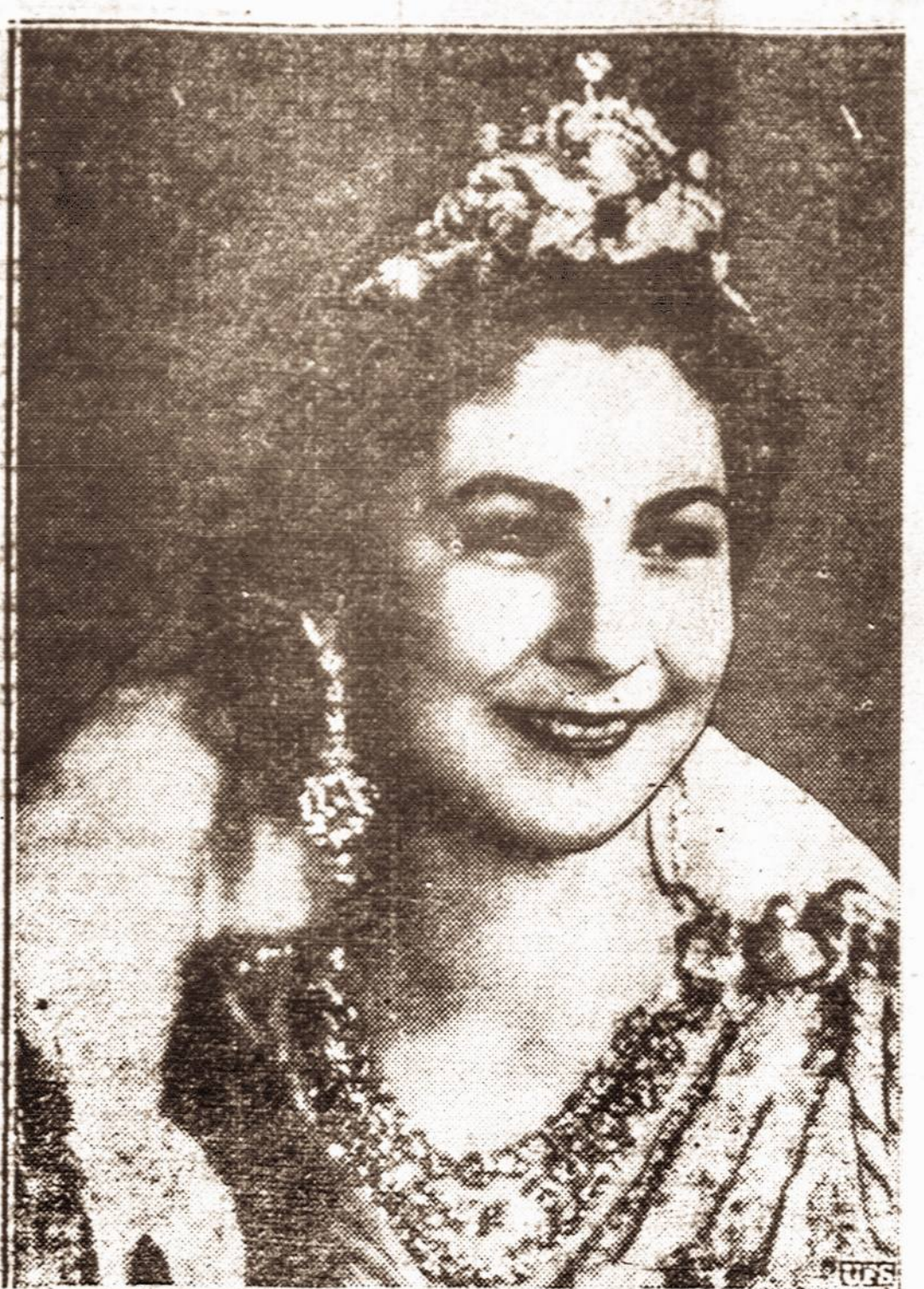
Gražiausia karalienė—Daug gražesne, negu Kleopatra yra dabartinė Egipto karalienė Farida, kuri egiptiečių yra laikoma viena iš gražiausių karalienių kuri kada tik buvo jų istorijoje.