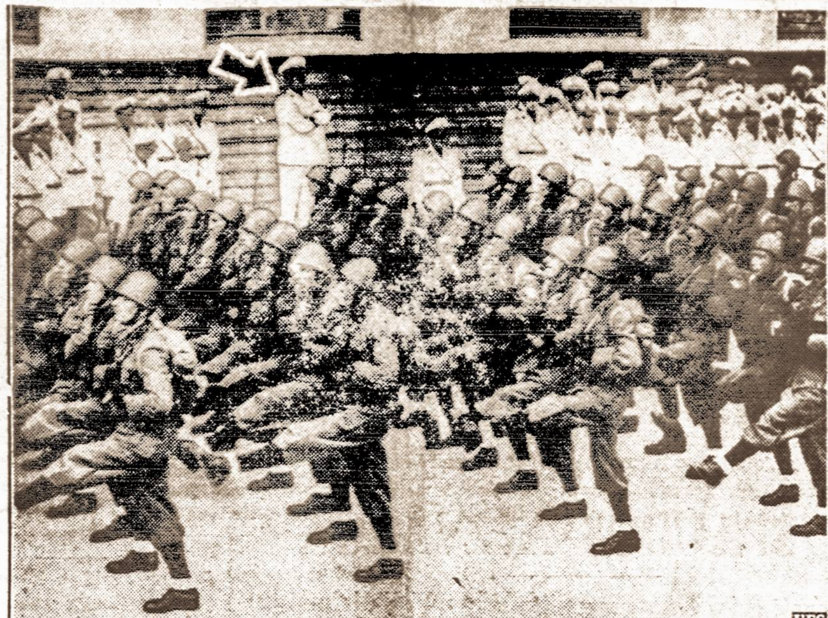
Prisimena Romos laikus—Italijos premieras Mussolini, kuris žiūri į žygiuojančią Italijos kariuomenę, kuri yra žinoma savo tvirtu žygio žingsniu.

Rimto ir pastovaus nusistatymo žmonės tokius straksėjimus vadina nesuvaldančių išsilaukusių klieidėjimu.