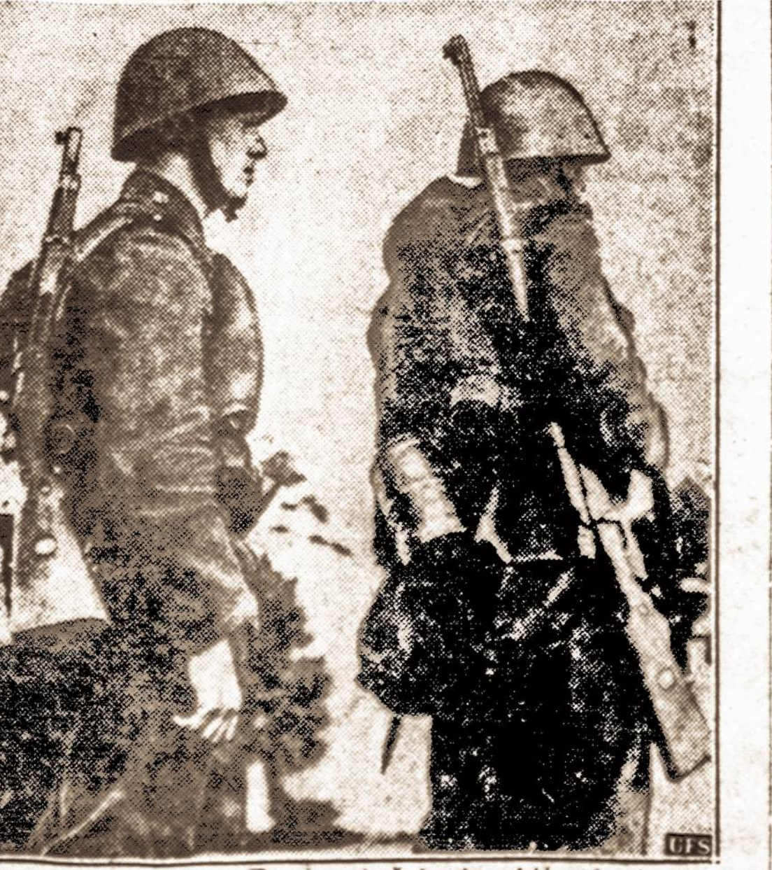
Tėvynės gynėjai. — Du jauni Čekoslovakijos kariuomenės kareiviai pilnoje aprangoje, kurie šiomis dienomis išžygiavo iš Prahos į Čekoslovakijos - Vokietijos pasienį, kad ištikus reikalui galėtų stoti tėvynės gynėjų eilėn ginti gaimtąjį kraštą.

KAUNAS. — Pradėjus kultūrių metų derliaus javus, jau pradeda aiškėti ir galimi bendrieji gausimų grūdų kiekiai. Atrodo, kad visų kultūrų derliai, išskyrus tik kai kurias vietas, Lietuvoje šiemet numatomi didesni ir geresnės kokybės, negu pernai. Rugių derliai numatomi 5% didesni, kviečių net 40%, miežių 19%, avižių—22%, žirnių javų 32% ir sėmenų—6% didesnis derlius, negu praėjusiais metais. Lietuvos Banko korespondentų iš įvairių Lietuvos vietų pranešimai rodo, kad naujojo derliaus šiemet tikimasi gauti iki 32 milijonų centnerių.