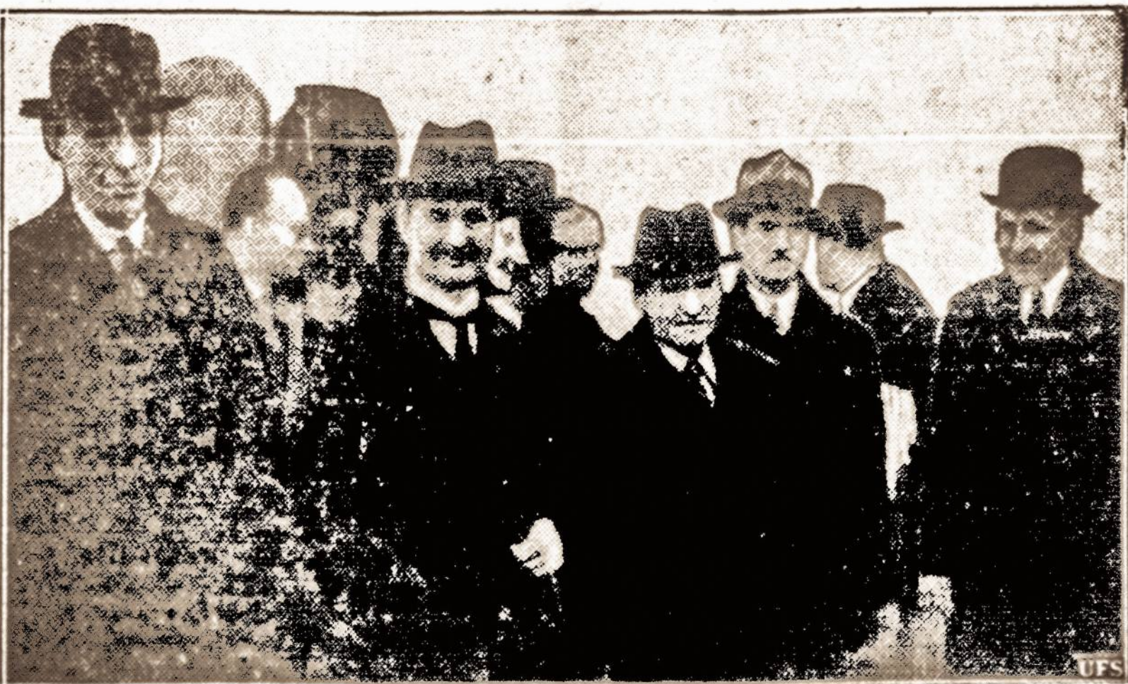
Prancūzai Londone. — Šis radėjo paveikslas iš Londono parodo, Prancūzijos ministeriaus, Croydon aerodrome. Į Londoną jie atskridę buvo, kad aptarti Čekoslovakijos reikalus. Iš kairės d ešinėn stovi: Anglijos užsienio reikalų ministeris Lordas Halifax; premjeras Chamberlain; premjeras Daladier iš Prancūzijos ir ambasadorius Corbin. Už Chamberlain'o matosi ministerio Bonnet profilis.

BRUSELIS. — Lenkų balonas Lopp nusileido Bulgarijoje 1.100 mylių atstu nuo Liege, Belgijoje, iš kur prasidėjo balonų rungtynės. Kitas lenkų balonas Warszawa nusileido Rumunijoj, 920 mylių nuskrėdęs. Dar nežinoma kur atsidūrė 4 balonai. Jei niekas toliau nenuskris, tai lenkai laimės rungtynes.