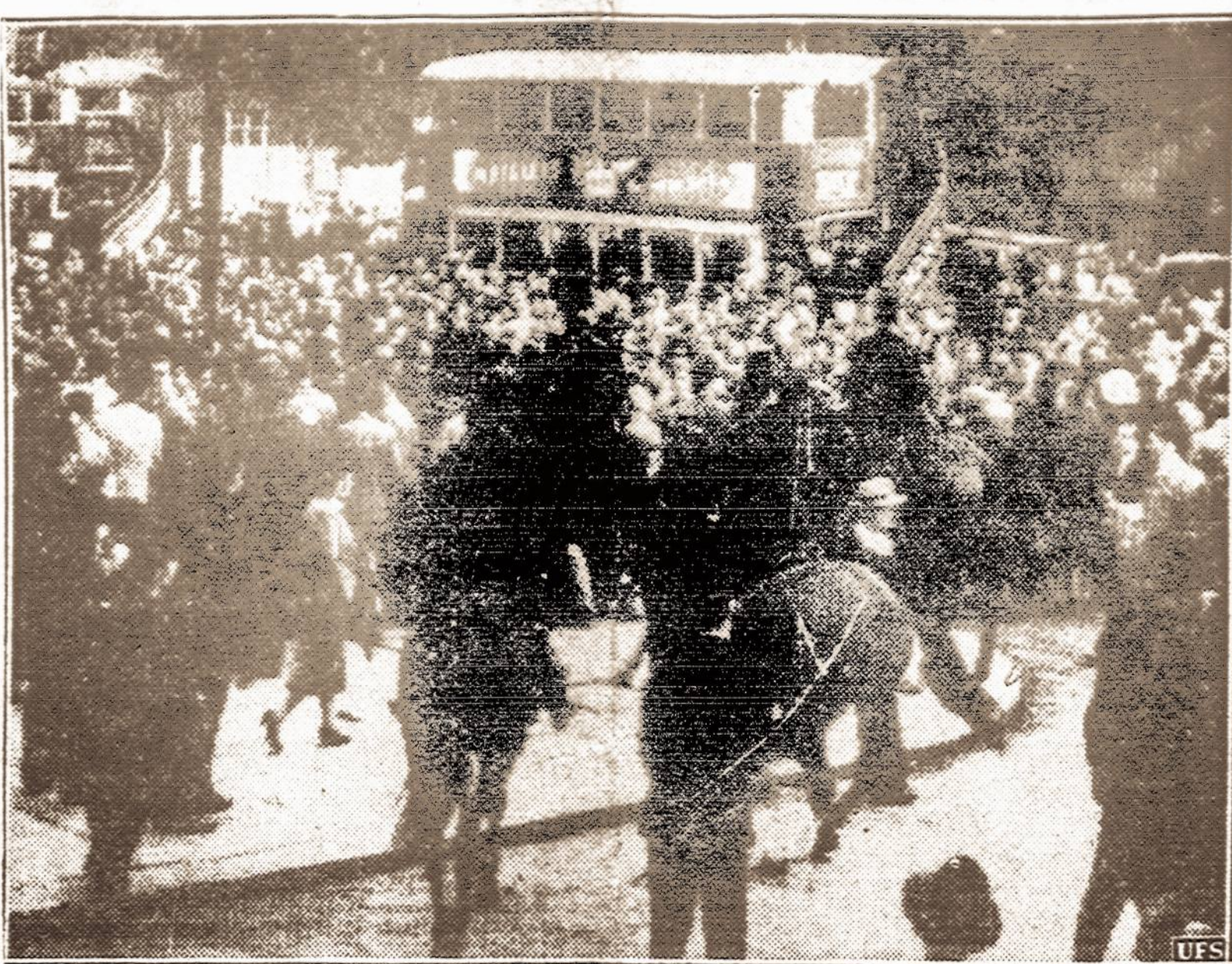
Demonstracijos Londone. — Anglijos ir Prancūzijos ministeriams posėdžiaujant, susirinkusi didžiulė minia pradėjo triukšmauti reikalaujama, kad Hitleriui nebūtų suteikta jokių konsesijų ir, kad vyriausybė stotų už čekus. Dideli policijos rezervai buvo išaukti tvarkai palaikyti.