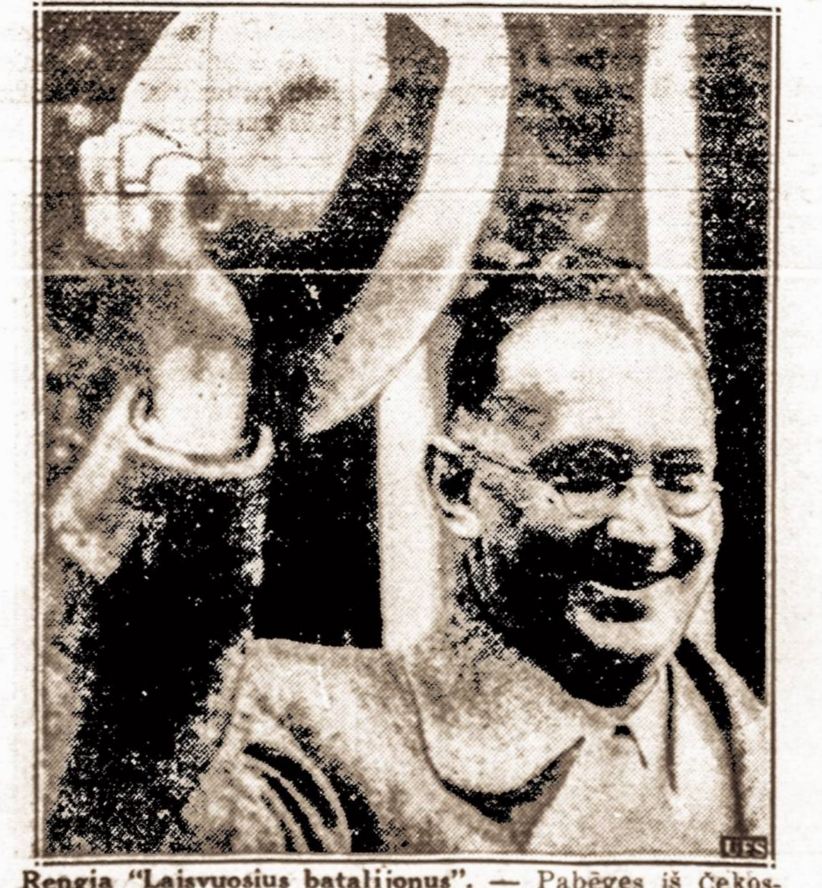
Rengia "Laisvuosius batalijonus". — Pabėgęs iš Čekoslovakijos sudetų vokiečių partijos vadas, Konradas Henlein, šiuo metu organizuoja vadinamus "Laisvuosius batalijonus" iš sudetų pabėgėlių, kurie, jei reikalus bus, eis pulti Čekoslovakiją.