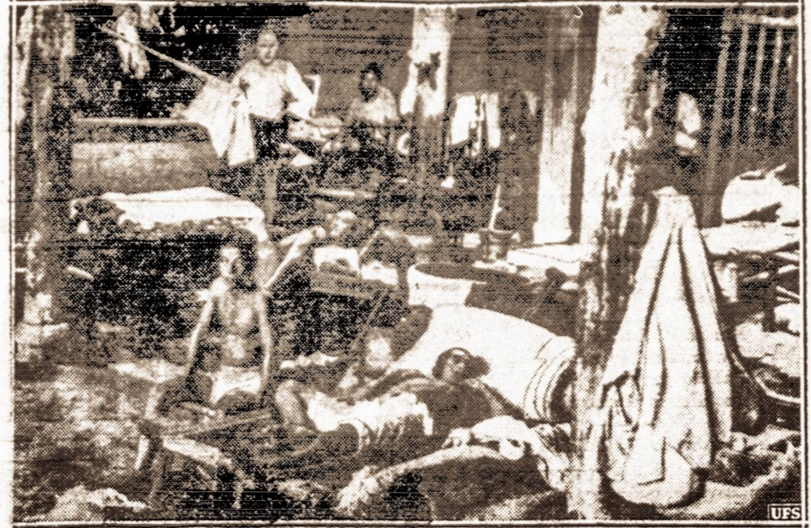
Kiniečiai kaliniai. — Prasidedus Kinijos-Japonijos karui, viso pasaulio spauda apie tai rašė pirmuose puslapiuose. Dabar, kada Europoje gresia naujas karas, daugelis užmiršo apie šį karą, kuris vis tik yra tęsiamas. Paveiksle matome kiniečių kareivius, kuriuos japonai laiko paėmę nelaisvėn.