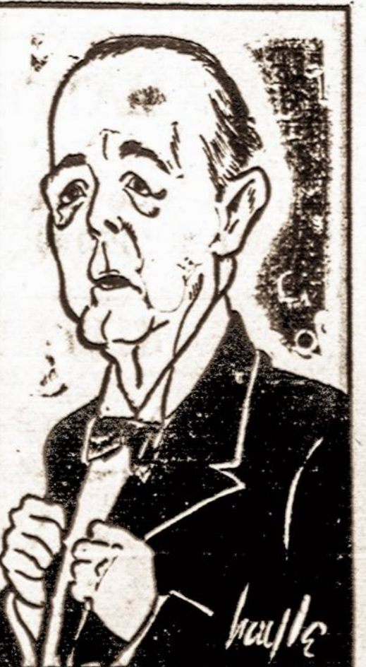
TO PARLEY—This caricature is of Viscount Walter Runciman, British mediator in the Czech-Sudeten dispute, who has been recalled from Prague to London. Presumably his presence was desired in London that he might give advice to Prime Minister Chamberlain and the Cabinet, following Chamberlain's visit to Hitler in Germany. Political observers wondered, however, if he would return to his conversations in Prague.

Please address all mail concerning this page to the editor, 104-40 117th Street, Richmond Hill, New York. Manuscript should be written on one side of the paper and will not be returned unless accompanied by stamped, self-addressed envelope.