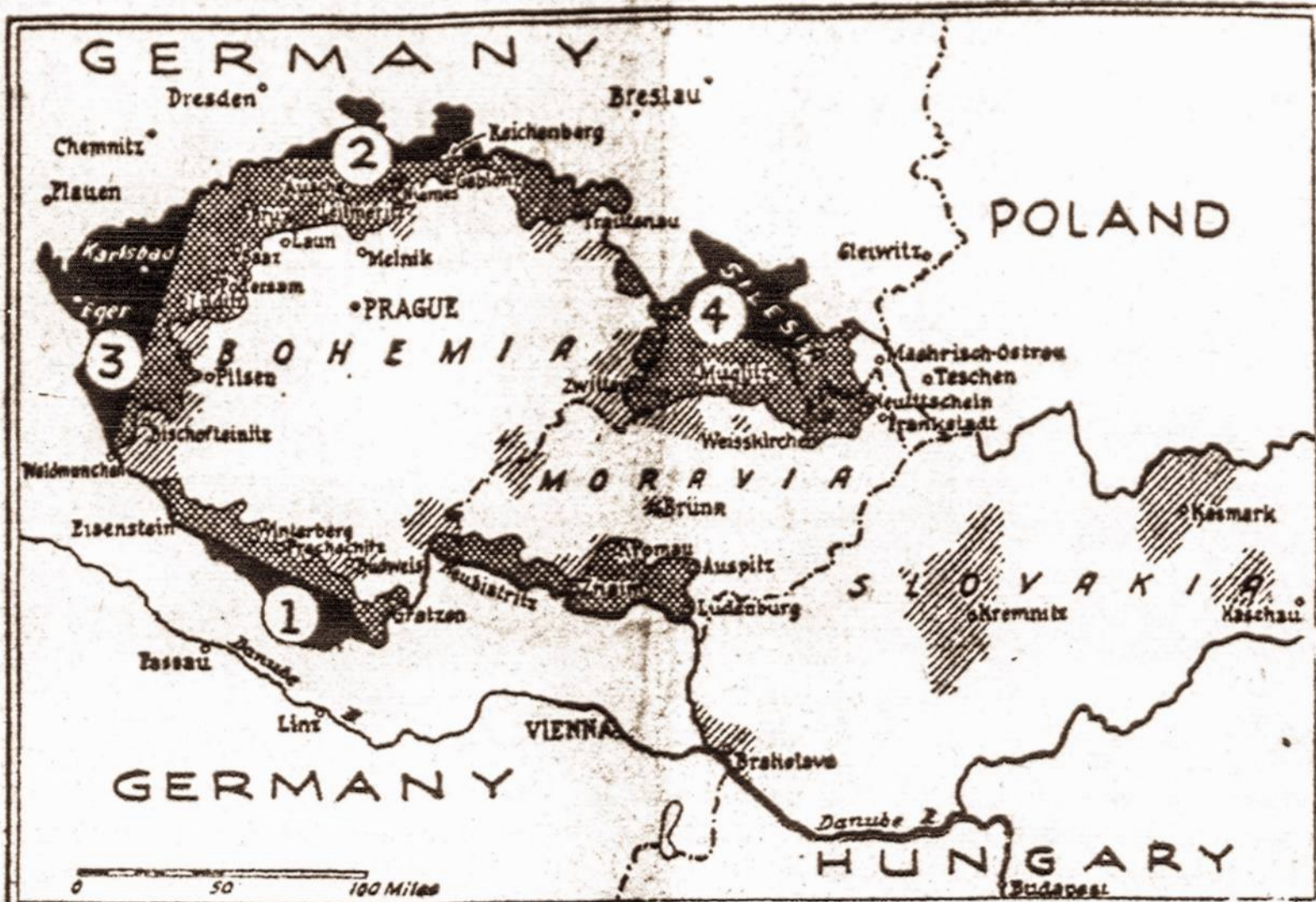
Cekoslovakija mažėja. — Tamsiosios žemėlapyje vietos parodo, kurias Čekoslovakijos teritorijos dalis Vokietija gavo. Šviesesnės vietos yra tos, kuriose netrukus bus laikomas plebiscitas, kurį prižiūrės tarptautinė komisija.

Nerimta kabinėtis prie VIENYBĖS vien dėlto, kad rimti lietuviai netiki socialistų pasakoms apie Lietuvą.