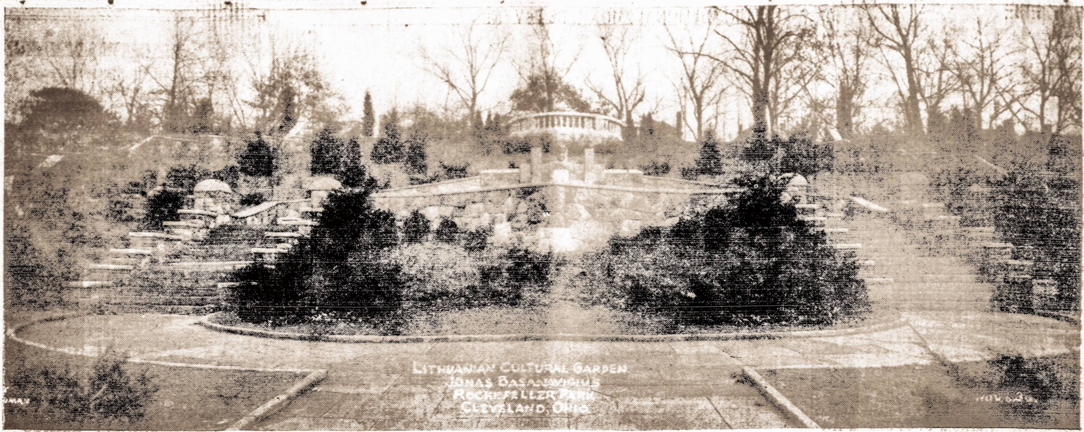
Clevelando Lietuvių Kultūrinio Darželio vaizdas — apatinė dalis, kur matosi dr. Basanavičiaus paminklas ir Gedimino Stulpai. Viršutinėje dalyje stovės Kudirkos ir Maironio paminklai.