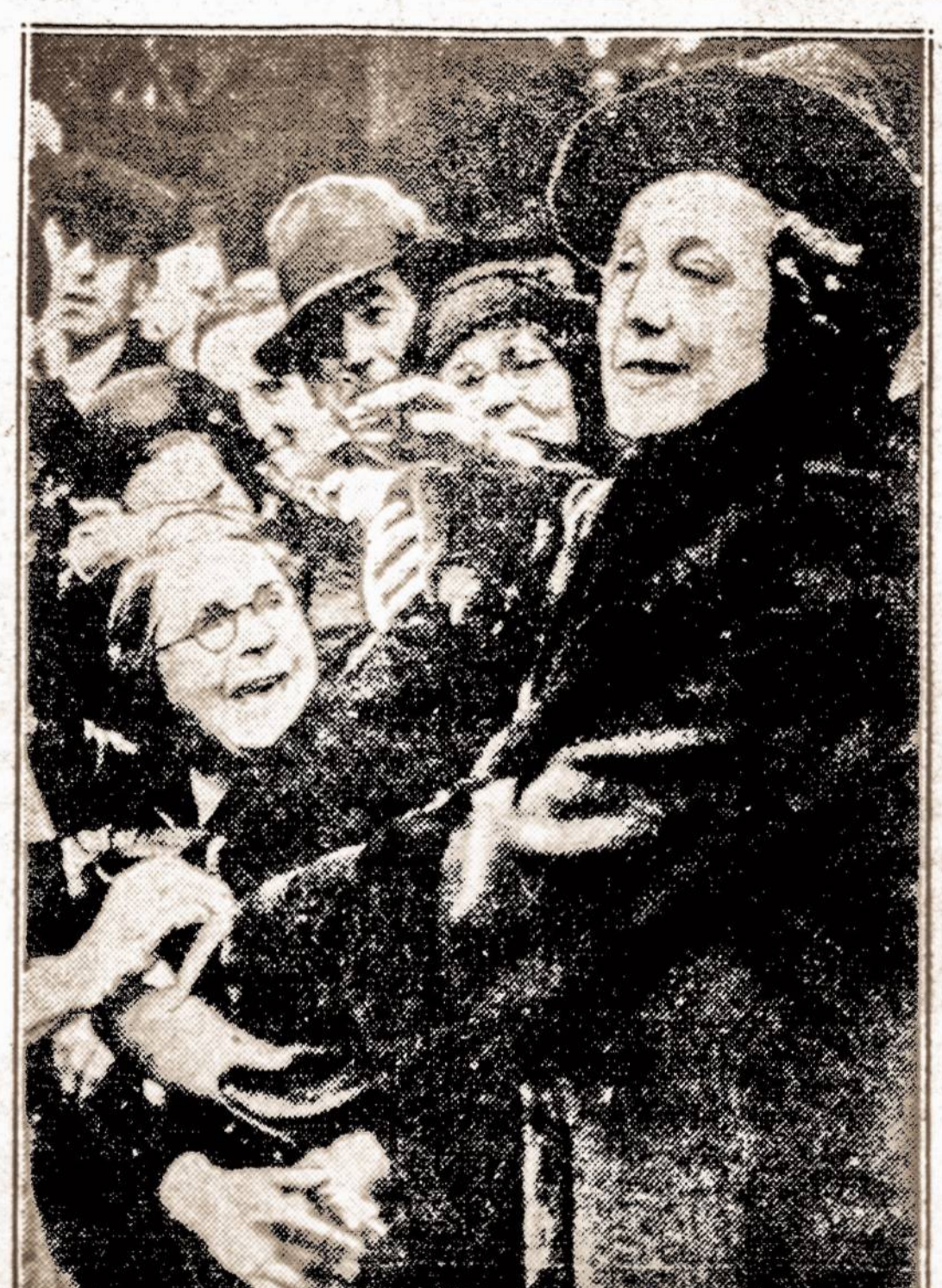
Sveikina. — Anglijos p. remjero žmona Chamberlainienė, kuri yra labai populiari visoje Anglijoje. Pateikė matome minią žmonių, kurie ją sveikina jos vyriausybės laimėjimo parlamente proga.

KAUNAS. — Dabar taip išgarsėjusi filmų artistė šešiolikmetė Diana Durbin iš visų pusių gauna daugybę laiškų. Laiškašiai neseniai rašė, kad vieno amerikos fermerio sūnus parašęs jai laišką net iš 1,000 puslapių. Bet Diana Durbin sužavėjo ne tik Amerikos fermerio sūnus, bet ir vienas Kauno gimnazistas, matęs ją filmoje "Jų simtas, o aš viena" ir taip pat nutarė parašyti artistei laišką, kuriame prisipažino meilėje. Jo laiškas, pasirodo, ne tik pasiekė dievinamąją, bet jos garbintojas net gavo atsakymą su fotografija ir jos autografu. Tik aistringam garbintojui Hollywoodo žvaigždė mandagiai pataria pirmiau praprašavimas neišsipildė, nes baigti mokslą, o paskiau galvoti apie Hollywoodą ir meilę.