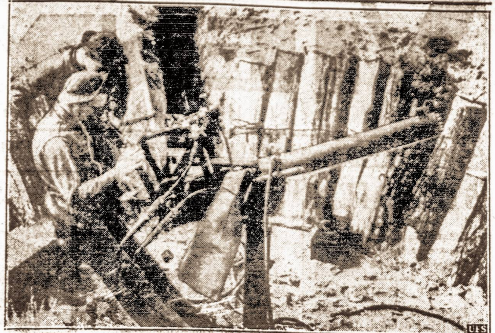
"Berta". — Paveiksle matome Amerikos didžiulius kulkosvaidžius, kuriuos karo žinovai vadina "Bertomis". Jie yra vieni iš didžiausių kulkosvaidžių pasaulyje.