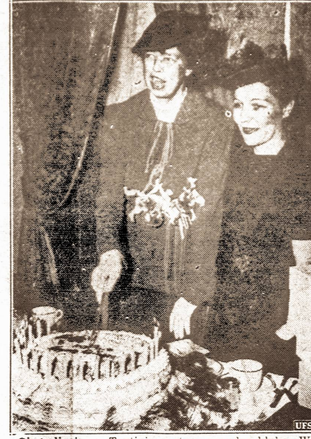
Gimtadienis. — Tautinis moterų spaudos klubas Washingtono suruošė ponai Rooseveltienei vašes jos 54-to gimtadienio progą. Paveiksle matyti prezidentienę piauant tradicinį gimtadienio "keiką".