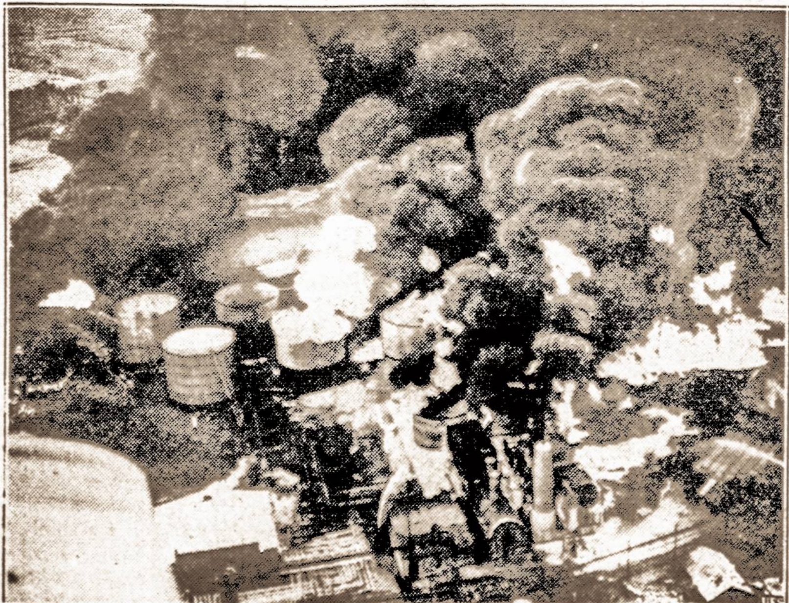
Didžiulis gaisras. — Virš 10 milijonų galionų gasolino ir aliejaus dega Linden, N. J., kur sproguos vieno milijono šesiu tūkstančių galionų talpos tankui, ugnis persimetė į kitus tankus ir išsivystė į milžinišką gaisrą.

KAUNAS. — Akc. Maisto bendrovės vadovybė prieš kurį laiką nutarė pastatyti Kaune, prie fabriko esančiame sklype, visą eilę namų darbininkams. Teko patirti, kad šis nutarimas netrukus bus jau pradėtas įgyvendinti. Namų projektas yra paruoštas. Pradžiai manoma pastatyti aštuonėtu namų, turinčių po 4 butus. Šių namų sienas sunarstyti tikimasi dar šiemet.