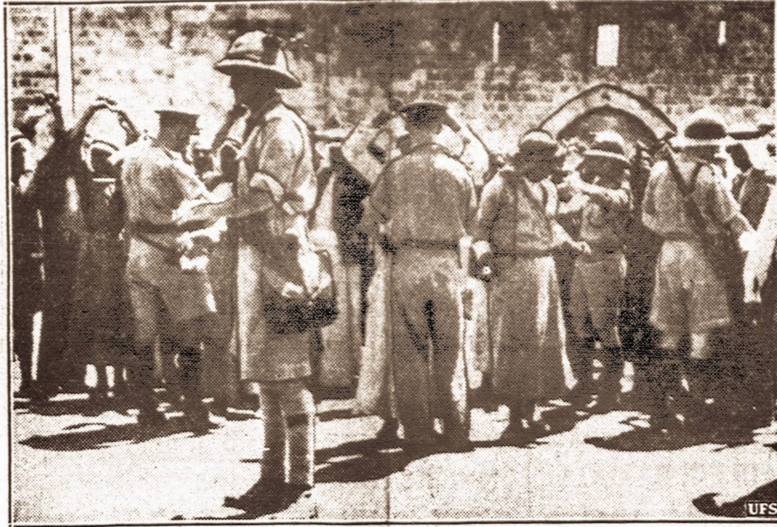
Krata. — Žudynės, terorizmas ir sabotazas vykina ma visoje Palestinoje, nors britų kariuomenė ir policija stengiasi nuraminti besipiečiančią betvakę. Atvaizde parodoma kaip britai peržiūri į Jeruzalę keliaujančius arabus, kad nepraleidus su užslėptais ginklais.

Bet... Vokietijai gal teks Vengrijos kviečiai ir Rumunijos aliejus, o vėliau ir lenkų žemės.