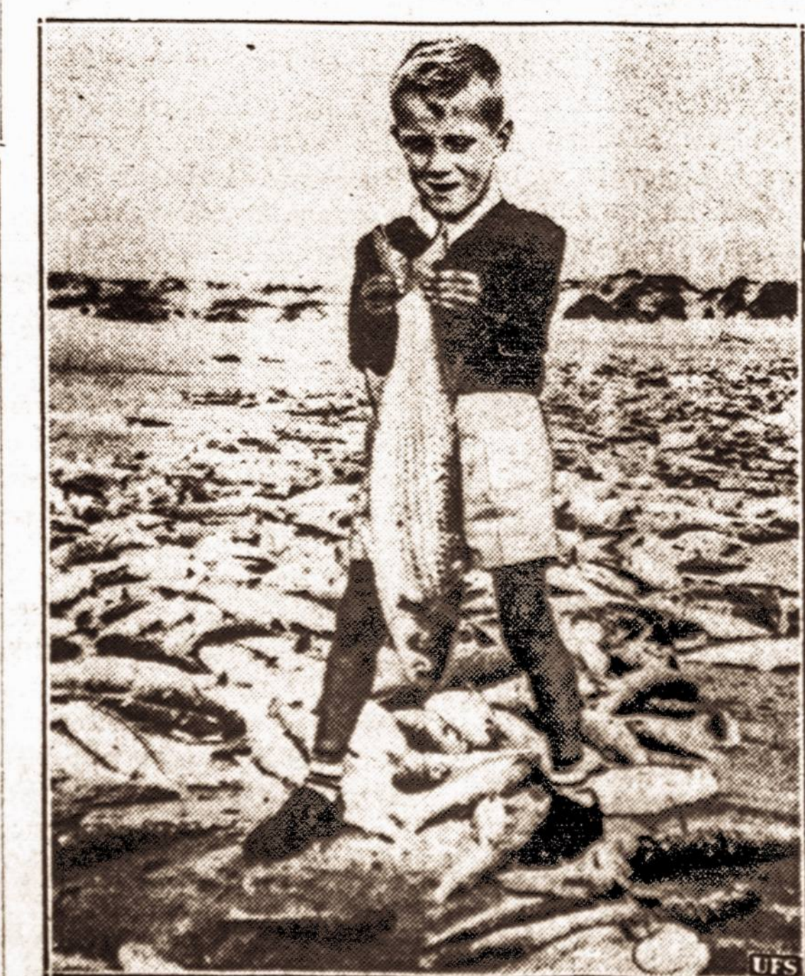
Jūrų dovana. — Smarki audra North Carolina pakraščiu suvarė žuvų daugybę ir j žuvininkų tinklus. Matome 30,000 svarų žuvų kaipo žvejo plena. Vaikutis laiko rankoje 10 svarų žuvį.

NEW YORK. — Gubernatorių Herbert H. Lehman, demokratų kandidatas perrinkimui ir jo kandidatas vice-gubernatoriaus pareigoms Chas. Poletti atsiskakė priimti komunistų tulką jų išrinkimui. Darbo Partija jau anksčiau užgryrė šiuodu kandidatu ir juodu priėmė tos partijos tulką. Spalių 14 d. komunistai ištraukė savo sąrašus Lehmano-Poletti naudai, betgi tie nesutikio priimti siūlomą tulką.