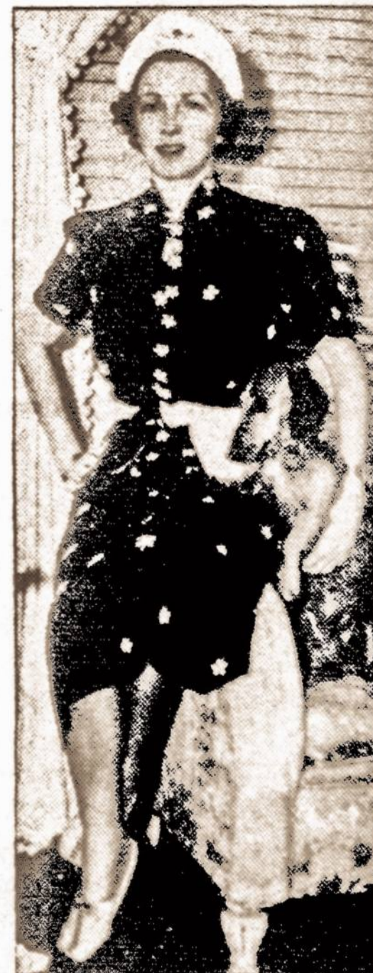
Irene Castle McLaughlin, kuri su neseniai mirusia Vernon Castle sudarė tarpautiniai pagarsėjusį Amerikos šokėjų duetą.

NEW YORK. — Buksirų (tugboat) darbininkai sustreikavo uoste, kai derybos su darbdaviais nutrūko. Streikas gali išsiplėsti ir nutraukti susisiekimą uoste.