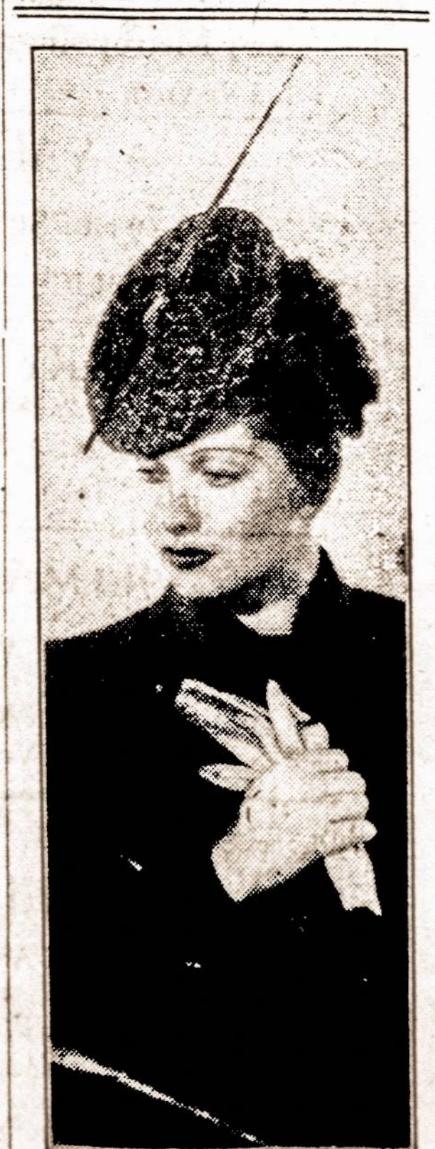
Lucille Ball, žinoma aktorė su naujos mados skrybėlė.

Intelligentinės šeimos yra stipresnės. Jų tarpe auga susipratimas, tarpusavio draugiškumas, meilė: pas darbininkus viskas grubiai. Juk kadaise čia šeima buvo religinga, laikėsi tradicijų, pripažino artimo meilę. Sovietų šeima visiška dar nesustiprėjo. Norint, kad ji būtų stipri, jei reikalingas atskiras kampas, kuriame galėtų būti ugdoma šeimos laimė. Bet ten viskas atvirkščiai, šeimos gyvenimas yra matomas, per daug bendras ir suvisuomintas. Ir iš tikrųjų, koks gali būti gyvenimas, ar galimas pasitikėjimas, jeigu šeimoje vyksta viskas kaip turguje. Intelligentas dar įstengia visa tai dvasiniai sugrumuluoti, atskirti smulkmenas nuo svarbių ir brangių daiktų. Jeigu megstinis arba kitas koks nors rūbas negali būti duotas žmonai dėl to, kad tas vyras yra biednas, o žmona to vargo neįstengia nei suprasti nei atskirti nuo to, kas yra svarbu, tai ar gali būti šeima stipri. Juk paprastas tarpusavio ryšys rotyj dėl smulkmenų gali nutrūkti. O čia dar prisideda vaikai pranešėjai... Tėvai tokioj padėtyj savo autoritetą negali turėti ir jį išlaikyti. Šeima turi dvasiškai aukštai pakilti, jeigu norėti, kad tas autoritetas būtų šeimai sugrąžintas. Šiandien vyrų ar žmonių dar blogai nutiekia visuomeninis nerimas, pavargimas, amžina nešvara, nepritekliai, baimė prieš Čeką, areštai ir kiti aplinkos veiksniai. D.