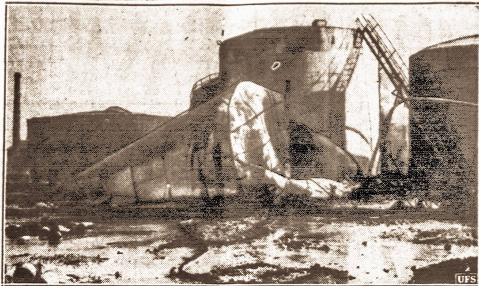
Gaisro pasekos. — Vaizdas gaisro sunaikintų aliejaus tankų Linden, N. J. Gaisras sunaikino 21 tanką, padarydamas virš pusę milijono dolerių nuostolių.