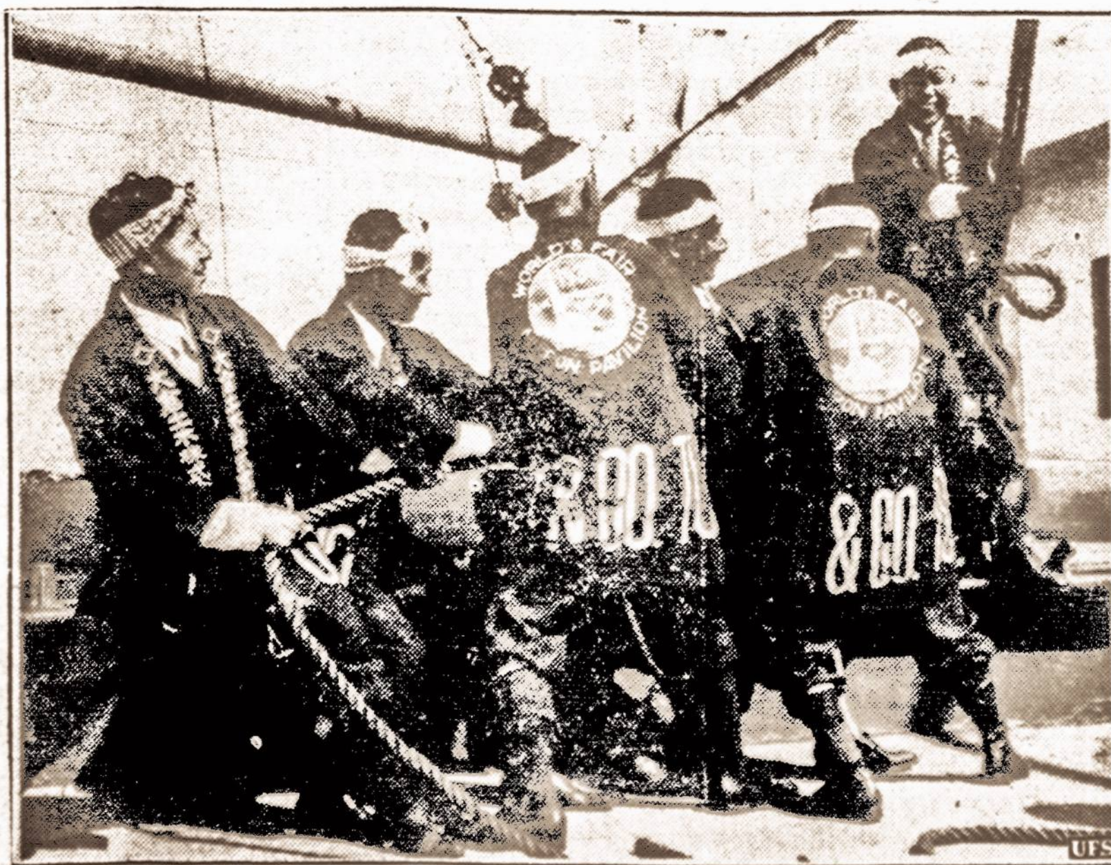
Statomas palocius. — Vaizdas dirbančių japonų pastatymui japoniško palocius taip vadinamoje Aukšinių Vartų Parodoje, kuri įvyks 1939 m., Treasure saloje, San Francisco įlankoje, Kalifornijoje.

Numatoma: Debesuota. su maža permaina temperatūros. Saulė teka 6:09 val., leidžiasi 5:14. Dienos ilgis 11 val. 5 min.