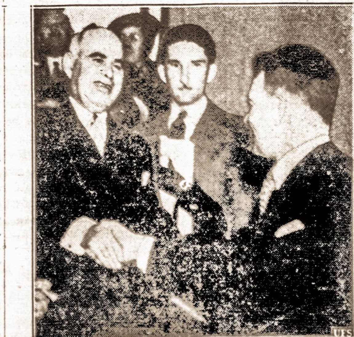
Prieš pasisveikinimas. — Gubernatorius Herbert H. Lehman ir valstybės gynėjas Thomas E. Dewey sveikinasi sustikę lenkų kandidate, kuriame jie abudu kalbėjo. Kai žinoma, jiedu kandidatuoja į New Yorko valstybės gubernatoriaus urėdą. Lehmanas demokratų partijos kandidatas, o Dewey republikonų partijos kandidatas.