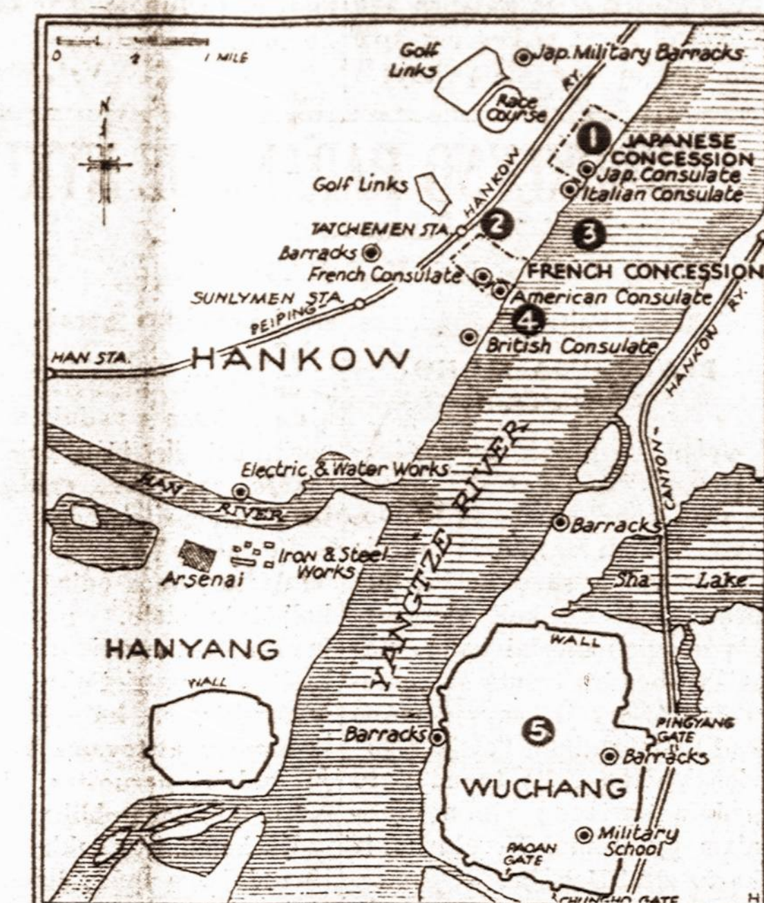
Karo žemėlapis. — Kada japonai paėmė Hankow miestą, kiniečiai padegė japonų turta (1) ir susprogdino Tatchemen stotį (2). Du Anglijos laivai užėmė pozicijas (3) ir du Amerikos laivai (4). Japonai paėmė Wuching (5), kurį pirmiausia nebuvo užėmė.

MARIJAMPOLĖ. — Šią vasarą Marijampolės apskr. audros su ledais palietė apie 300 ūkininkų javus ir padarė daug nuostolių. Nukentėjusieji ūkininkai padavė apskr. derliaus sunaikinimo komisijai prašymus paskirti jiems pašalpų. Prašymai šiuo metu svarstomi ir pašalpos skirstomos.