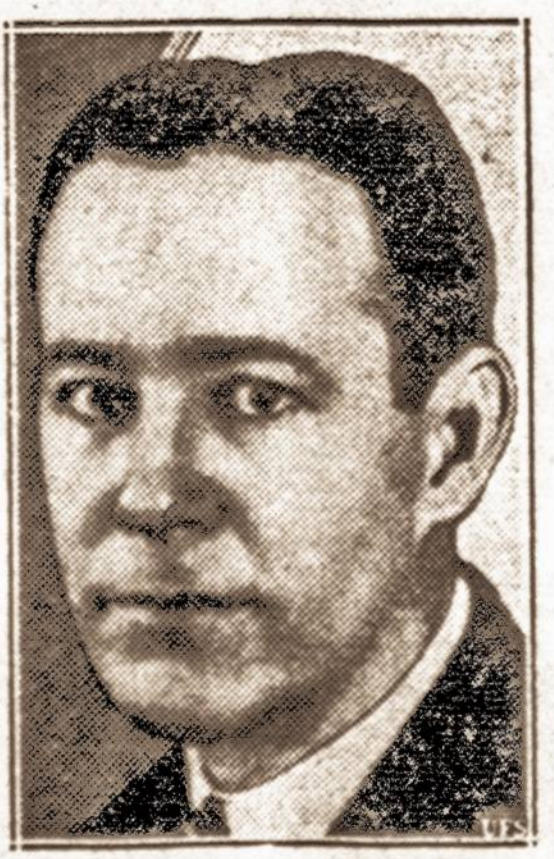
Herbert R. O'Connor, demokratas, išrinktas Marylando valstybės gubernatorium.