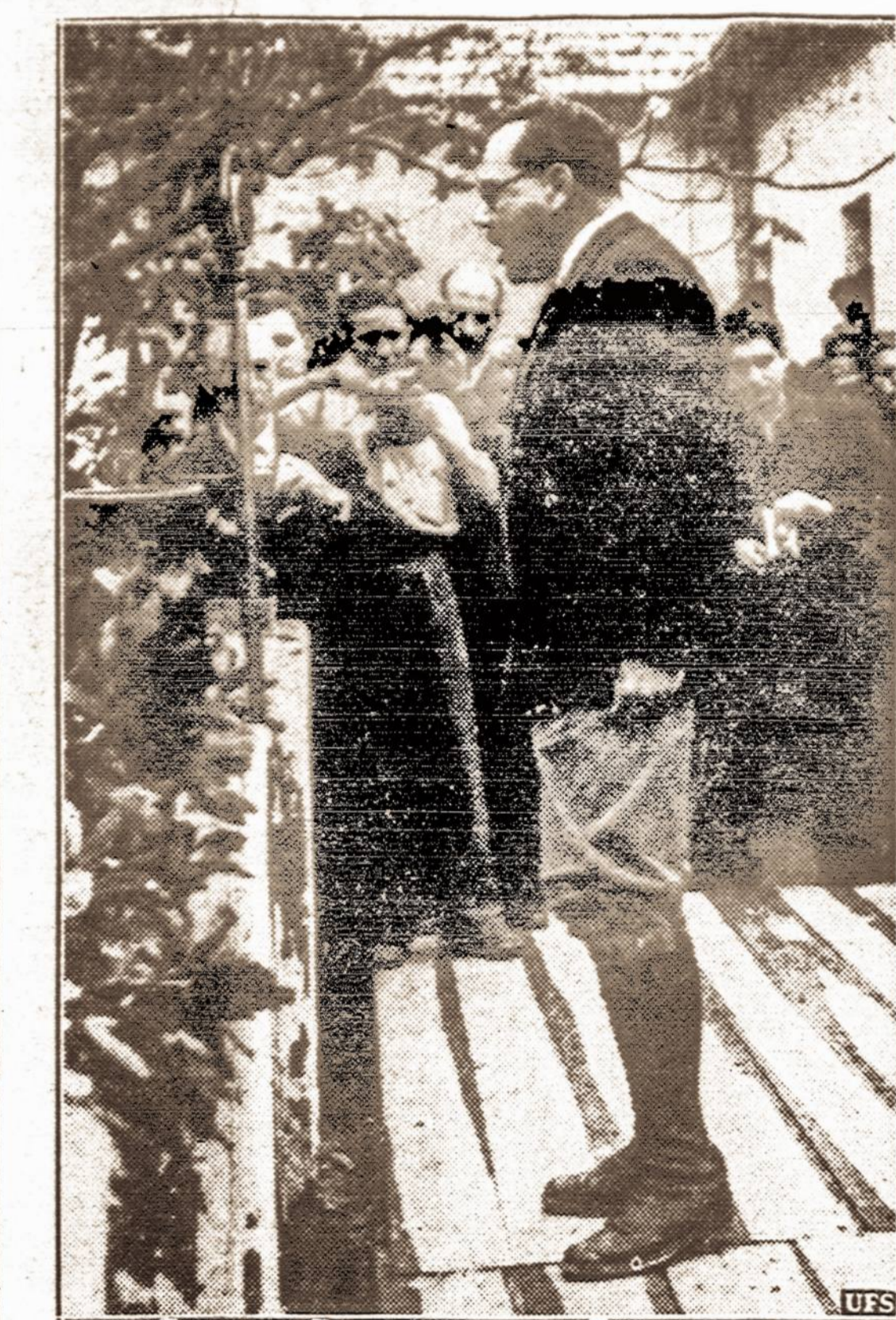
Atsisveikina savonorius. — Išardžius tarptautinę brigadą, kuri ilgą laiką kovojo Ispanijos lojalistų pusėje, lojalistų premjeras Juan Negrin pasako atsisveikinimo kalbą paskutiniame svetimšalių savonorių parade prieš jėms išvažiuojant.