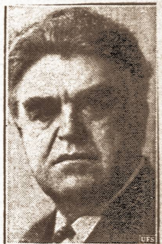
John Lewis, C.I.O. vadas.

taiką su AFL. Jis pareiškė, kad CIO šiuo metu turinti septynis milijonus trisdešimt septynis tūkstančius aštuonis šim-