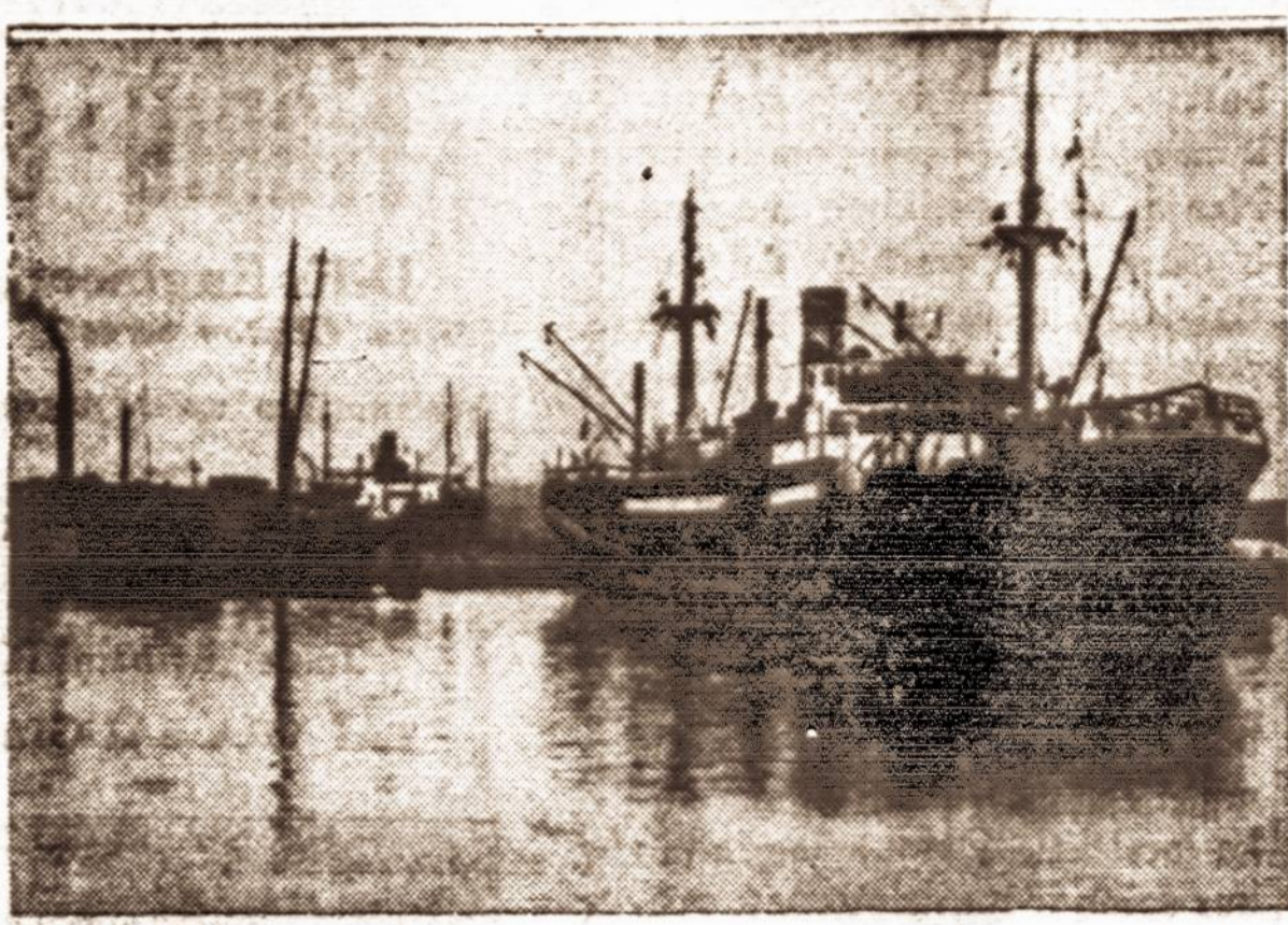
Į Klapėdos uostą įplaukia laivai su kroviniu iš užsienio.