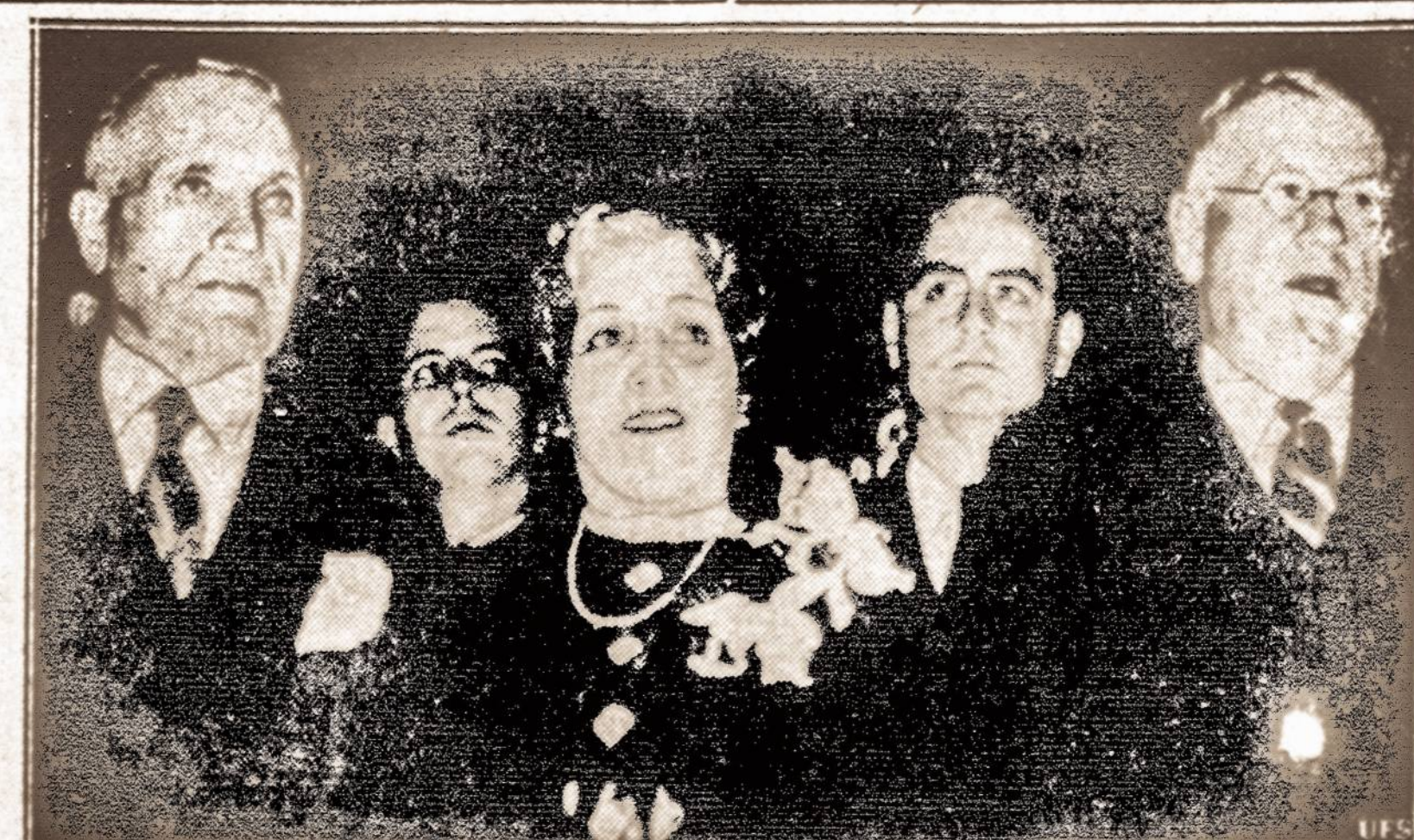
Garbės svečias. — Šiomis dienomis Kuboje Pan-Amerikos kongrese lankėsi vidaus reikalų ministeris Harold Ickes, kuris Havanoje pareiškė, kad viešųjų darbų programą Amerikoje pasirodė naudinga krašto ekonomijai ir sustiprinti ir bedarbių skaičių sumažinti. Jo garbei Kuboje suruoštos iškilmės.

Taip pat niekuo nepagrįstos žinios skleidžiamos ir apie tariamuosius Vokietijos pasiūlymus Lietuvai, kurie būvę išreikšti reikalavimų forma.