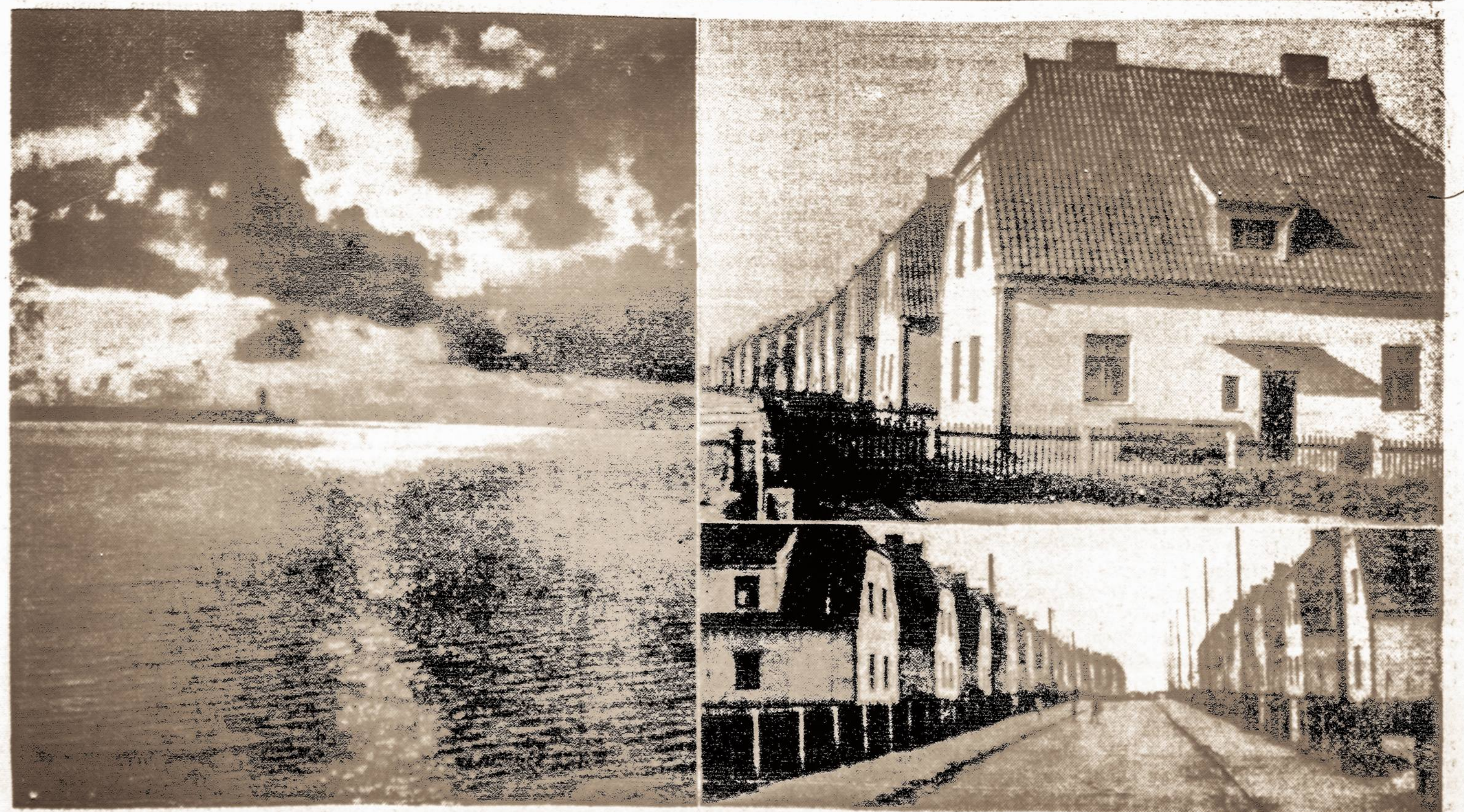
MŪSŲ PAJŪRIO VAIZDAI: kairėje, ten kur Baltijos jūrą skalauja Lietuvos krantus, Dešinėje modernioji Smetlės statyba. Viršuje, modernūs gyvenamieji nameliai: apačioje, naujojo kvartalo gatvės vaizdas.