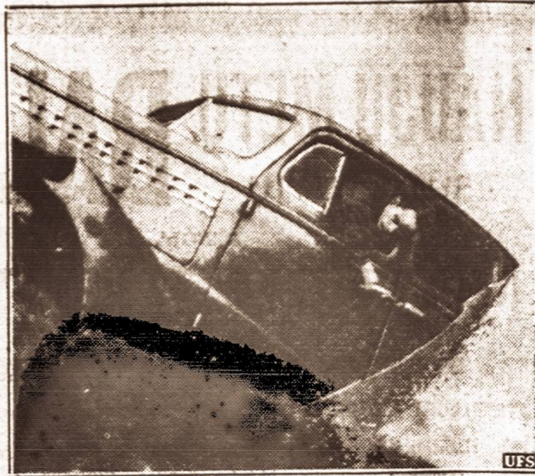
7 vaikai prigėrė automobilyje. — Netoli Wilkes Barre, Pa., nuo kelio nuslydo automobilis ir įkrito į seną vandens užlietą anglies kasyklą. Automobilyje buvo 7 vaikai ir vienas vyras. Visi prigėrė.