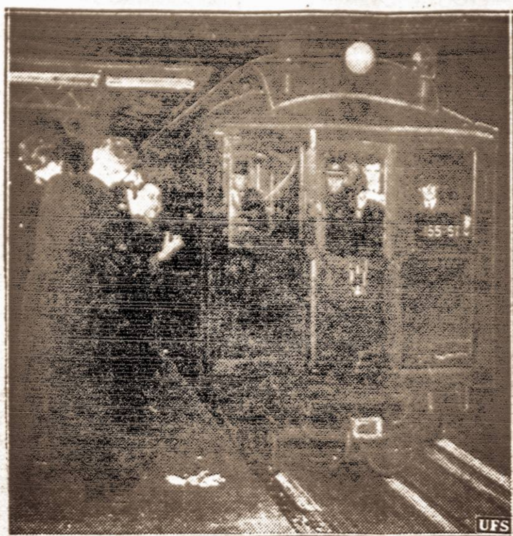
Paskutinis 6th Ave L traukinys. — Pereitą sekmadienį New Yorko 6th Ave "L" geležinkelio linija praėjo paskutinis traukinys. Ši linija dabar parduota už $80,000. Ji netrukus bus nugriauta.

Paskutinių poros dienų oras drėgnas. Lietaus kritulių nemažas kiekis iškrenta. Oro tyrimo biurų pranešimais lietus dar gali tęstis nekurį laiką.