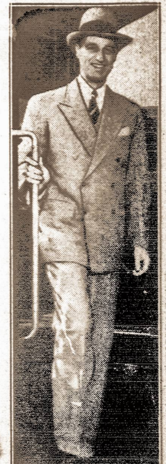
Filminkas. — Prezidento sūnus James Roosevelt, dabar įstoja į kino filmų biznį Hollywoode. Jis gaus apie $50,000 metinės algos.

KAUNAS. — Žydų spauda rašo, kad Lietuvos piliečiai vokiečiai įsteigė mažas pasikeltimas temperatūroje. Saulė teka 7:06, leidžiasi 4:29. Dienos ilgis 9 val. 21 min.