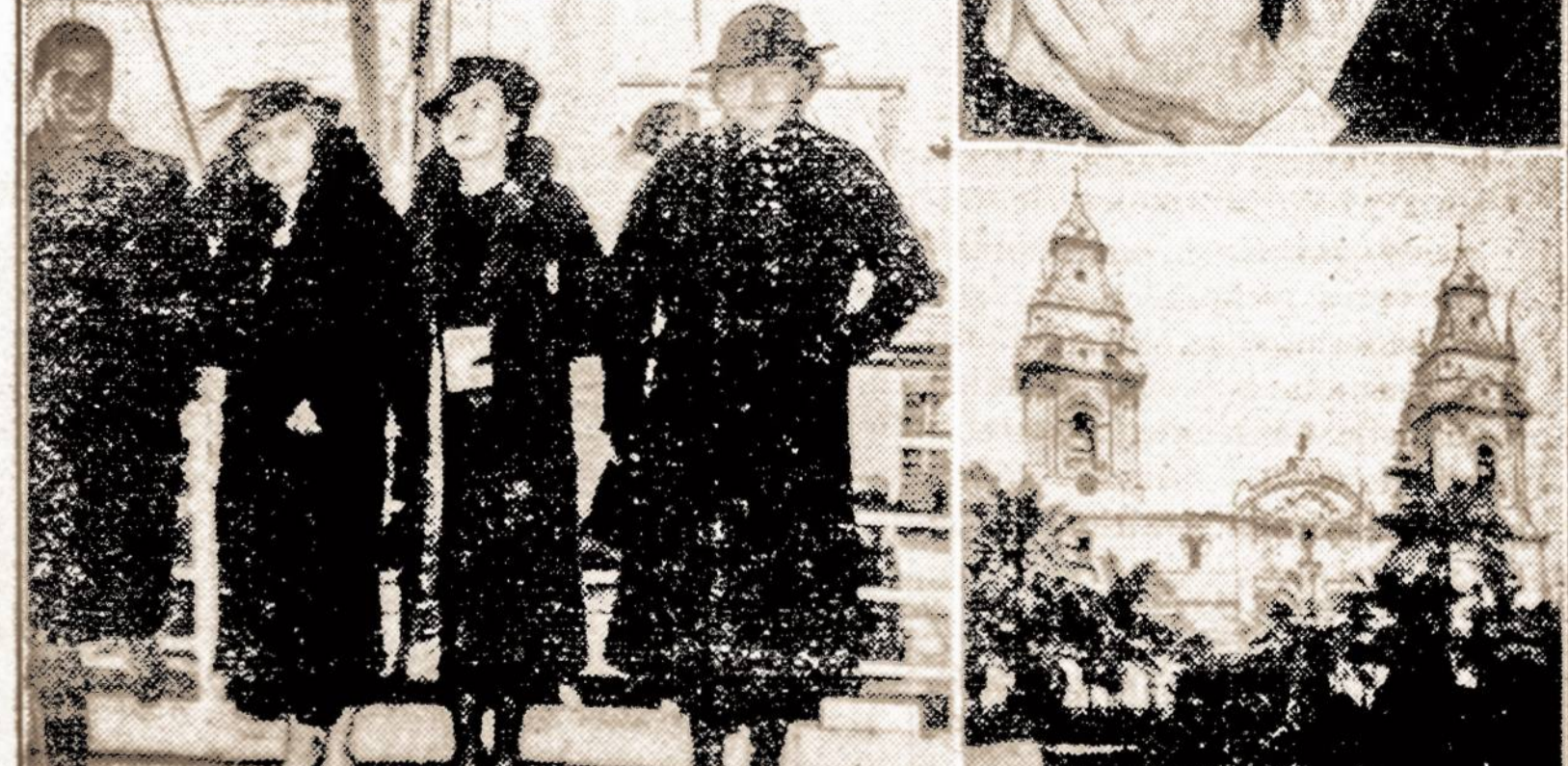
Pan-Amerikos Konferencija. — Aštuntoji Pan-Amerikos konferencija, kurioje dalyvavo 21 Amerikos valstybė, prasidės Lima mieste, Peru, gruodžio 9 d.