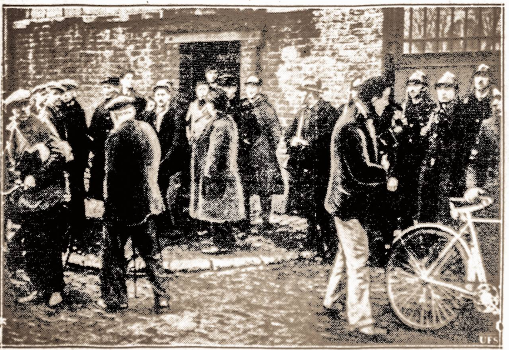
Streikuoja. — Prancūzijoje kai kurių pramoninių darbininkai vis dar streikuoja. Čia matyti būrys darbininkų užsidariusių Renault auto dirbtuvėse. Policija ir kariuomenė juos vėliau išvaikė.

VILNIUS. — "Slowo" skiltyje žurnalistas Jozef Mackiewicz, rašydamas apskritai apie nežinomus kareivius ir jų palaidojimo vietą, sykiu kviečia, kad atitinkami sluoksniai susirūpintų ir Lietuvos-Lenkijos karo metu žuvusiais lietuvių karių kapais. Girdi, to reikalaujas pats žmoniškumas ir, abiejų tautų kas kartas gerėja santykiai. Ypač nesmaugu esą žiūrėti Rusų kapinėse į lietuvių karininkų atminimą įžeidžiančius antkapius.