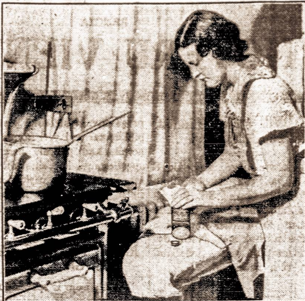
A potential victim is the housewife who uses cleaning fluid near the open flame of her kitchen stove.

THE dangers that lurk in the home have only been brought forcibly to the attention of the public within the past two years, through activity of the American Red Cross and other safety agencies. Public attention has been concentrated in greater degree upon the upward trend of the death toll from motor accidents. In 1937 motor vehicle accidents claimed 33,500 lives. Accidents in the home claimed 32,500 lives.