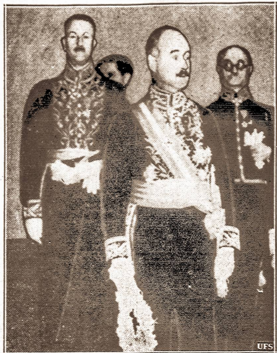
Prancūzija nenusileidžia Italijai. — Prancūzijos pasiuntinys Italijai Francois-Pon cet įteikė Italijos vyriausybei Prancūzijos atsakymą dėl Tuniso, Savoy ir Korsikos salos.

PARIS, gruodžio 7d. — Vakar apie 3 val. 40 min. popiet Prancūzijos Užsienių Reikalų Ministras Georges Bonnet ir Vokietijos Užsienių Reikalų Ministras Von Ribbentrop pasirašė Prancūzijos Vokietijos taikos ir nepuolimo sutartį. Tuo būdu vienuolika šimtmečių užsitęsęs Prancūzijos Vokietijos ginčas dėl Elzaso, oficialiai baigtas ir tikimasi, kad dabar tarp tų dviejų valstybių žymiai pagerės santykiai ir vienas kitu pasitikėjimas.