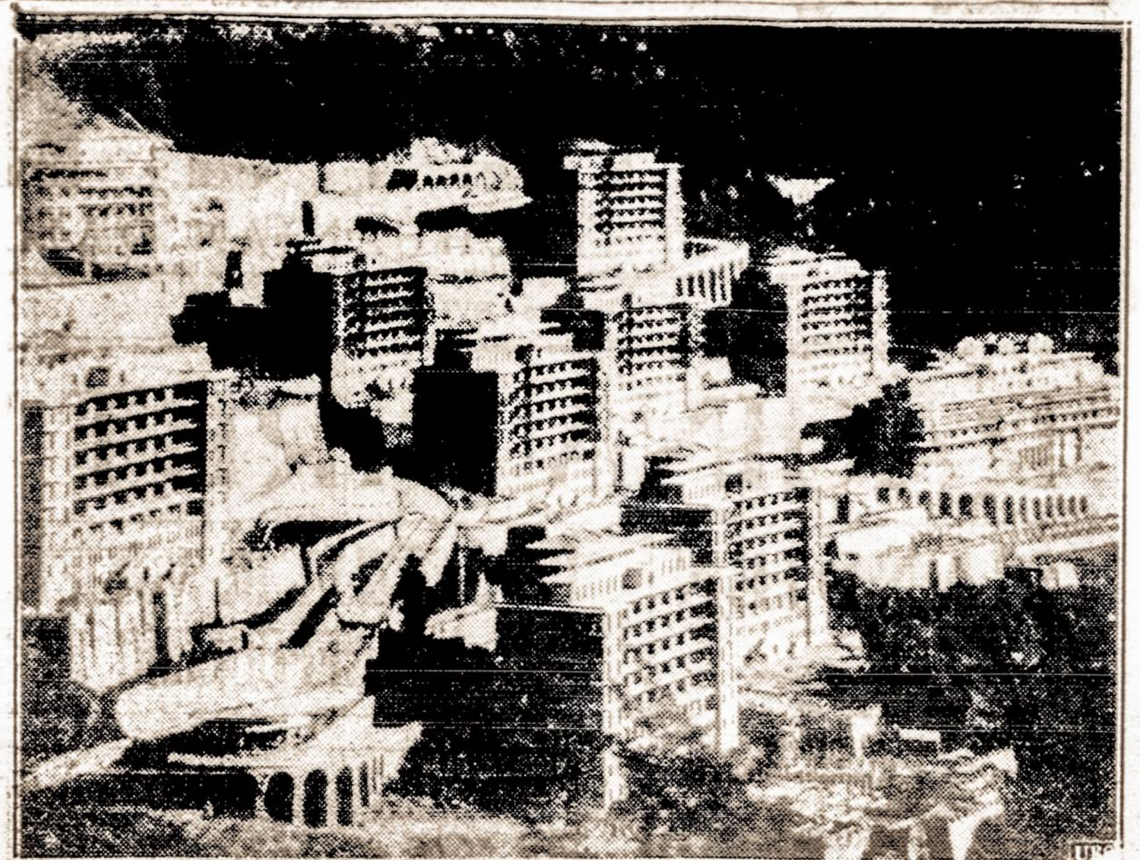
Džiovininkų miestas. — Italijos Alpėse pastatytas beveik visas miestas, kurį sudaro išimtinai džiovininkų su natorijos, kuriose yra apie 3,000 ligonių. Miestelį sudaro apie 19 atskirų ligoninių. Dabar Italijoje nuo džiovos miršta beveik 50% mažiau, negu anksčiau.