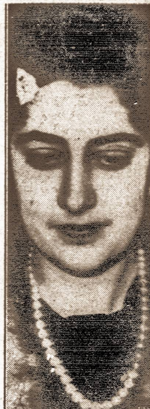
Išleka. — Romoje paskelbta, kad Italijos karaliaus dukterė Princesė Maria netrukus ištekės už Princo Louis Bourbono.

Šiais metais iš Lietuvos paukščiai į šiltus kraštus skrido daug vėliau, kaip kitais metais.