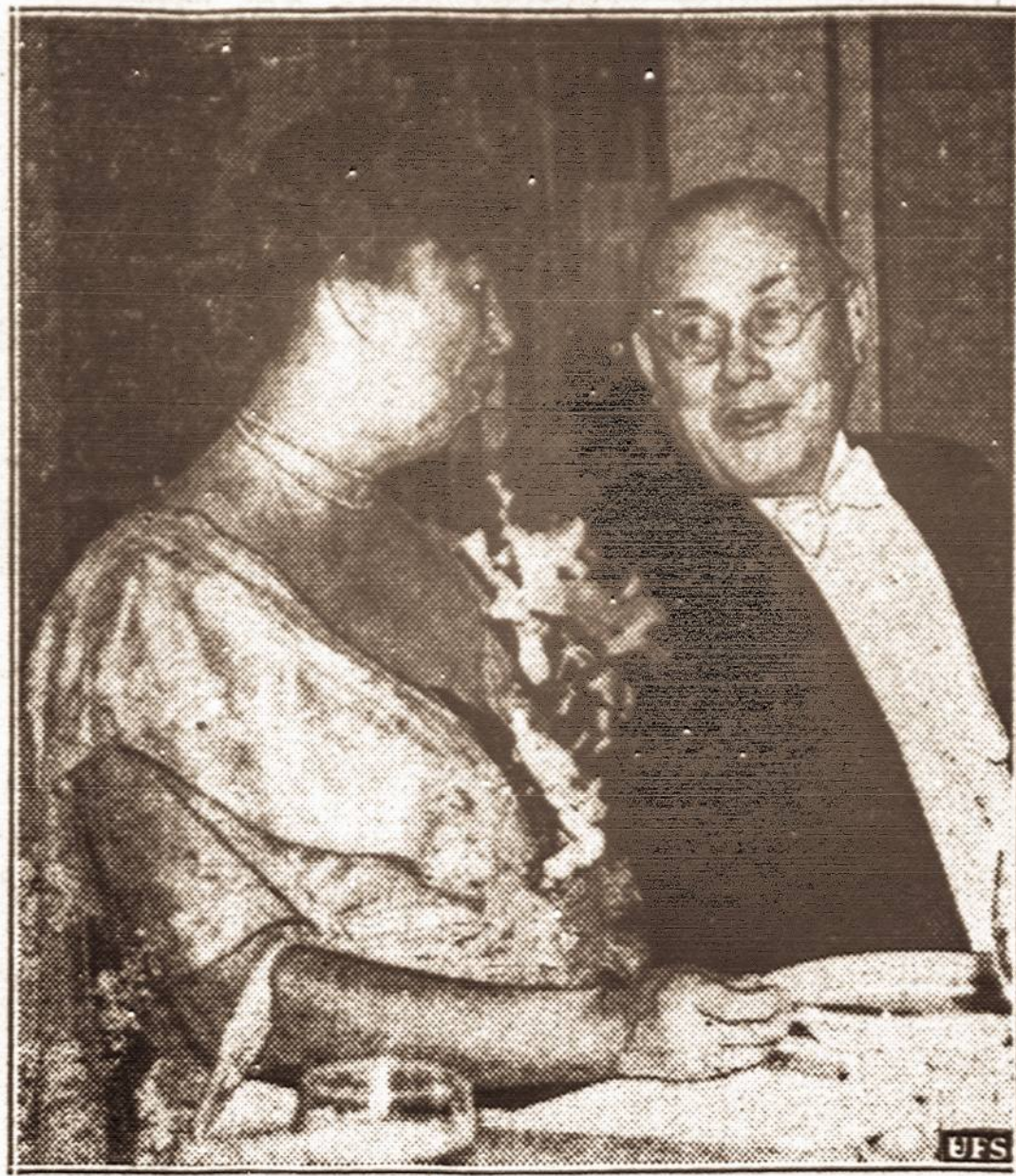
Prašo pagalbos tremtiniais. — J.A.V. prezidento žmona p. Rooseveltiene šiomis dienomis kartu su A.D.F. Pirmininku p. Green dalyvaus New Yorko surengtoje vakarieneje, kurioje kalbėta apie pagalbos teikimą ištremtiems iš Vokietijos žydams.

Prieš pat šventes paštai užpildyti sveikinimų ir siunčiamųjų atvirukų laiškais. Pašto vyriausybė kreipiasi į siuntėjus ir prašo domės kreip-