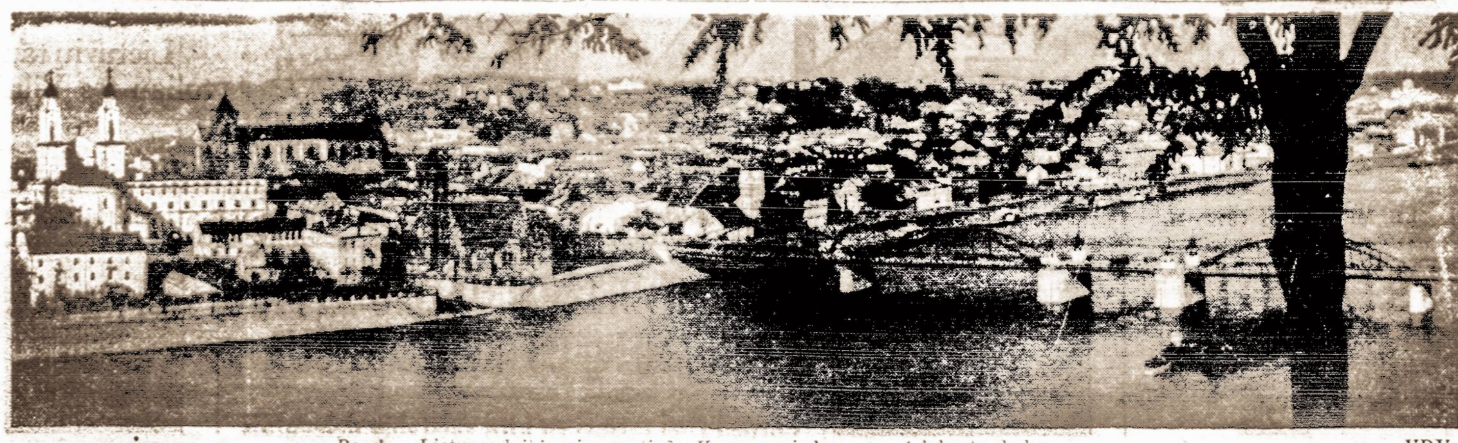
Bendras Lietuvos laikiniosios sovietinės Kauno vaizdas nuo A. Leksoto kalno.