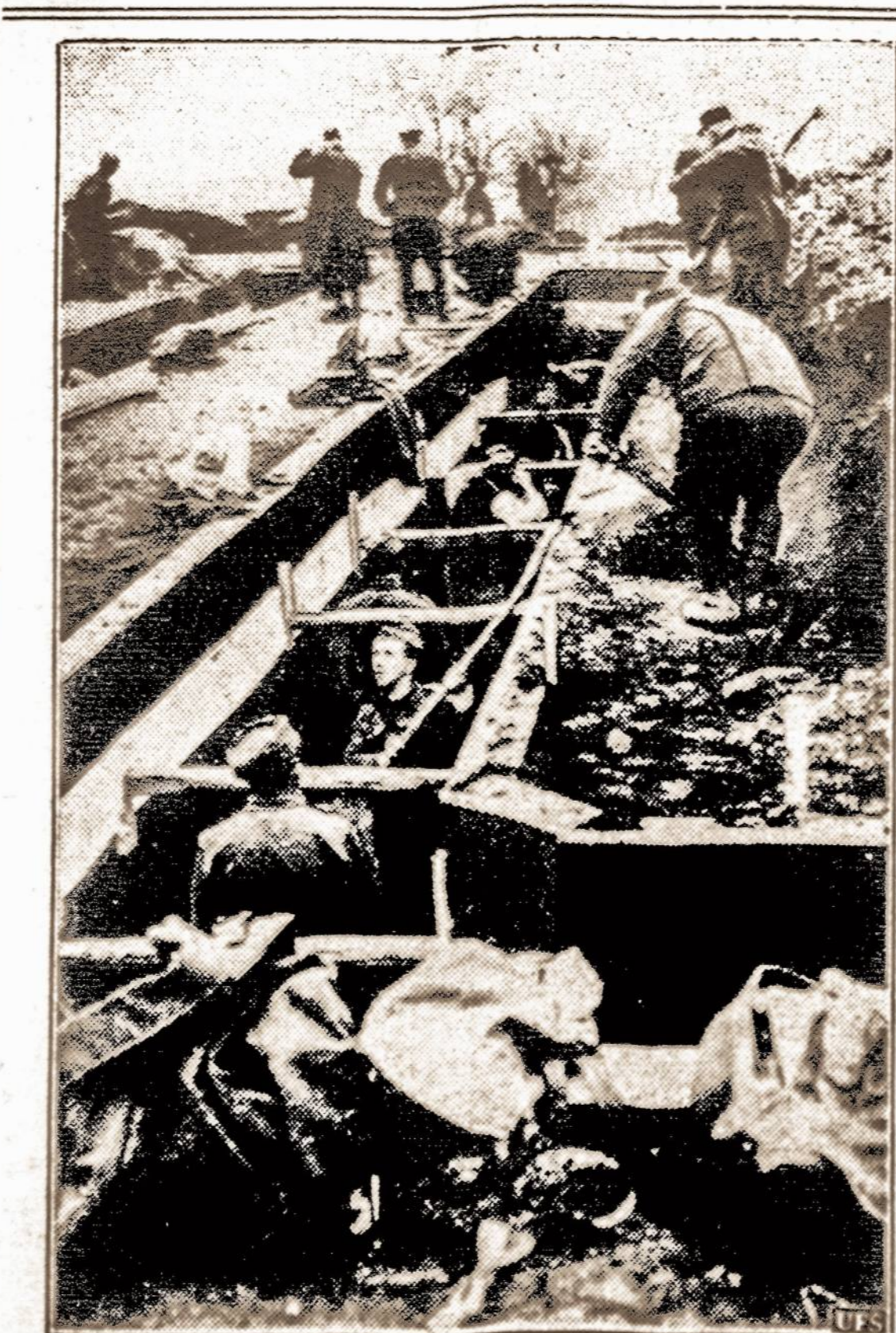
Cekų darbo batalijonai. — Čekoslovakijos Darbo Batalijono nariai dabar tiesia naujus kelius, kurie jungia čekų pramonės centrus su provincija. Vokiečiams paėmus sudetų kraštą čekai neteko daugelio kelių ir geležinkelių, kuriuos finansuoja iš anglų gautais pinigais.

KAUNAS, gruodžio 6 d. — Šiomis dienomis pradėta statyti būsimomis Europos krepšinio pirmenybėms Kaune sporto salė, kurioje tilps 13,000 žiūrovų. Pirmenybės globos Valstybės Prezidentas.