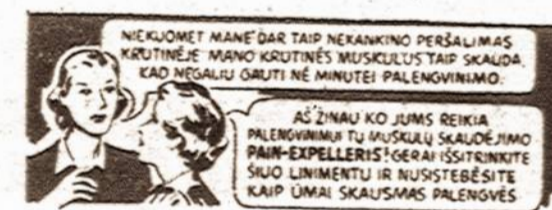
Navojamas visame pasaulyje nuo 1867 metų

Šie, rodos, maži apsaugos būdai, bet daug padės Jūsų ir kitų apsisaugojimui nuo nelai- mingų atsitikimų. K.