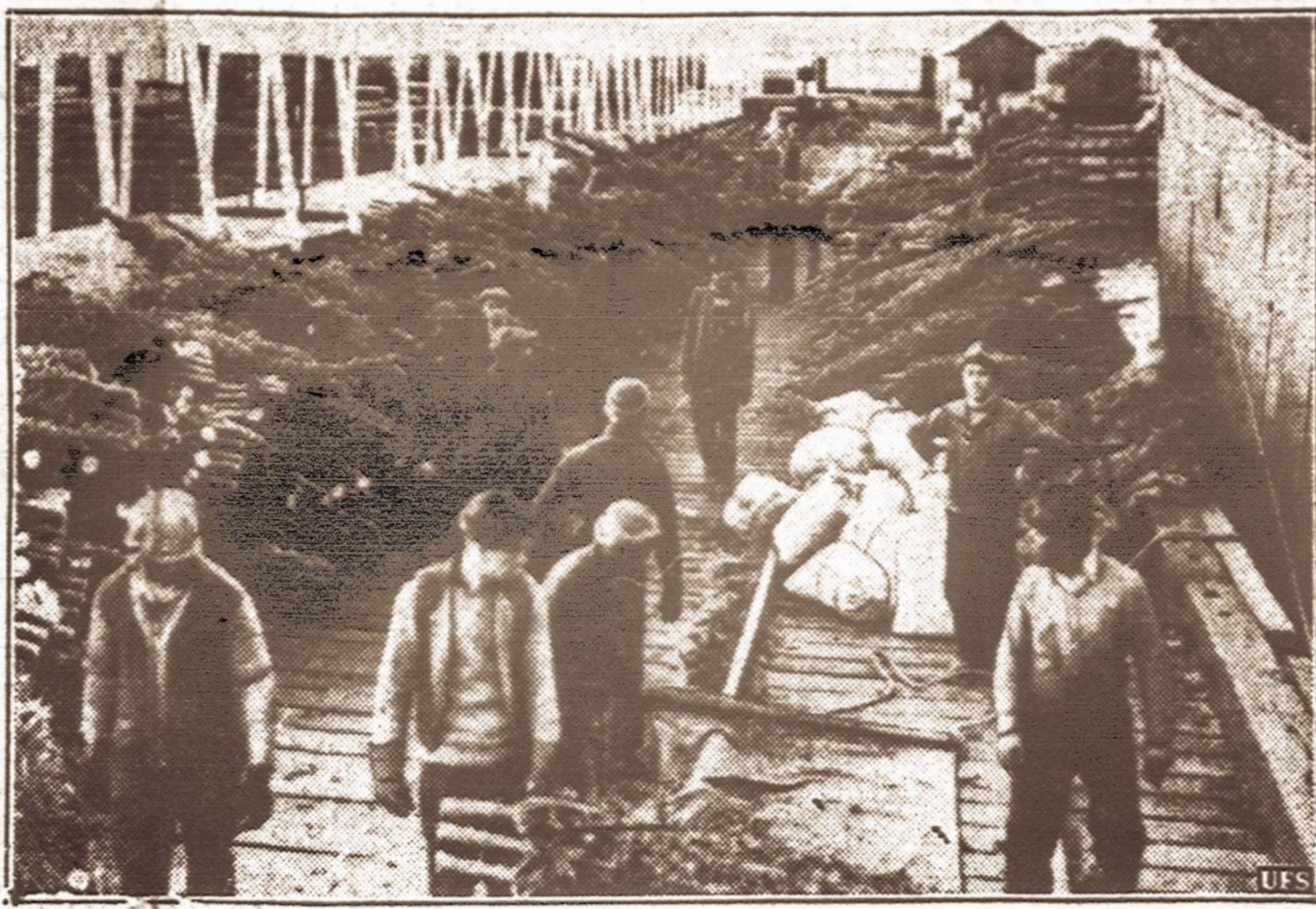
Eglaitės iš Newfoundlando. — New Yorką Kalėdų šventėms aprūpinti eglaitėmis jų laivais gaunama iš Newfoundlando. Taip pat daug atsijūnčiama iš Maine ir kitų valstybių.

Thetfordo kasyklose, po didelio sprogimo žuvo 7 žmonės. Visi dirbo apie 20 pėdų žemės gilumoje, kada įvyko sprogi-mas.