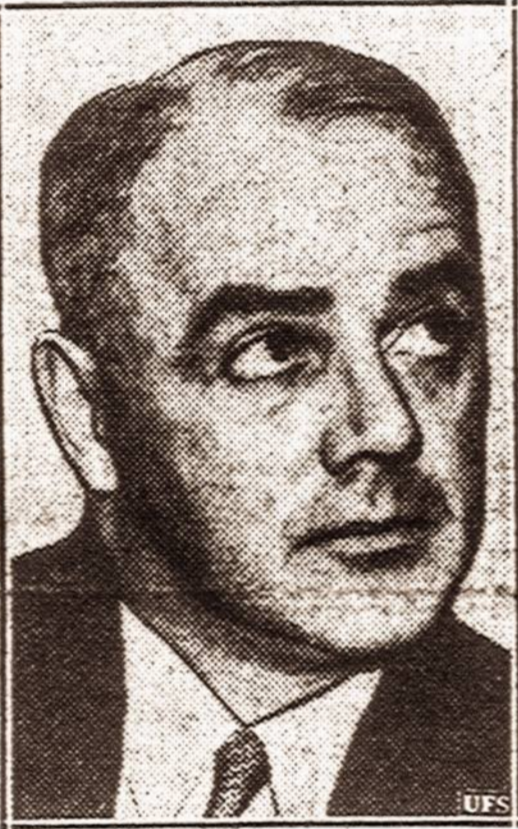
Pyksta. — New Jersey kongresmenas J. Parnell Thomas, kuris reikalauja, kad Darbo Sekretorė Miss. Perkins rezignuotų, dėl to, kad neišdeportuoja komunisto Harry Bridges.

Numatoma: Giedra ir šaltiau. Saulė teka 7:09, leidžiasi 4:29. Dienos ilgis 9 val. 19 min.