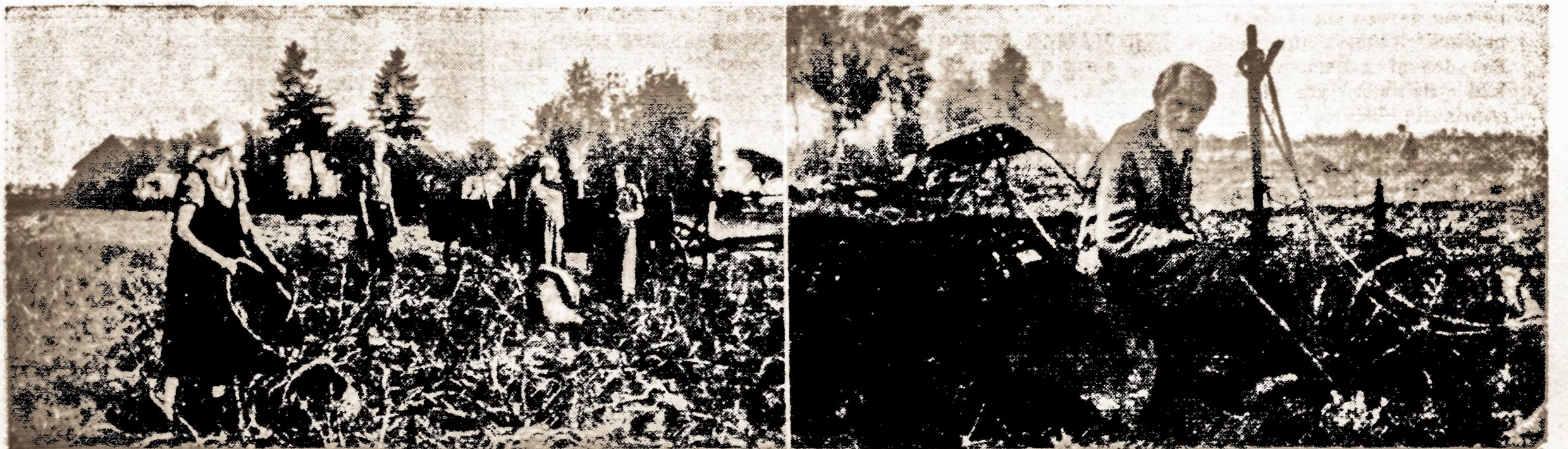
Klaipėdos krašto provincijos vaizdai. Kairėje, klaipėdiētės Gudų apylinkėje kasa bulves. Dešinėje, senas pelkninkas iš Ruguliių kaimo prie savo darbo frankių. VDV