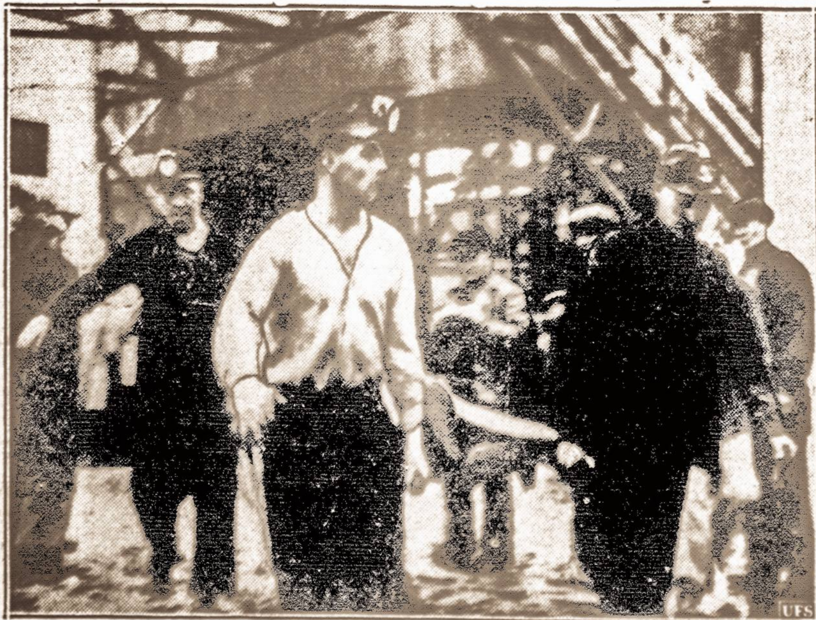
Kur žuvo 16 angliakasių. — Princess anglies kasykla Nova Scotia, kur šiomis dienomis nelaimėje žuvo 16 angliakasių.

KAUNAS. — Pranešama, kad šiuo metu Darbo Rūmų surengtus bendrojo lavinimosi kursų darbininkams lanko 1,238 darbininkai. Vien Kaune veikia penki tokie kursai, o šiomis dienomis atidaromi dar Petrasiuose ir Veršvuose.