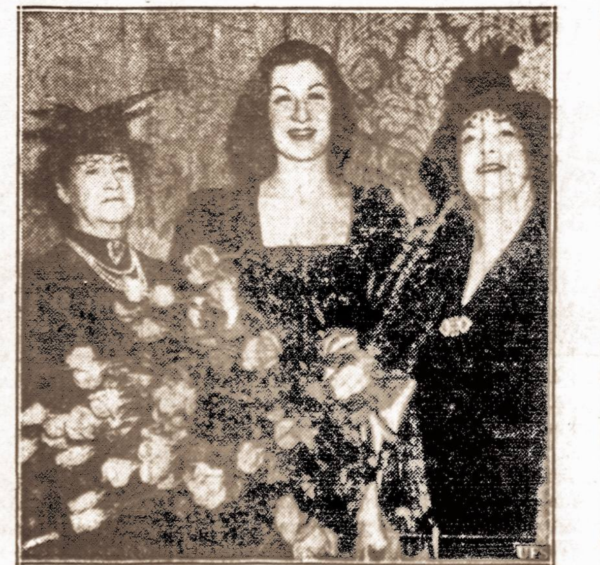
Nauja operos artistė. — Gertrude Bibla, buvusi mašinistė, priimta į Metropolitan Opera.