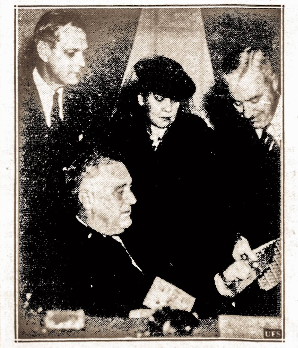
Aukoja kovai su džiova. — Prezidentas Rooseveltas perka specialiai National Tuberculosis Association išleistas kalėdinius ženklelius, kurių pelnas skiriamas kovai su džiova.