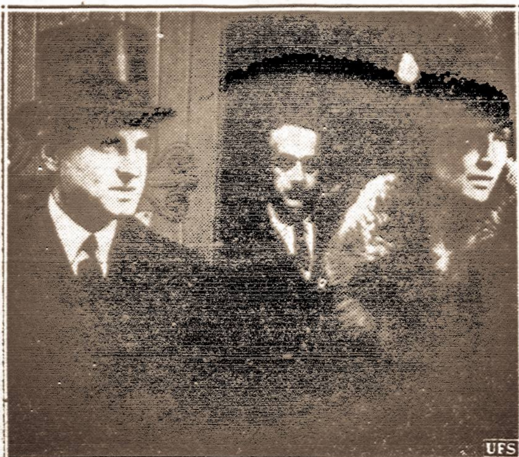
Šamokslas nužudyti Jugoslavijos regentą. — Londone gauta žini, kad šiomis dienomis iš New Yorko išvyksta šamokslininkai nužudyti Jugoslavijos regentą Princa Pauļių. Dėl to jis su princese Olga iš Londono išvyko.