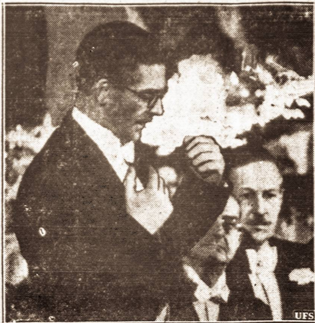
Meramus laikotarpiu. — Buvęs Anglijos Užsienių Reikalų Ministras Anthony Eden, kuris New Yorke dalyvavo pramoninkų konferencijoje, šiomis dienomis aplankė Amerikos Prezidentą Rooseveltą.

Privaziavimas patogus. Paimkite Jamaica traukinį ir išlipkite Forest Parkway stotyje, iš kur tik vienas blokas ir pusė iki krautuovės, 1913 Jamaica Ave., Woodhaven, L. I., N.Y.