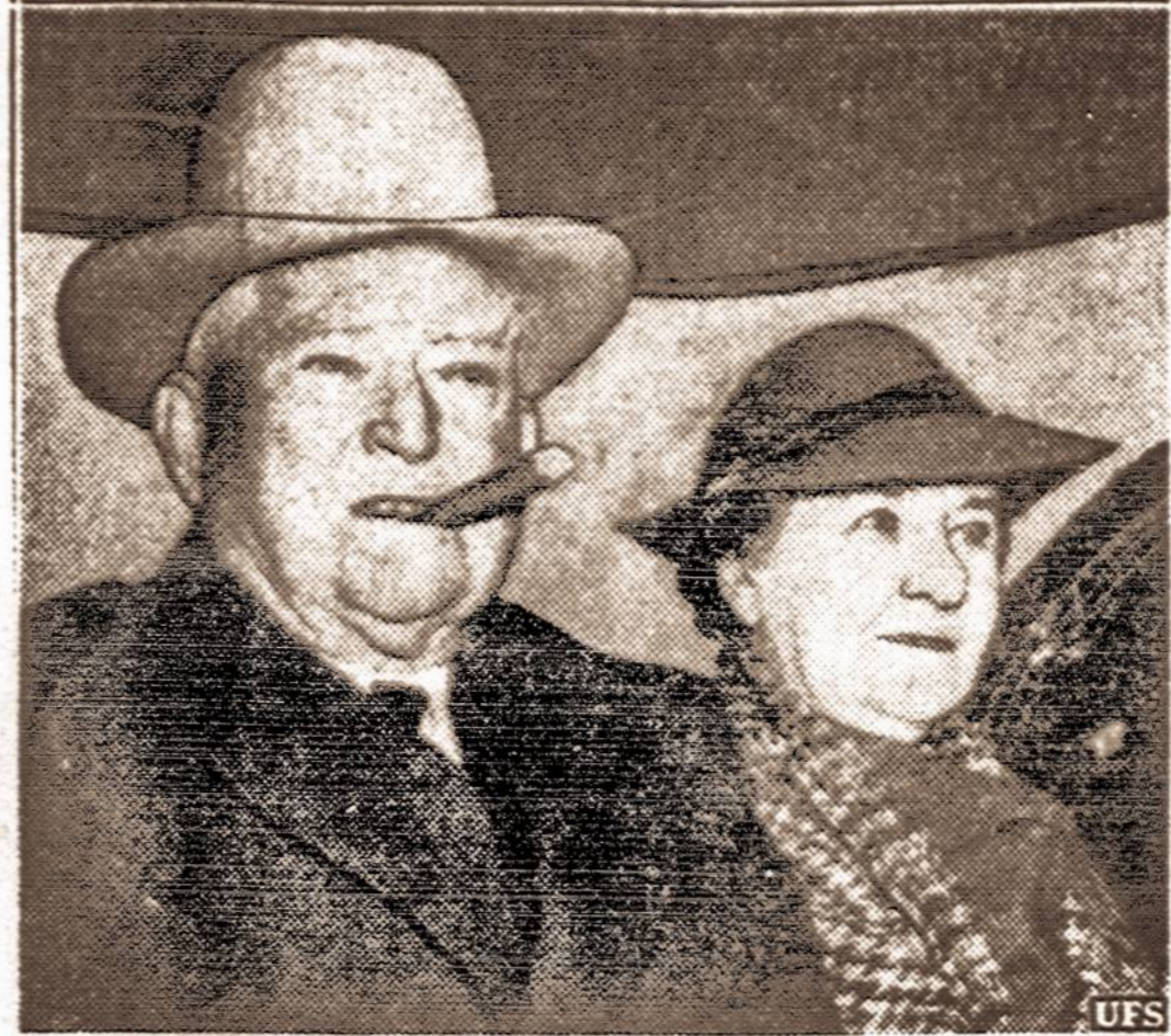
Viceprezidentas. — Jungtinių Amerikos Valstybių viceprezidentas John N. Garner, šiomis dienomis grįžęs iš Washingtono, ilgai kalbėjosi su prezidentu Rooseveltu 1940 metų rinkimų reikalu.

ROMA, Italija. — Nežiūrint visų Mussolinio raginimų, kad jauni Italijos gydytojai vyktų apsigyventi Etiopijoje ir Libijoje, iki šiol beveik nė vienas italų gydytojų nesutiko vykti į tas italų kolonijas apsigyventi.