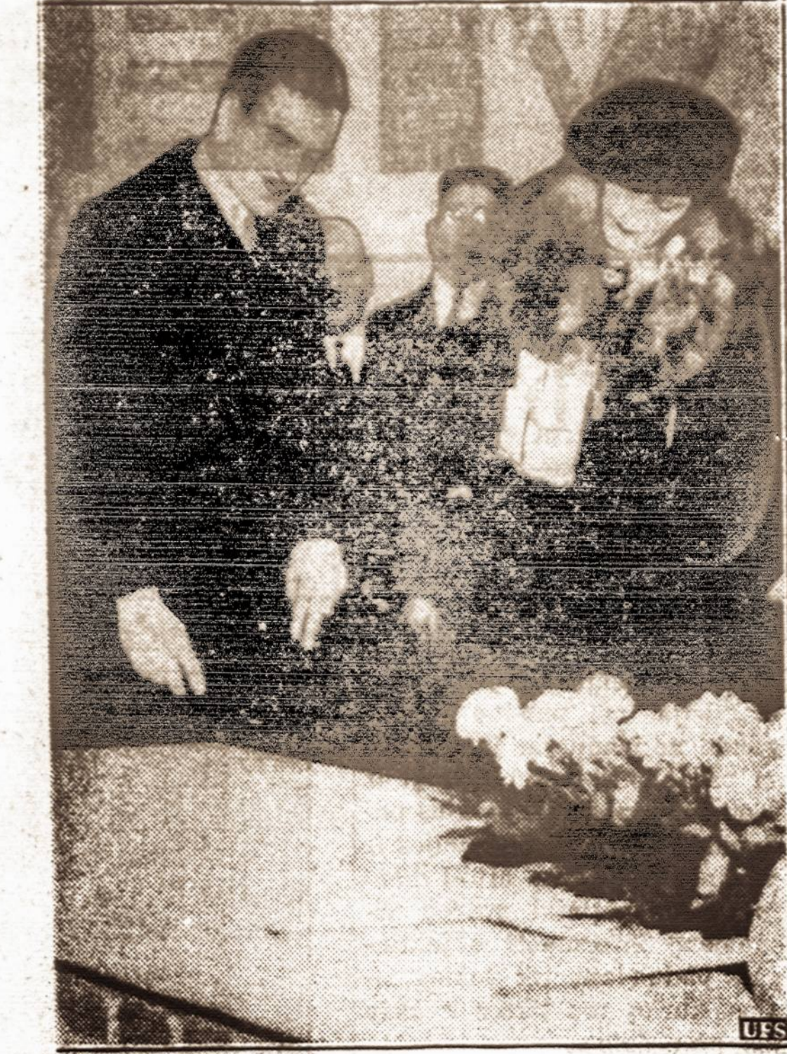
Antanas Edenas. — Buvęs Anglijos užsienio reikalų mi-nistras su žmona išvyksta atgal į Angliją.