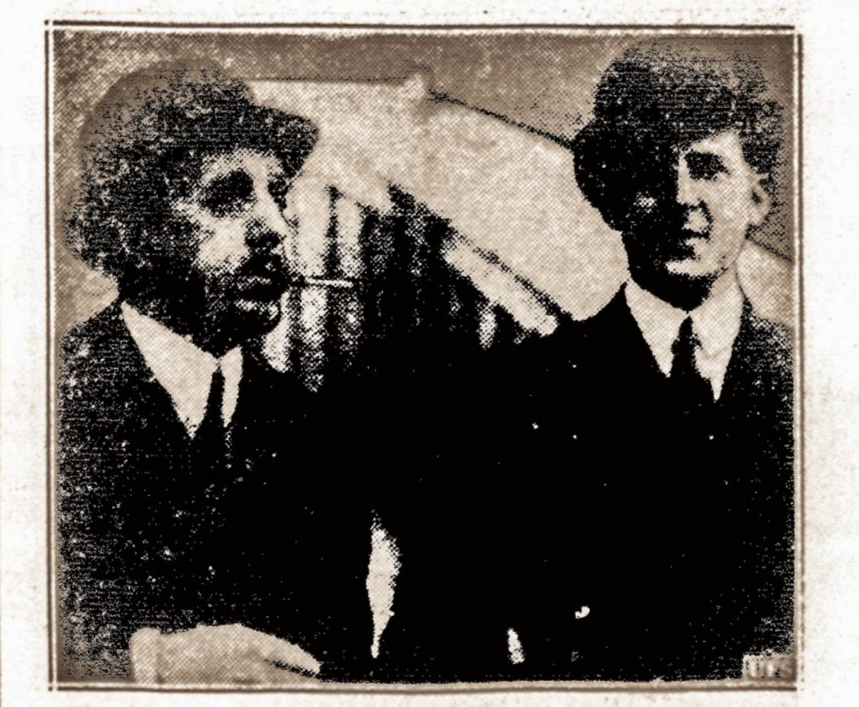
Sukilėlių karalius. — Buvęs Ispanijos karalius Alfonso-s, kuriam neseniai Ispanijos frankistai grąžino Ispanijos pi-lietybę. Desinėje yra Alfonso sūnus, kuris tikiai būti Is-panijos karalium.

Klaipėdos uostas iš žvejų ir malkų uosto Lietuvos valdyme virto dideliu modernišku uos-tu. Nuo 1923 m. iki 1936 m. imtinai Lietuva investavo uosto patobulinimams ir praplėti-mui 27,664,763 litus. "Šiuo lai-ku egzistuoja visam pasauly tik keletas uostų, kurių trafi-kas, nepaisant pasaulinės kri-zės, padidėjo, tokie uostai yra Gdynė, Lisabonas, Jaffa ir Klaipėda" — rašo belgų laik-raštis "Lloyd Anversois" 1935 m. balandžio 21 d. numeryje. Dabartinis metu beveik visas Lietuvos eksportas ir impor-tas eina per Klaipėdą. (Daugiau bus)