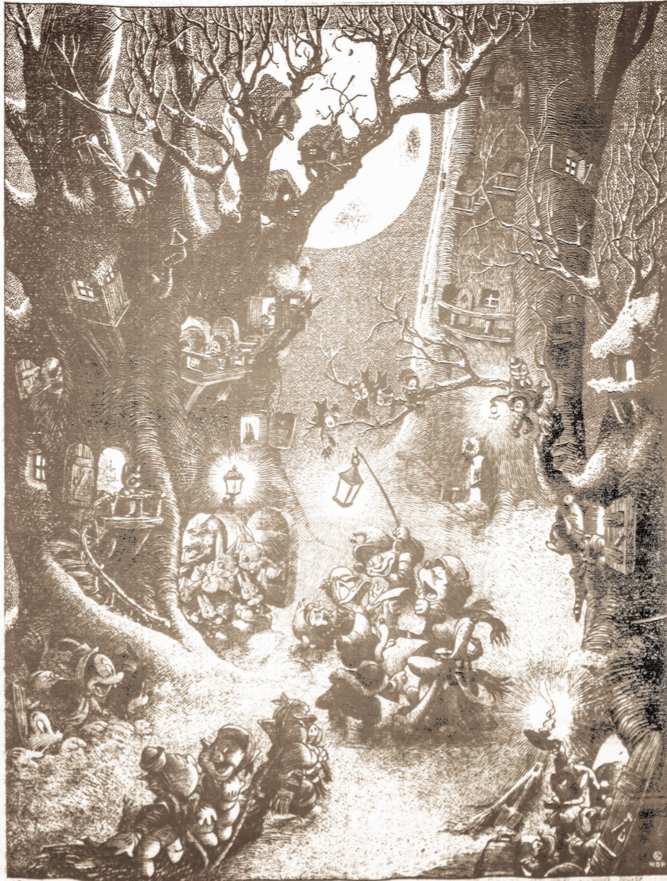
Vairduojama besiatinančių Naujų Metų nuotaika.