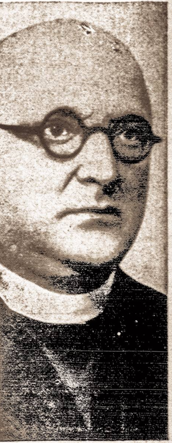
Kun. Vladas Mironas Lietuvos Ministras Pirmininkas

KAUNAS, gruodžio 28 d. — (Eltos kablegrama iš Kauno) — Ministras Pirmininkas Mironas gruodžio 23 dieną padarė pranešimą Seime išdėstydamas vyriausybės programą; kalbėdamas apie Lietuvos užsienio politiką jis pirmiausia kreipėsi į tautą ragindamas susitelkti apie vyriausybės dabartinį metu kada nepalaužiamas visos tautos pasiryžimas likti laisviams sudaro tikriausia nepriklausomybės garantija; paskui Ministras Pirmininkas pasisakė prieš globą iš kitų valstybių pusės ir pabrėžė Lietuvos pastangas pagerinti savo santykius su kaimynais, tačiau pridėdamas, kad šitos pastangos nereikia neribotų nuolaidų politikos; pereinamas prie atskirų klausimų jis pranešė, kad netrukus bus priimtas neutralumo įstatymas ir kad dabar jau pasirašytas prekybos susitarimas su Lenkija; jis taip pat išdėstė kontaktą su Vokietija dėl klausimų liečiančių Klaipėdą. Iš šio pranešimo matyti, kad Vokietijos pageidavimu vyriausybė jau yra padarėsi daug didelių nuolaidų ir yra Vokietijai pasiūlius bendrai susitarti dėl skubios procedūros interpretuoti statutą. Vienas vyriausybės narys yra pasirengęs vykti į Berlyną, jeigu vokiečių vyriausybė šita kelionę rastų esant naudinga galutiniam lietuvių vokiečių santykių išaiškinimui.