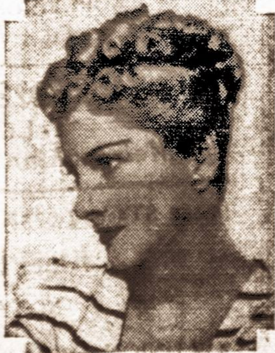
Nauja plaukų šukusena. — Filmų artistė Joan Fontaine parodo naują plaukų šukusena, kuri, tikimasi, šiais metais bus populiari.