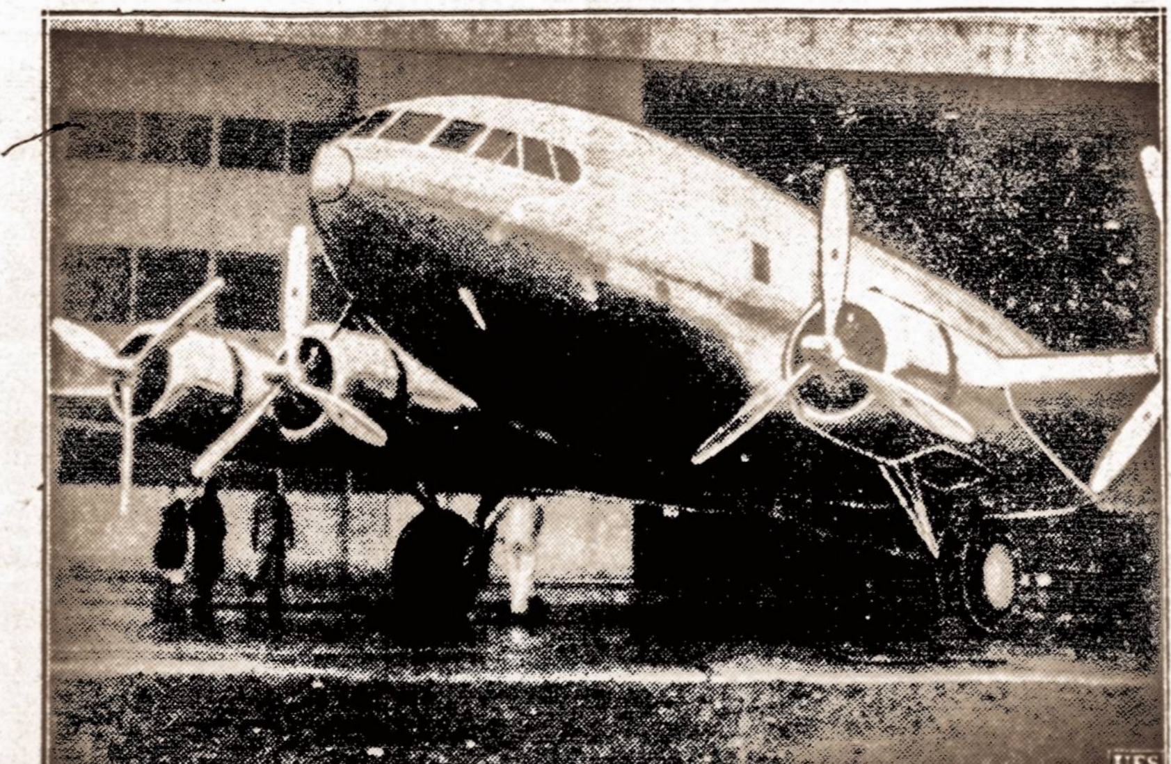
Nauji sub-stratosferiniai lėktuvai. — Jungtinėse Amerikos Valstybėse statoma visa eilė naujų sub-stratosferinių keleivinių lėktuvų, kurie galės pakilti 20,000 pėdų aukštumoje ir skristi vidutinišku greičiu 240 mylių per valandą. Lėktuvuose tilps 33 keleiviai ir įgula.

LONDON, sausio 3 d. — Žiniomis iš Ispanijos, frankistų policija sulaikė Anglijos konsulą San Sebastiane, Ispanijoje. Taip pat sulaikyta ir jo žmona. Konsulas kaltinamas snipinėjės svetimos valstybės naudai.