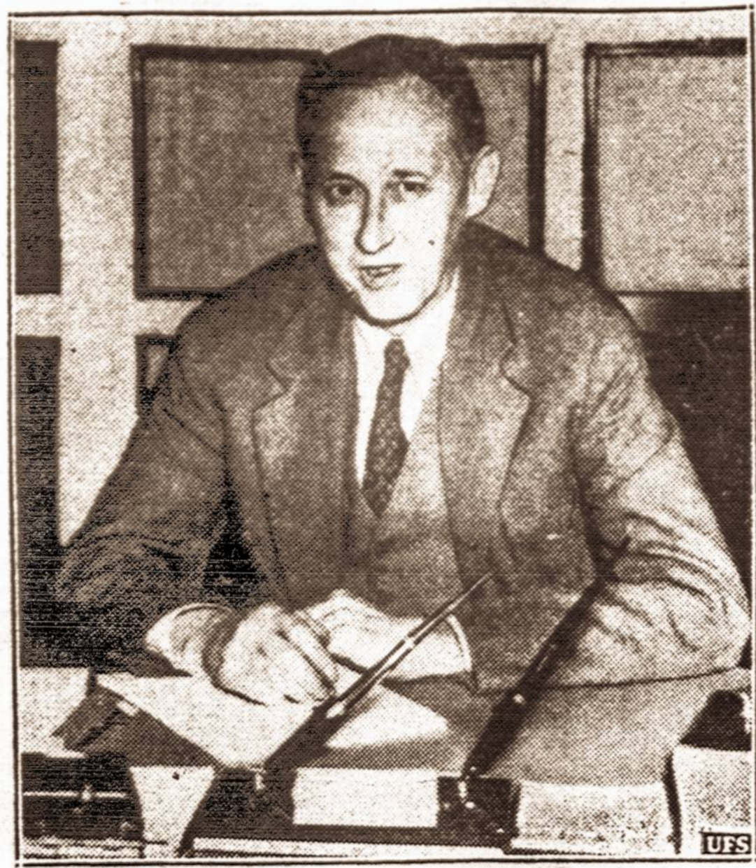
Prekybos Sekretorius. — Harry Hopkins, naujasis J.A. V. Komercijos Ministras, prieš kurį yra paduota skundų Kongresui.

Pirmą kartą New Yorko istorijoje Naujų Metų švenčių metu savižudžių skaičius pasiekė 27. Keletas bedarbių paliko laiškus, kuriuose rašo, kad ne-