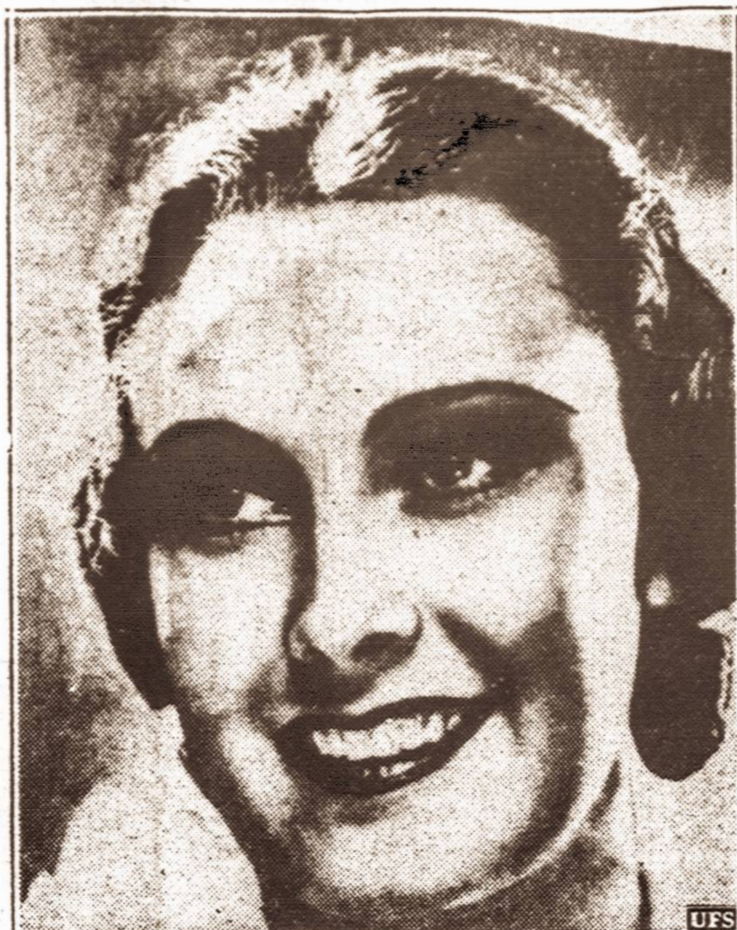
Lida Baarova. — Čekų filmų artistė, kuri, sakoma, sužavėjo Vokietijos Propagandos Ministrą Goebbels. Jos vyras Gustav Froelich jau kuris laikas išsiūstas į koncentracijos stovyklą.

McKEESPORT, Pa., sausio 3 d. — Vakar apie 200 pėdų gilumoje vietinėje anglies kasykloje įvyko didelis dujų spro-gimas, kurio metu užmuštas vienas angliakasis ir trys sunkiai sužeisti.