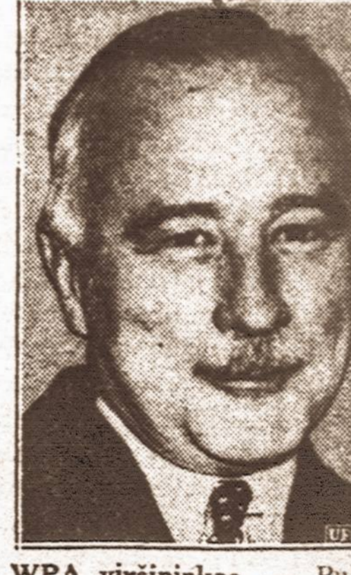
WPA viršininkas. — Pulk. F. C. Harrington, naujasis WPA viršininkas, paskirtas vietoj Harry Hopkins, kuris dabar yra J.A.V. Prekybos Sekretorius.

Sausio 2 d. Ontario provincijoje, Kanadoje kilo didelė gaisras, kuris sunaikino visą kaimelį.